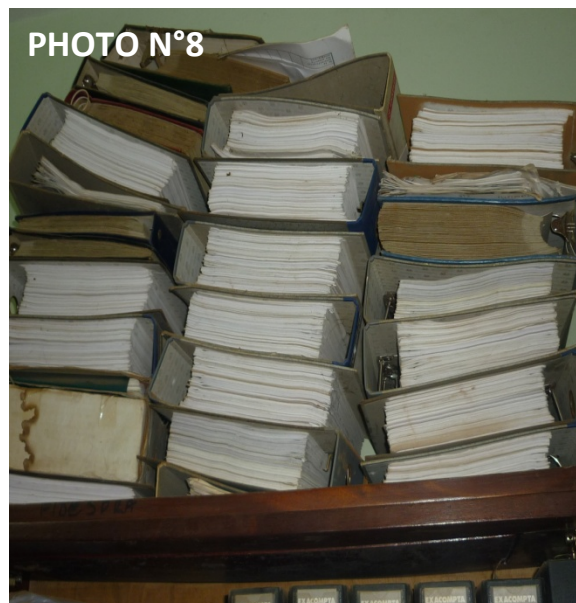
Mauvaise conservation des documents d'archives datant de 1995 au secrétariat général d'entité