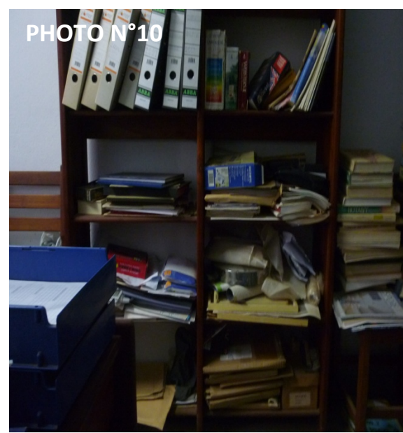
Dossiers d'archives du secrétariat de la BIDOC