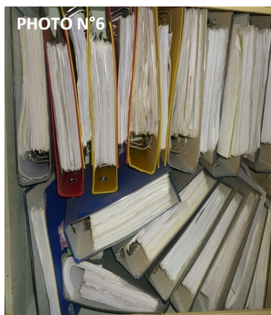
Dossiers d'archives datant de 1998 abandonnés dans les armoires du secrétariat administratif central