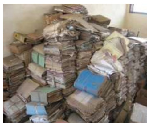
Photo 2 : Des archives jonchant les planchers des différents niveaux du bâtiment