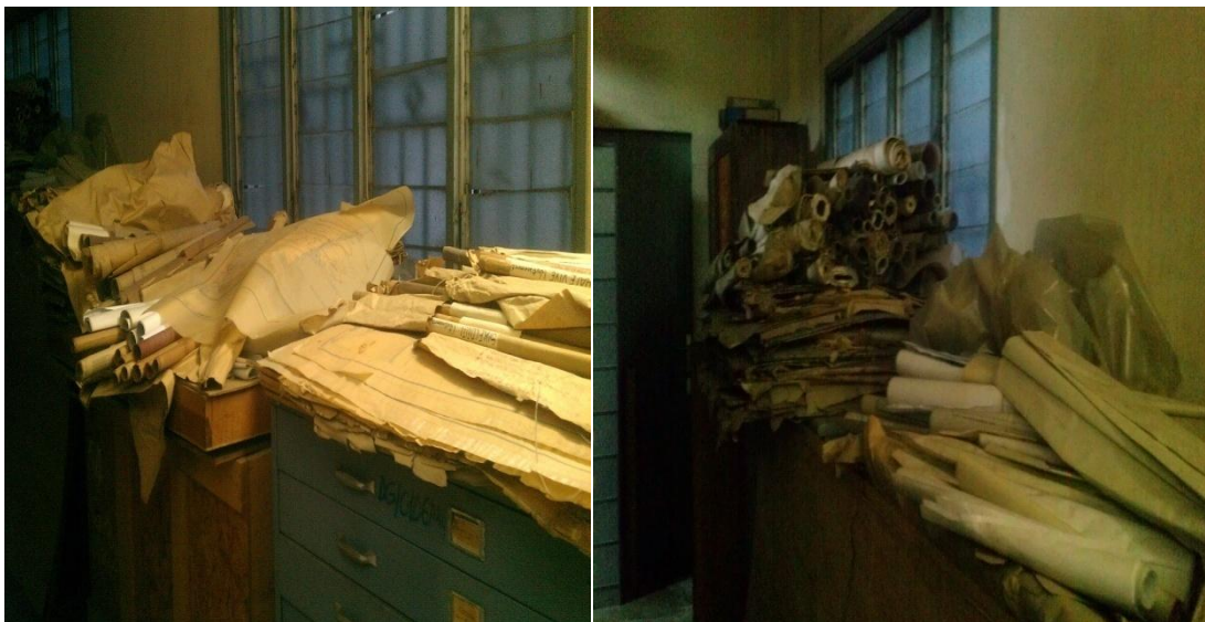
Figure 1 : Vue partielle de l'état désolant de conservation des archives

Quant à la section archives, les documents qui y sont transférés ne sont pas bien conservés. En effet, le local abritant la section n'est pas approprié car il sert à la fois de magasin et de bureau. De plus, il est inadéquat et exigü. Ce qui ne favorise pas le traitement efficient des documents. Nous notons également la faiblesse de l'éclairage et l'exposition des documents aux agents destructeurs et à la poussière.