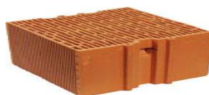
Figure 2 : Proposition de brique

Il faut choisir des matériaux de construction résistant aux conditions climatiques locales, aux insectes, aux agents biologiques et au feu. Les briques « mono mur » sont conseillées pour la construction des bâtiments d'archives. Ce sont des briques en terre cuite, qui présentent de très nombreux alvéoles emprisonnant de l'air et donc offrant une bonne isolation thermique.