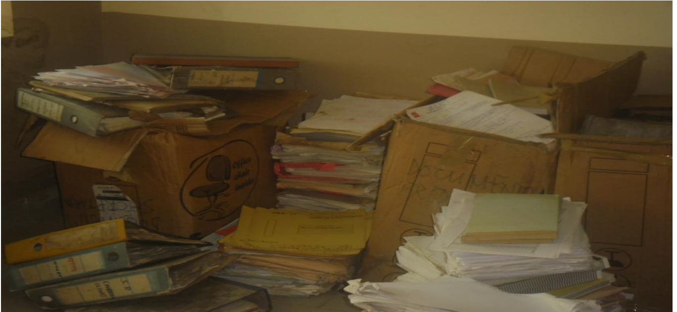
Documents en vrac au quatrième étage