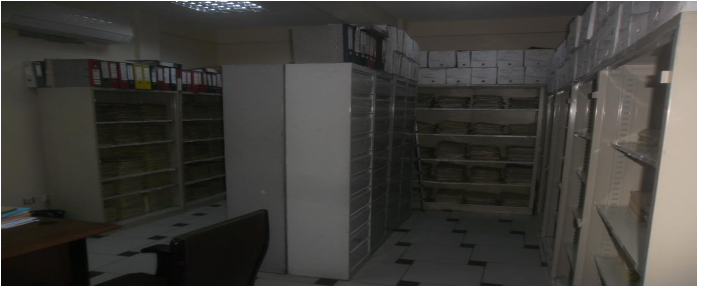
Fonds actif de l'UBA-Vie