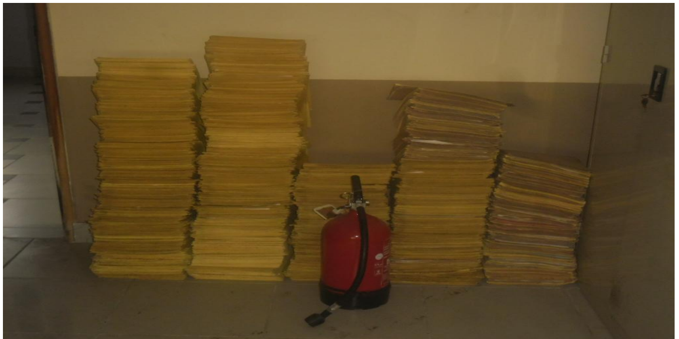
Pile de dossiers inactifs au quatrième étage