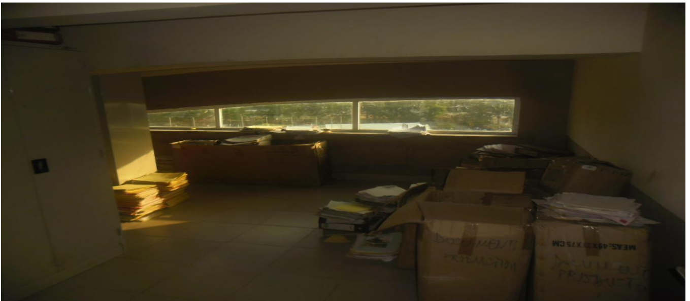
Image montrant l'insuffisance de mobilier de stockage