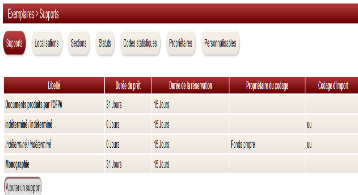
Figure 2 : Interface de paramétrage d'exemplaire