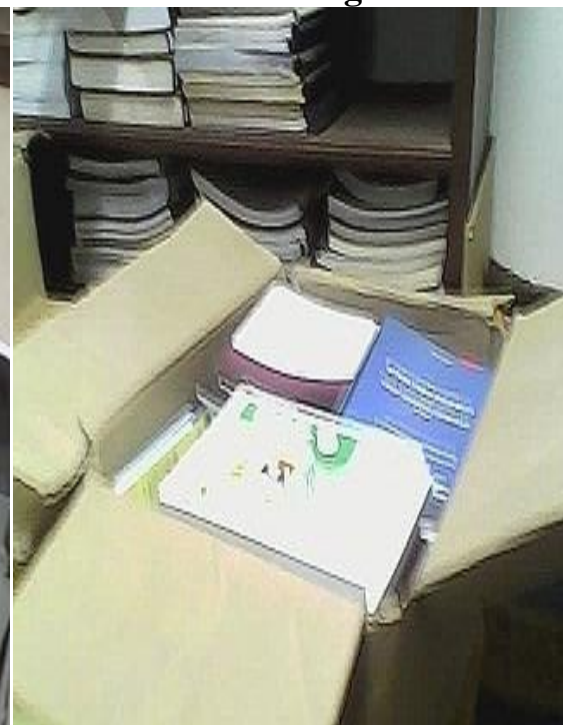
Documents entassés dans des cartons au magasin du Dépôt Légal