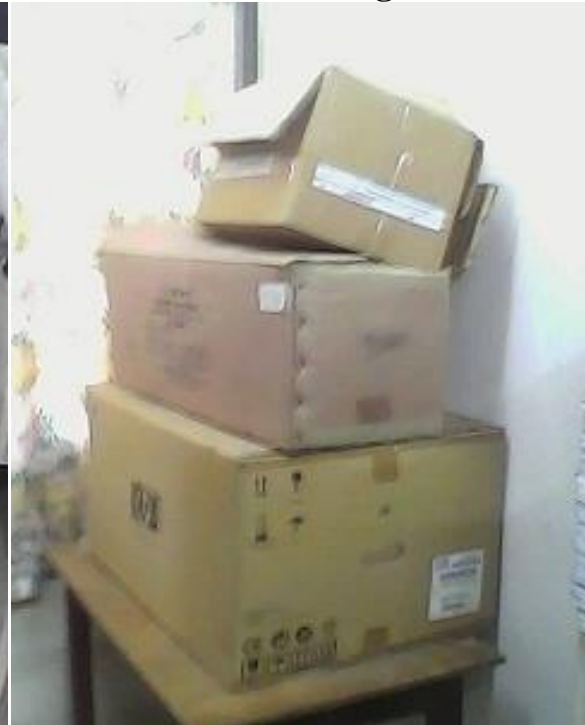
Cartons servant au rangement des documents, conséquence du manque de rayons