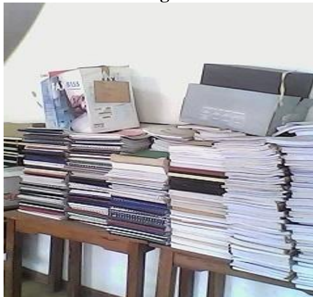
Thèses, mémoires et rapports entassés, en attente de traitement au Service du Dépôt Légal