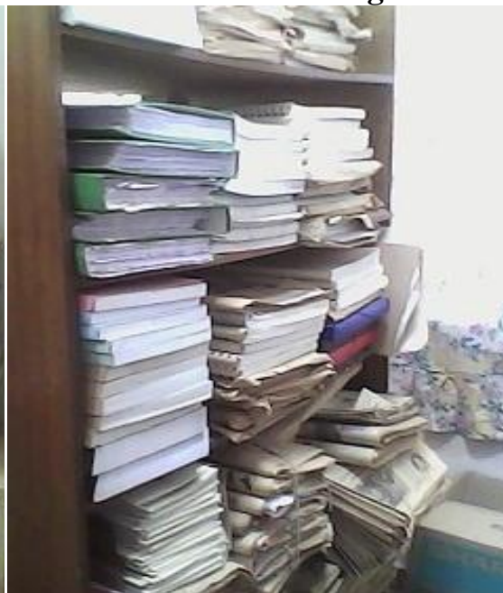
Etat de rangement des documents au magasin du Dépôt Légal