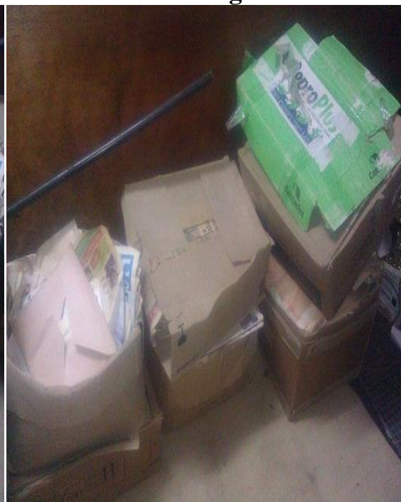
Documents rangés dans des cartons à même le sol dans la salle cartes et estampes