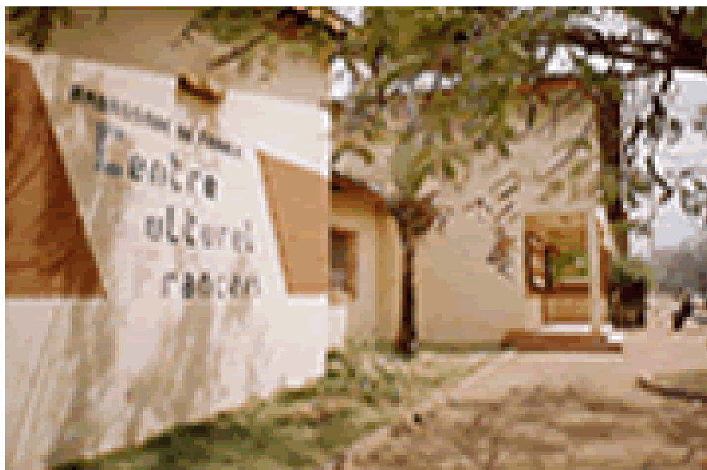
Aperçu du bâtiment du CCF de Parakou

Créé en 1992, le CCF de Parakou inscrit principalement son activité dans une politique de coopération active avec la communauté culturelle de la ville. Il est également un lieu privilégié pour conduire les créations, principalement dans le domaine du théâtre, de la danse et de l'art. Il est à noter que le CCF de Parakou ne dispose pas de bibliothèque intra muros. Toutefois il offre à son public des périodiques nationaux et étrangers et des revues (scientifiques et de loisir) qu'il reçoit du CCF de Cotonou.