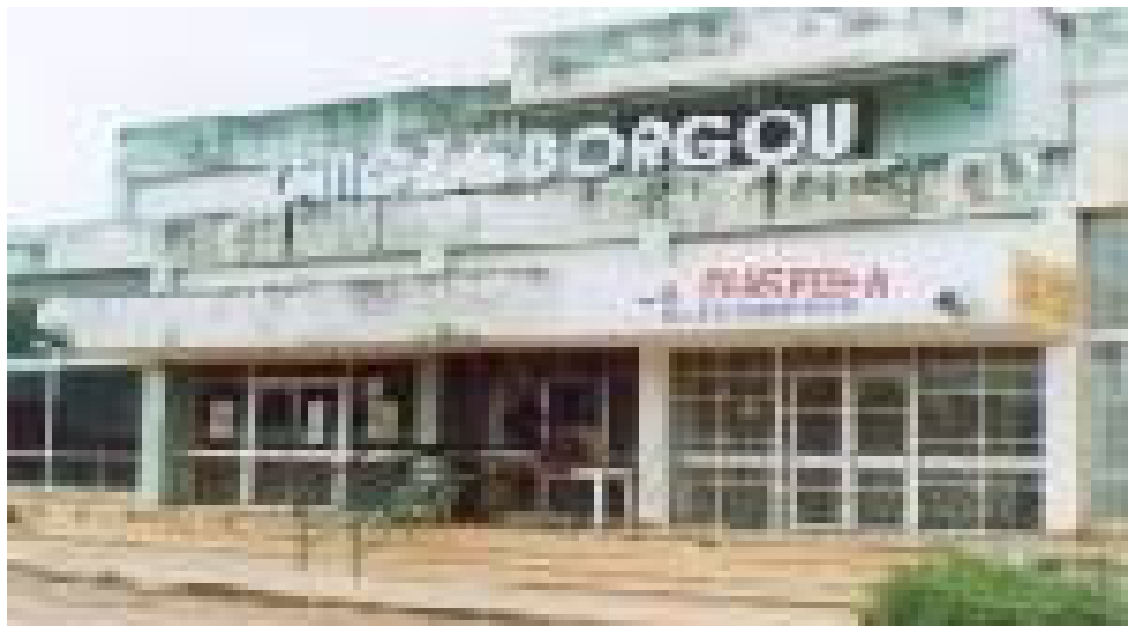
Bâtiment du Cinéma Le Borgou