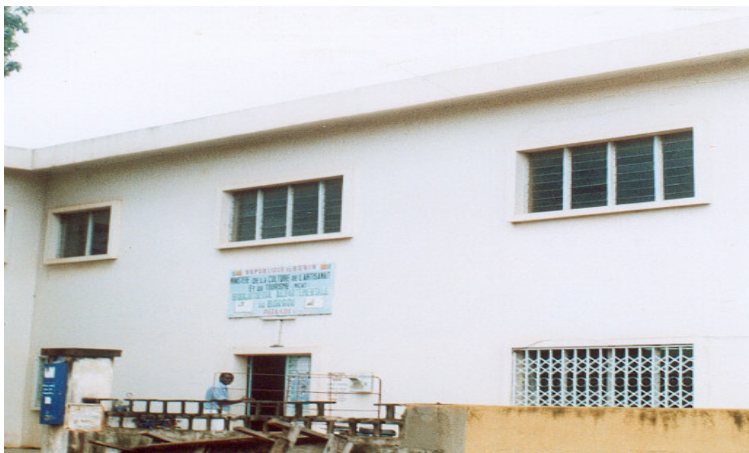
Bâtiment de la B.D vue de l'extérieur