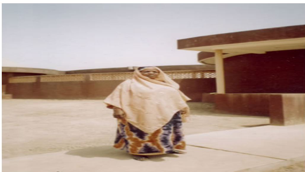
Aperçu du musée de Plein Air

Situé au quartier Sinan gourou, le domaine du musée couvre une superficie de cinquante (50) hectares. Il a été inauguré le 28 Juin 2004. Sont représentés dans ce musée, l'architecture et l'ethnographie locale. Il existe également dans ce musée un parc zoologique avec une marre aux crocodiles.