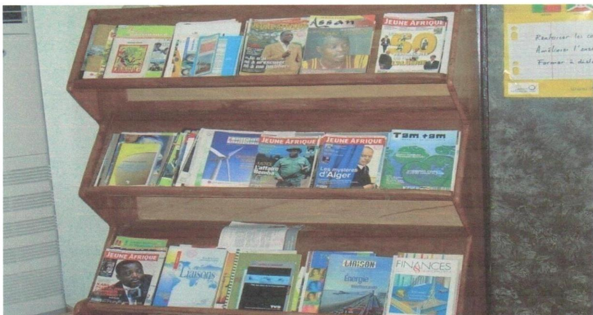
PHOTO 2 : Disposition de quelques périodiques sur un présentoir au CID