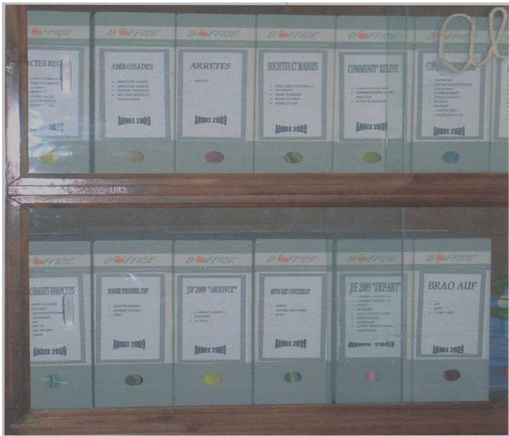
PHOTO 1 : Des documents administratifs bien conservés au secrétariat Général