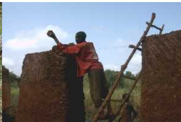
Figure 8 Un ouvrier posant des mottes de terre pour la