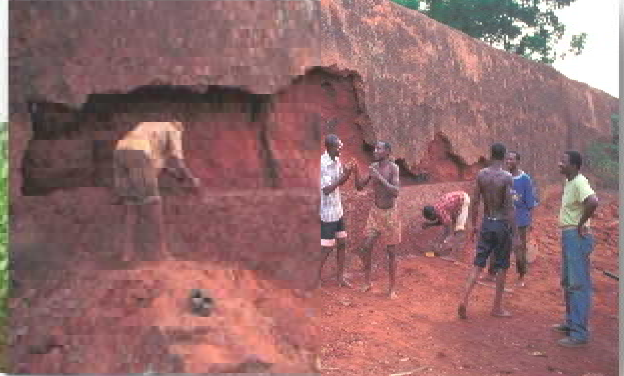
Figure 4 Un chantier de construction