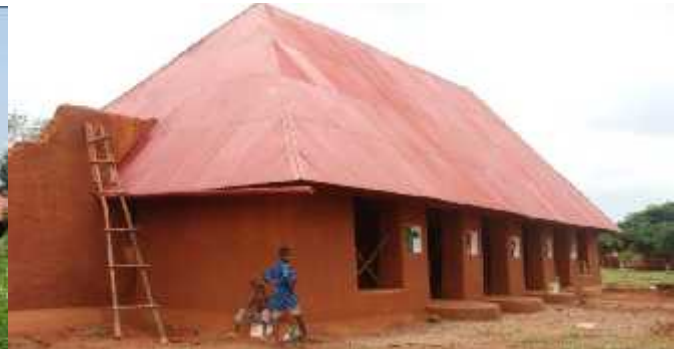
Figure 7 Le Honnuwa