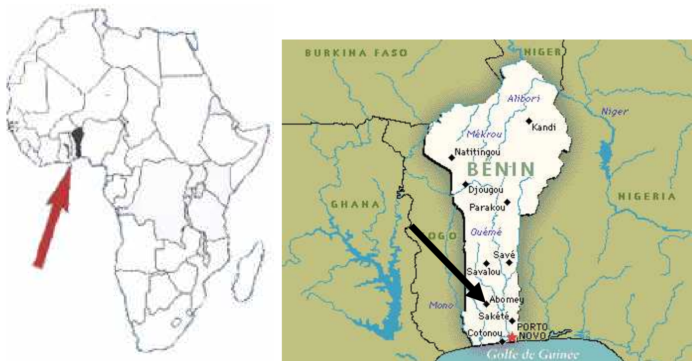
Figure 1 Localisation et carte administrative du Bénin

Ci-dessus, deux cartes dont l'une présente la position du Bénin en Afrique et l'autre indiquant Abomey sur la carte administrative du Bénin.