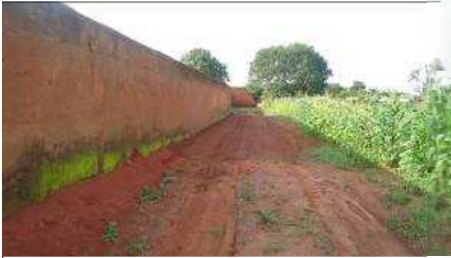
Figure 5 Pan de la clôture d'un palais

Les palais royaux d'Abomey sont de nos jours une architecture imposante constituée de bâtis et d'espaces que délimitent par endroits des murs de clôture et des murailles de hauteur impressionnante. L'occupation spatiale se traduit d'une façon générale au niveau de chaque palais par la présence de cours hiérarchisées et de différentes composantes (Honnuwa, Kpodoji, Logodo, Ajalalaxo, Dèxo et Adoxo) destinées à certaines pratiques et cérémonies royales.