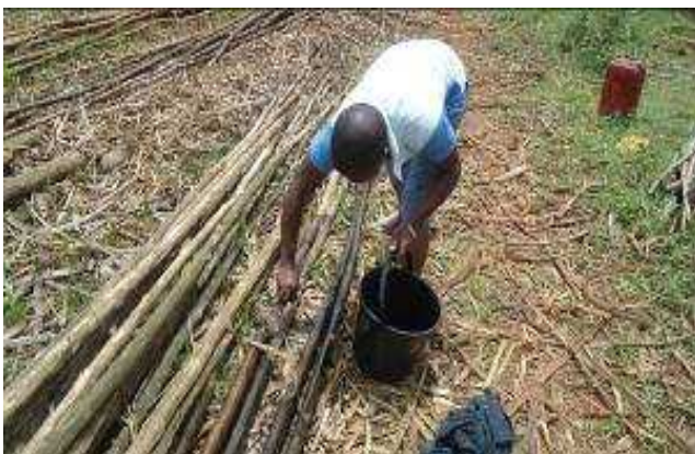
Figure 9 Un ouvrier préparant le bois de la charpente

Les familles royales sont les premières conservatrices de ce patrimoine et jouent un rôle important en ce qui concerne la vision et la philosophie de conservation et de sauvegarde du site classé qui est pour elles, un lieu de circulation constante et quotidienne et de culte. Les cycles cérémoniels dont la fréquence varie de quatre jours à plusieurs années renforcent l'intérêt attaché à leur conservation.