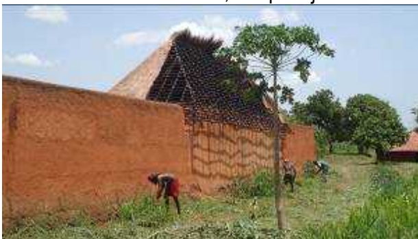
Figure 6 Un pan d'un mur en reconstruction

Les palais furent entourés d'un rempart ou plutôt d'une muraille assez élevée appelée "Axoxo ou Do atonmè" qui pouvait atteindre une hauteur de quatre (04) à six (06) mètres. Leur épaisseur évoluait entre 1,20m à la base et 50 cm au sommet. La muraille était frappée d'une seule entrée principale et unique, le Honnuwa ou Honga protégée par un auvent et qui donnait accès à la cour extérieure, la Kpodoji.