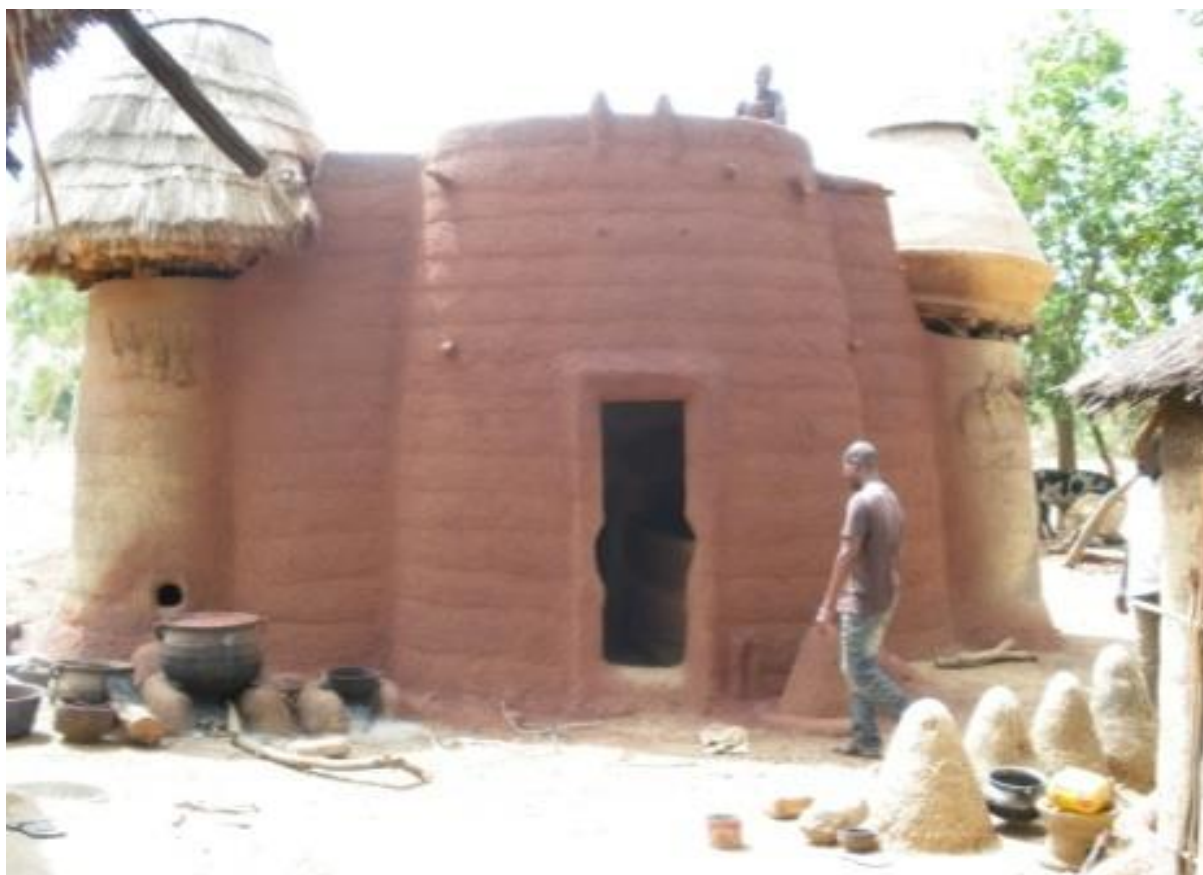
Figure 5: Tata Otchao

petites terrasses. Il faut également traverser la deuxième pour atteindre la plus grande terrasse. Le trou situé au niveau de la dalle permet d'évacuer la fumée de la cuisine et les odeurs des animaux. Ce n'est certainement pas le fait du hasard si certains l'appellent tata de Boukoubé ou encore tata Otammari.