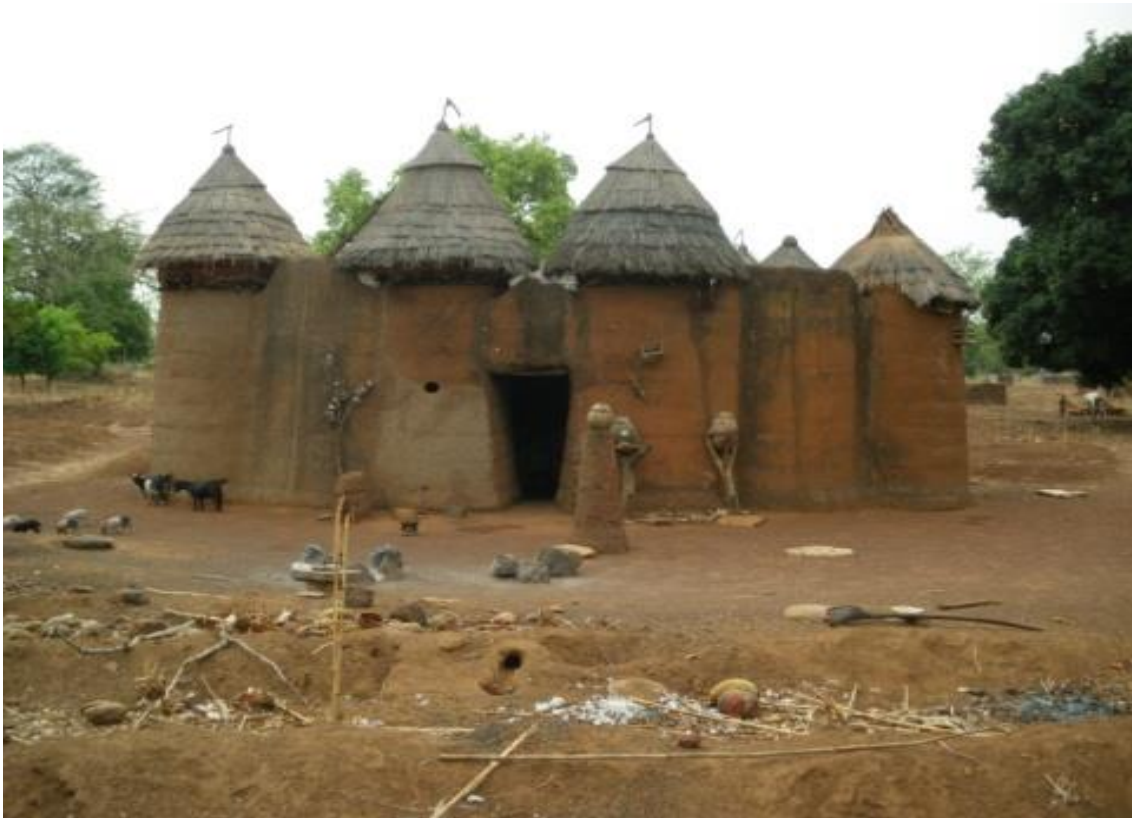
Figure 4: Tata Otammari

au nombre de deux. L'on y accède par une échelle fabriquée à partir d'un tronc d'arbre, formant un escalier et terminée par un "V" pour permettre à l'échelle de bien se poser sur le mur exactement comme un lance-pierre. Ce tata comprend trois terrasses et dispose, sur la partie supérieure du mur, d'orifices qui servent à décocher des flèches tout en étant à l'abri.