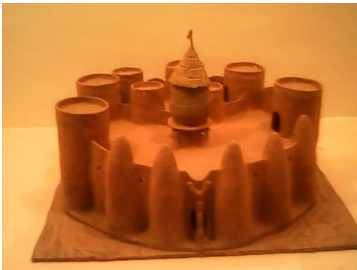
Figure 3 : Maquette d'un tata tayaba

communes de Cobly, Toucountouna et Kouandé. LetataNatemba est l'unique tata dont la structure est entièrement dallée, toit compris. Une échelle permet d'accéder de l'extérieur du rez-de-chaussée à l'étage. A l'origine, ce tata comprenait une première terrasse avec deux grandes chambres et une seconde avec six chambres. Un seul grenier pouvait être construit sur la terrasse ou tout simplement en dehors même du tata. Un passage arrière aménagé pour la guerre permet de descendre de l'étage au rez-de-chaussée et vice-versa.