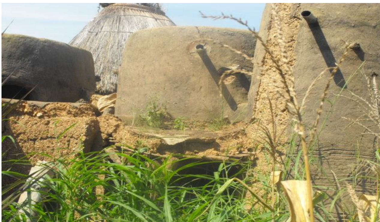
Figure 1 : Ruine d'un tata à Kouaba

C'est cette crainte de voir disparaître l'un des vestiges culturels exceptionnels dont nous sommes les héritiers et que le devoir citoyen nous impose de bien gérer qui nous a motivé à proposer ce projet professionnel en vue d'une solution conséquente quant à la sauvegarde, la préservation et la valorisation de cette architecture exceptionnelle et emboiter le pas au Gouvernement togolais qui a su très tôt prendre les mesures idoines nécessaires. La photo ci-dessous nous montre une ruine d'un tata à Kouaba dans la commune de Natitingou.