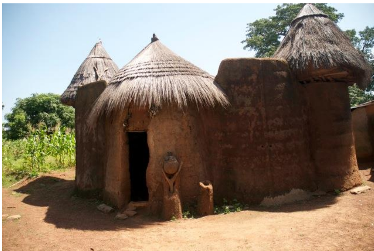
Figure 6: Tata Ossori

les Bètammaribè et les Waaba. Le tata Ossori comprend une grande terrasse par laquelle on accède avec une échelle. A l'étage, l'on distingue trois chambres et quatre greniers disposés sur le pourtour. Il ressemble à peu de choses près au tata Tamberma du Togo, classé patrimoine mondial de l'Unesco dans la région appelée Koutammakou (littéralement, «là où l'on façonne le sable»). Une appellation d'ailleurs usitée par les autres peuples de l'Atacora pour désigner l'ensemble du pays Otammari.