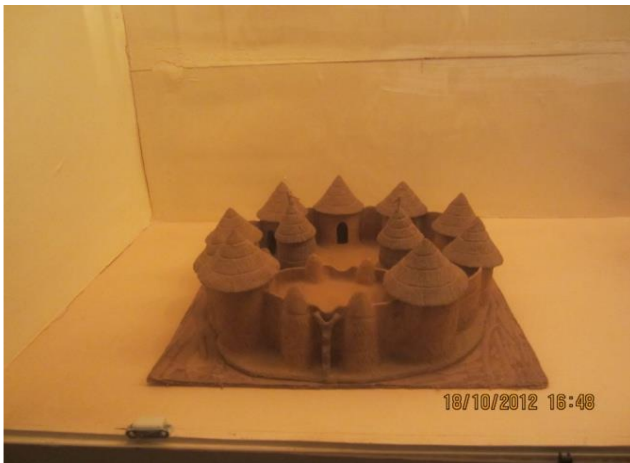
Figure 7 : Maquette d'un tata berba

autour de laquelle sont disposés neuf cases et deux greniers. Les deux plus grandes cases sont situées au niveau de l'échelle et reliées par un mur.