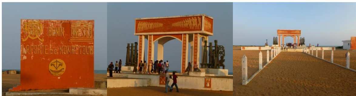
Figure 6: la porte du non-retour (photos prises le 08 Octobre 2013 à Ouidah)

Le site de l'embarcadère de Djègbadji est matérialisé par la Porte du non-retour, monument commémoratif. Construite en 1994-1995 avec le concours de l'UNESCO, la Porte de non-retour est aussi un symbole du devoir de mémoire. Il rappelle l'ultime départ de ces hommes vers l'inconnu.