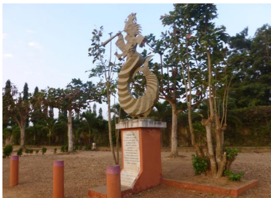
Figure 2: Sirène représentant l'arbre de l'oubli (photo prise le 08 Octobre 2013 à Ouidah)

Le site de l'Arbre de l'oubli est la seconde station après celle de la place aux enchères. Il est situé à l'est par la clôture de l'Institut Régional de Santé Publique (IRSP) de Ouidah et à l'ouest par la Route de l'esclave qui va vers l'embarcadère de Djègbadji. Il représente un arbre retrouvé mort en 1978. Il s'agirait du fromager Ceiba pentandra ou du Cola gignatea , planté par le roi Agadja lors de la conquête du royaume de Savi au XVII e siècle. C'était un arbre fétiche sous lequel s'effectuaient des cultes religieux et où se manifestaient beaucoup de forces occultes. Les esclaves achetés et marqués en vue d'une identification aisée par l'acheteur, sont conduits vers la place Zomaï en passant cet arbre de l'oubli. Encore appelé « madja » (je ne reviens plus), les femmes en faisaient le tour 7 fois et les hommes 9 fois (en rapport avec les croyances religieuses rattachées au nombre de côtes dont est doté une femelle ou un mâle). Ces tours étaient destinés à amener les esclaves à oublier leur passé, leur culture, leur origine. La statue érigée à cette place représente une sirène ; elle est la déesse des eaux et symbolise le départ pour une destination inconnue et finale.