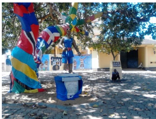
Figure 1: Statue de la Place aux enchères (photo prise le 08 Octobre 2013 à Ouidah)

La place aux enchères constitue le premier point de départ de la Route de l'esclave à Ouidah. Le site est limité au nord par l'îlot de la collectivité familiale de SOUZA et au sud par le départ de la voie vers l'embarcadère de Djègbadji. La Place aux enchères tient sa notoriété de la vente des esclaves. Au XIX e siècle, elle se tenait devant la concession de Félic Chacha de SOUZA, vice-roi de Ghézo. C'est donc sur cette place que les esclaves étaient mis aux enchères. On peut situer l'érection de ce point de vente à une période située après 1818, année de l'accession de Ghézo sur le trône du Danxomè. C'est également à proximité de ladite place que l'esclave acheté était marqué au fer chaud afin que le propriétaire puisse reconnaître sa « marchandise » à l'arrivée dans les Amériques. De la place aux enchères, les esclaves étaient dirigés vers un arbre dénommé l'arbre de l'oubli pour un dernier rituel.