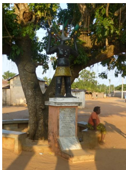
Figure 5: Arbre du retour (photos prises le 08 Octobre 2013 à Ouidah)

L'Arbre de retour a une valeur culturelle et psychologique. Le rituel qu'elle effectue, autour de l'arbre de retour, l'esclave en partance pour les Amériques est le signe de la croyance des populations africaines