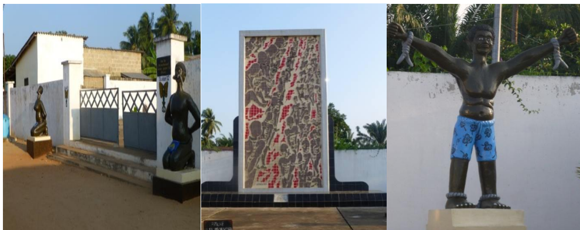
Figure 4: Mémorial de Zungbodji (photos prises le 08 Octobre 2013 à Ouidah)

Le mémorial de Zungbodji est un lieu de silence et de recueillement au souvenir des esclaves déportés.