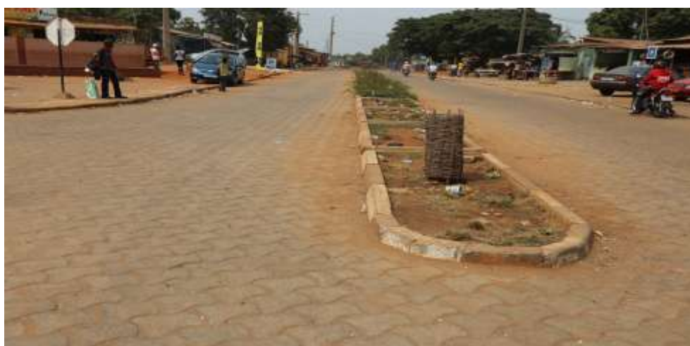
Planche 3 : Rue pavée Carrefour Yésouvito-Eglise Saint Michel,