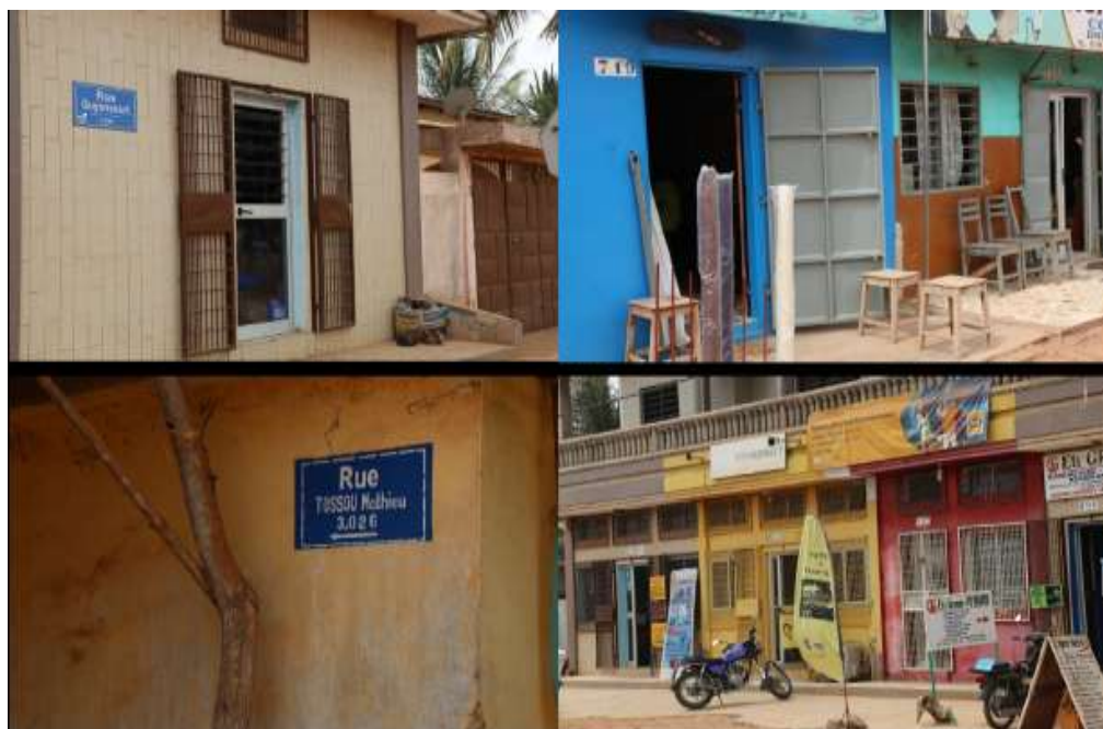
Planche 4 : L'adressage des rues, fruit de la coopération Comé-Goyancourt, Prise de vue : Afangbédji, Août 2018

internationale, l'appui au développement des politiques publiques de Comè en direction de la jeunesse, l'appui technique et échanges entre les cadres et les élus de Comè et Guyancourt, l'organisation de séjours de séjours interculturels franco-béninois.