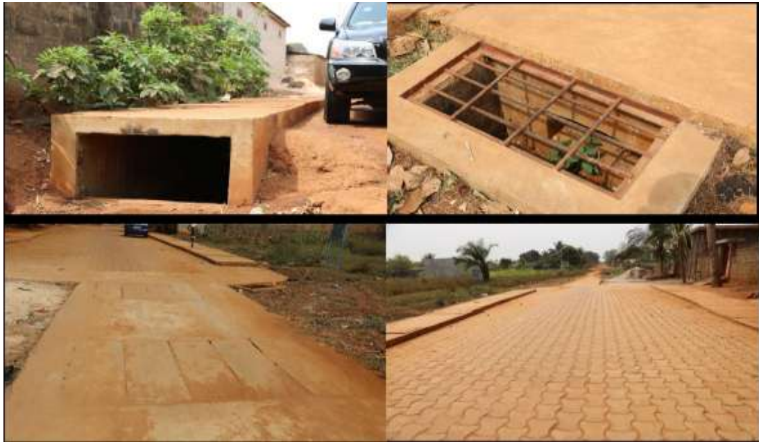
Planche 2 : Quelques facettes du collecteur de Téhoungué-codji

la construction du marché central de Comé (dont la phase active est en cours).