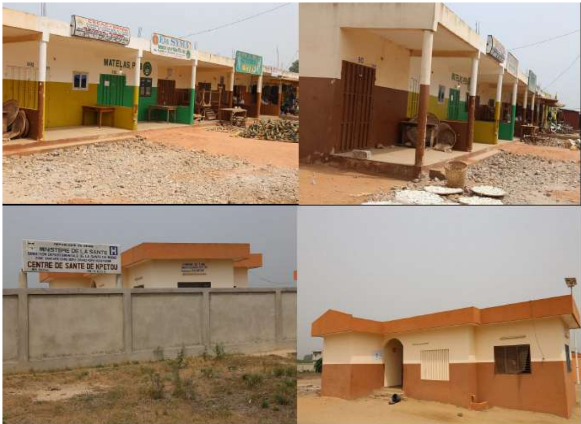
Planche 1 : Boutiques dans le marché et Comé et Centre de Santé de Kpétou

A travers le FADeC, la commune de Comé a bénéficié de financement ayant permis de réaliser certaines infrastructures et d'appuyer les services sociaux de base. La plus significative reste l'hôtel de ville dont la construction a coûté 125 564 588 F CFA. On met également à l'actif du FADeC, des réalisations telles que la construction de la maternité isolée de Kpétou dans l'arrondissement de Agatogbo, la construction de cinq boutiques dans le marché central de Comè, les travaux de réfection dans les EPP Comè quartier A et B, Gadamè C, Honvè Comè et EM Honvè Comè, la construction d'un module de trois classes bureau magasin à l'EPP Bowégbédji B dans l'arrondissement de Akodéha, les travaux de réalisation de la clôture des bureaux des arrondissements de Akodéha et Ouèdèmè-Pédah, la construction de cinquante cabines de latrines dans toute la commune.