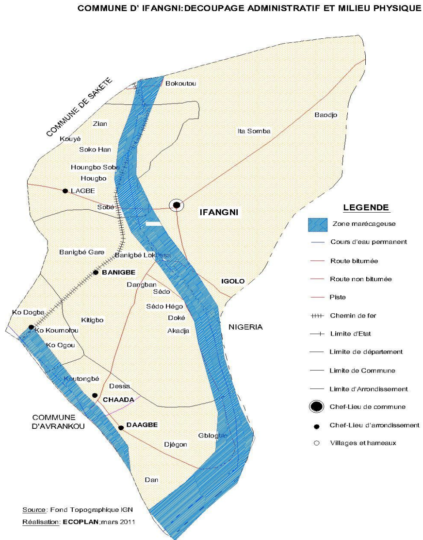
Schéma 1: Carte administrative de la commune d'Ifangni