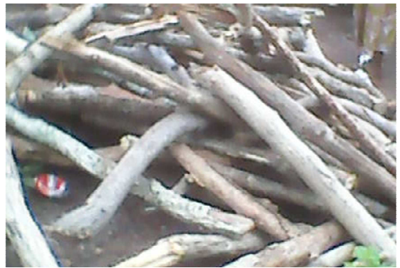
Photo IX : Fagots de bois de Dakikpokanmin réservés pour les rites d'axijêkpé