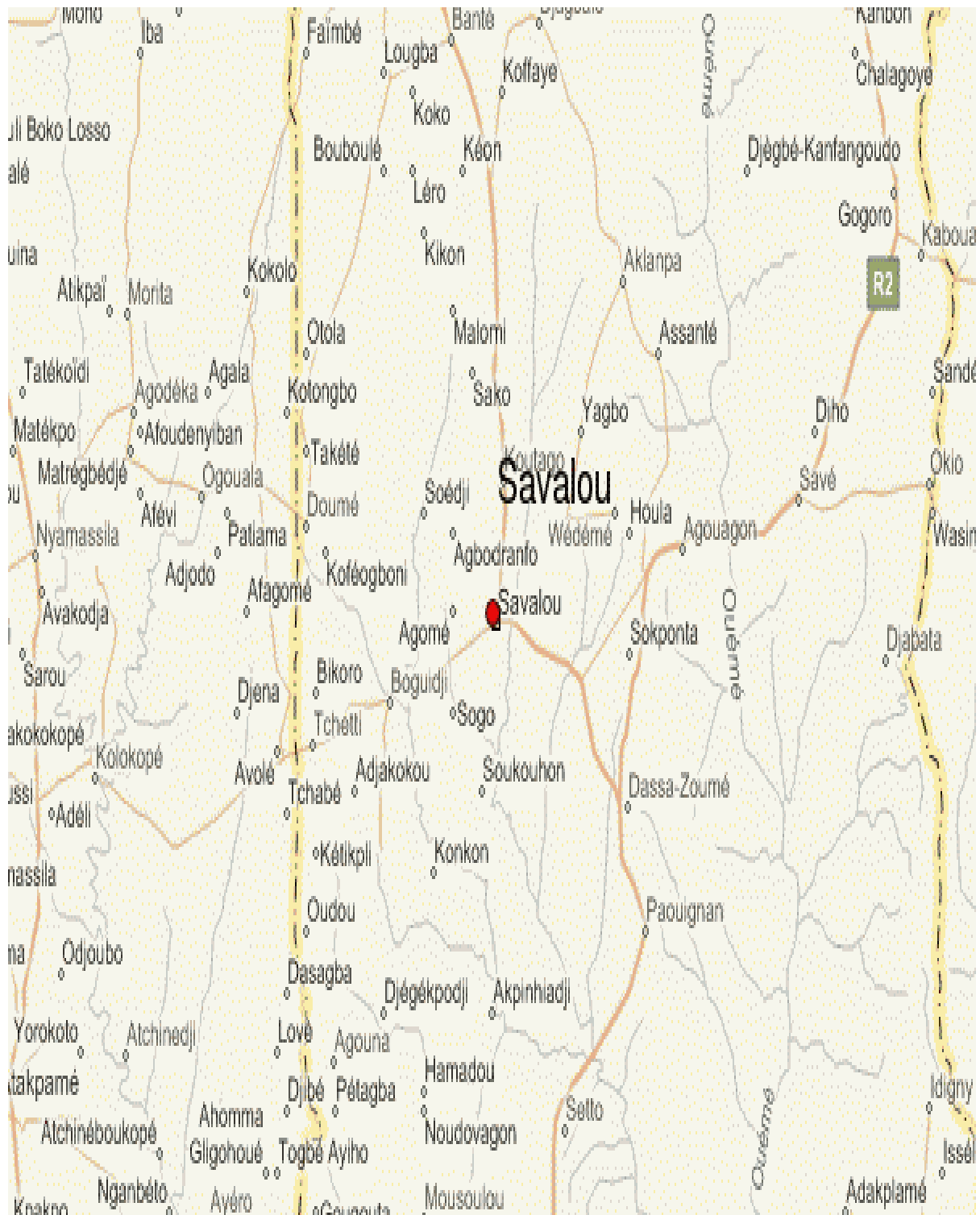
FIGURE : 2 : Carte situant la commune de Savalou