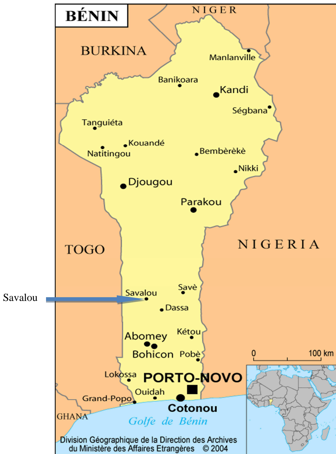
FIGURE : 1 : Carte du Bénin situant la commune de SAVALOU