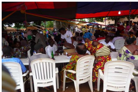
PHOTO X : Réception des invités venus pour l'anniversaire d'un défunt

C'est ce qu'illustrent les présentes photos intitulées :