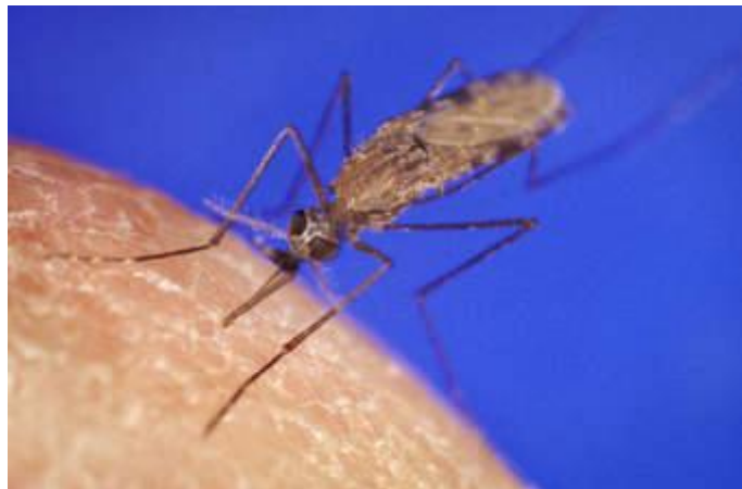
Figure 8 : Photographie montrant l' Anopheles gambiae

An.gambiae (figure7) est connu comme un complexe d'espèces et comprend sept espèces jumelles qui sont : An. gambiae s.s Gilles, 1902, An.merus Doenitz, 1902, An.melas Théobald, 1903, An. arabiensis Patton, 1905, An.bawambae White, 1985, An.quadriannulatus Théobald, 1911.