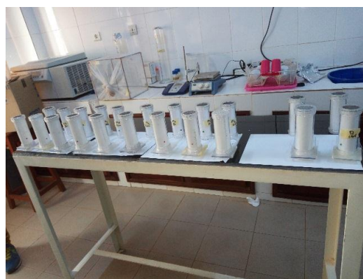
Figure 3 : Photographie montrant des tubes OMS