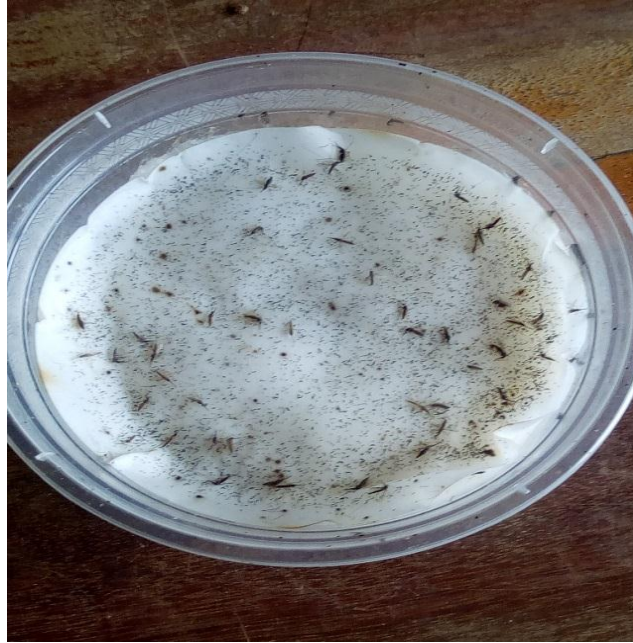
Figure 1 : Photographie montrant un pondoir Source : Rolande Assogba, 2018