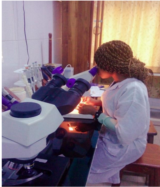
Figure 6: Photographie montrant la dissection de l'ovaire à la loupe

accompagnant l'ovaire sont nettoyées, puis son réseau trachéolaire est observé au microscope.