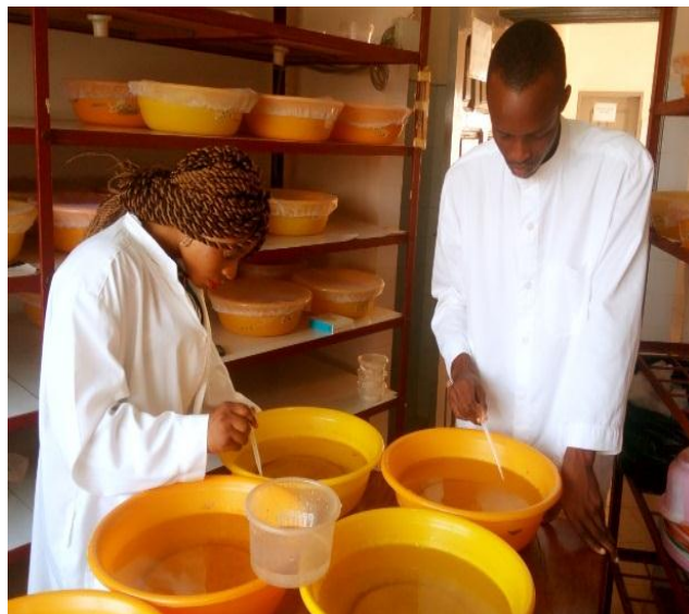
Figure 2 : Photographie montrant le tri de nymphes Source : Rolande Assogba, 2018