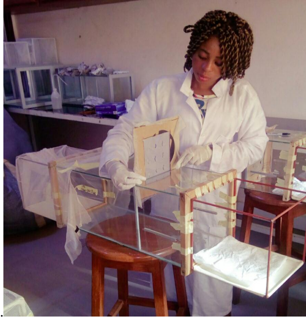
Figure 5 : Photographie montrant la préparation du test en tunnel