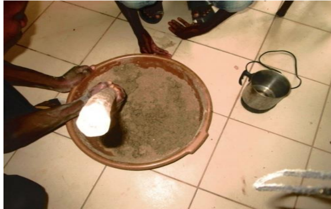
Figure 4 : Mélange des ingrédients