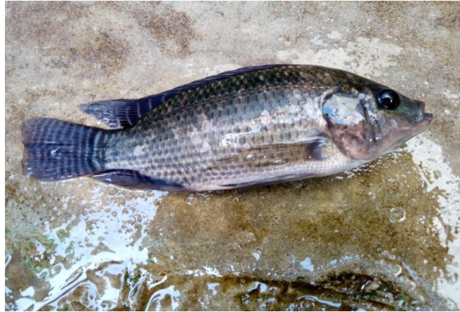
Figure1: Oreochromis niloticus