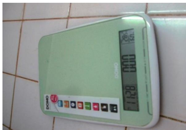
Figure 6: Photo de la balance

Le nourrissage se fait manuellement à satiété apparente est distribué trois (3) fois par jour à 9h00, 13h00 et 17h00. Les pêches de contrôle se font toutes les deux semaines. Elle consiste au nettoyage des bassins, à la prise de la biomasse. Une balance électronique (DOMO) est utilisée pour peser la biomasse et les aliments. Elle est représentée par la figure6.