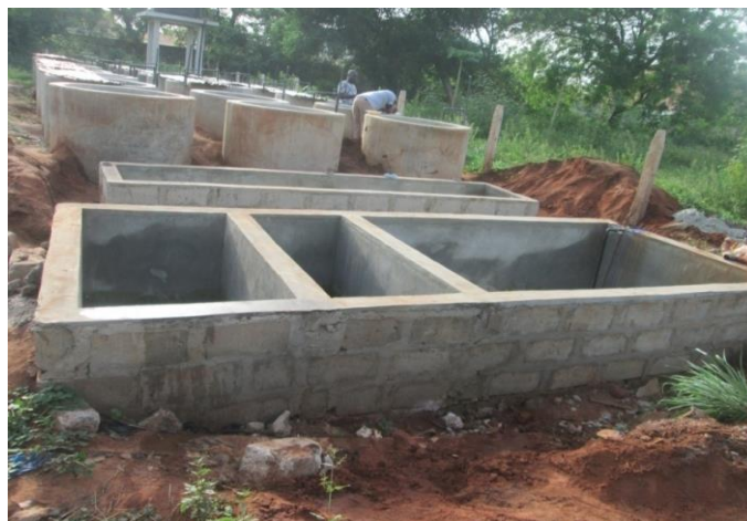
Figure 3 : Dispositif expérimental

Le dispositif expérimental est constitué de neuf bassins circulaires en béton de 1, 2 mètre de diamètre avec une hauteur de 1 mètre. Chaque bassin a été recouvert d'une claie afin d'empêcher la pénétration des rayons solaire dans l'eau et d'éviter des grandes variations de température. Les alevins sont repartis dans ces bassins à une densité de 50 poissons par m 3 . Le volume d'eau utile est de 1m 3 par bassin avec un taux de renouvellement de 3L/ minute environ. L'ensemble du dispositif expérimental est illustré par la figure 3.