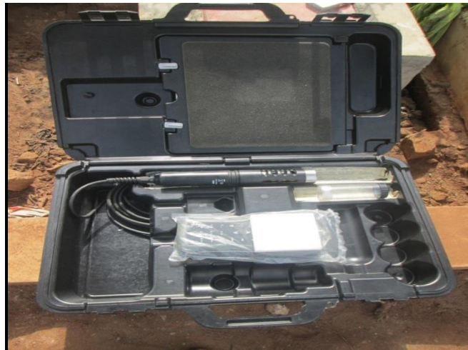
Figure 7 : Photo du multi-paramètre HANNA 9829

Les paramètres physico-chimiques sont mesurés trois fois par semaine à l'aide du multi-paramètre HANNA 9829. Cet appareil permet de prendre in situ à 10 cm de profondeur les paramètres tels que le pH, l'oxygène dissous (ppm), le taux de saturation (%), la conductivité ( \mu\text{s}/\text{cm}^2 ), Solides Totaux Dissous (ppm), la salinité (psu), la température ( ^{\circ}\text{C} ). La photo du multi-paramètre est illustrée par la figure 7.