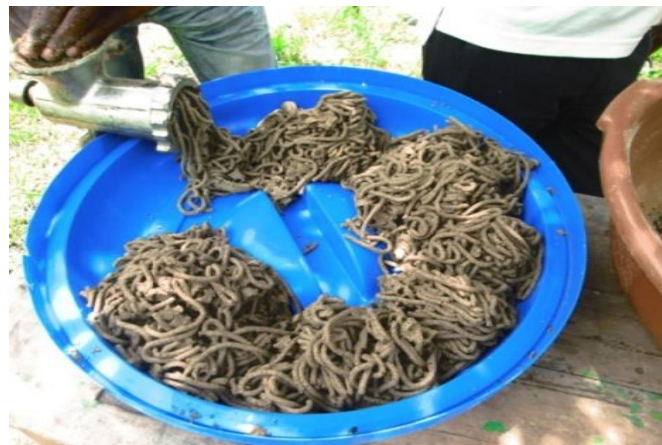
Figure 5 : Granulation