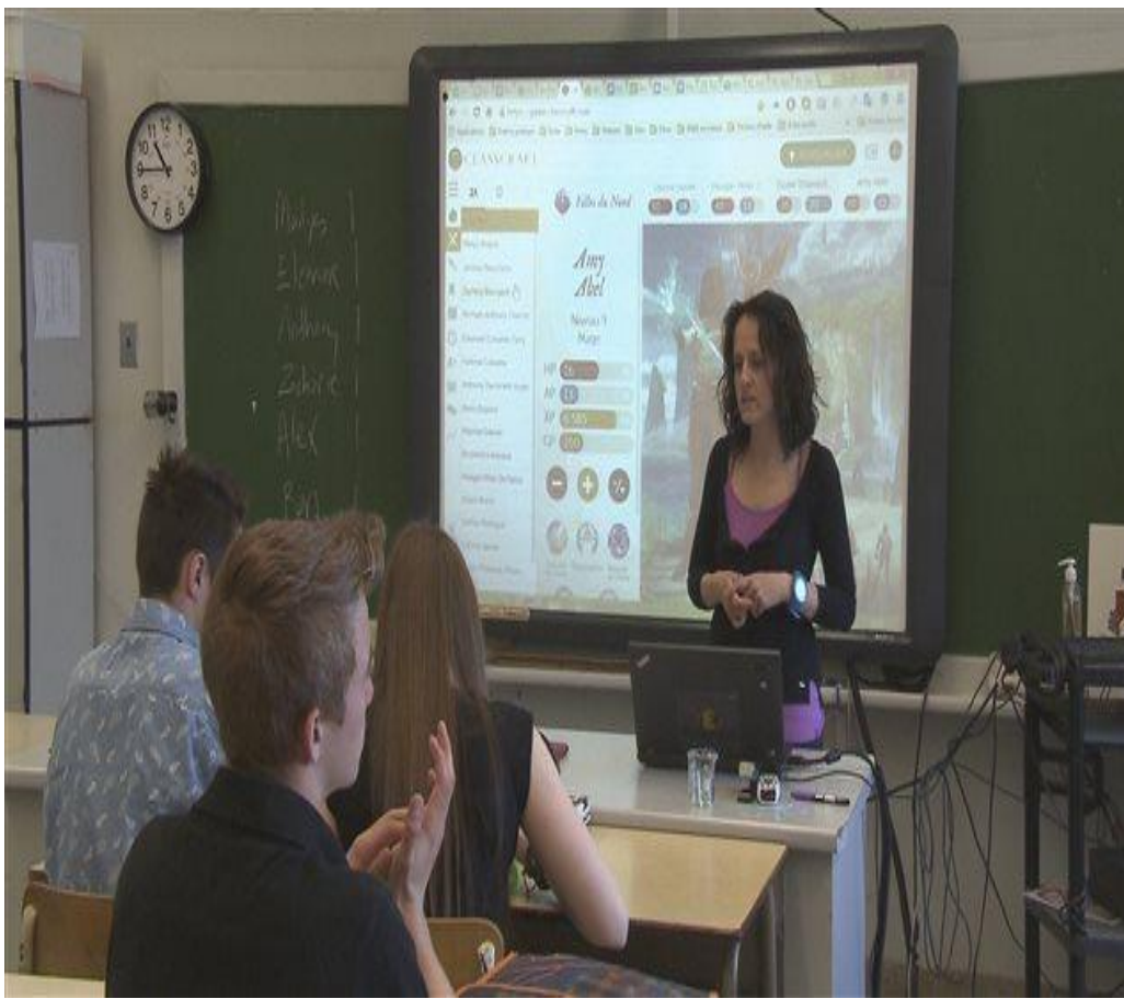
Figur 4: Das Video im Deutschunterricht