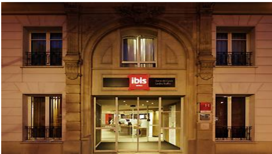
Figur n°3 Hotel Ibis

WIR“ Band 1 gab es eine afrikanische Speise, die „Fufu“ genannt ist. Aber heute gibt es das in Lehrbüchern „IHR und WIR plus“ insbesondere in Band 3 nicht. Was die Hotellerie angeht, spricht man darüber überhaupt nicht. Also wozu dienen diese Curricula, die die beninische Kultur zu dieser Zeit der Globalisierung nicht valorisieren? Die folgenden Figuren stellen solche Elemente der Hotellerie und Gaststättengewerbe dar: