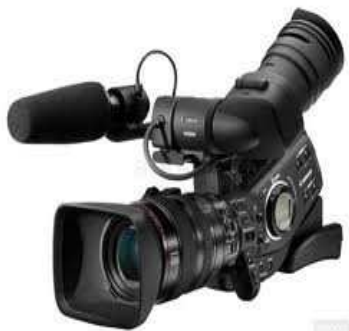
Imagen5: La camara