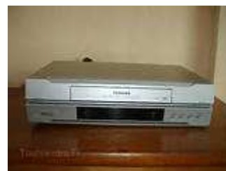
Imagen6: El Magnetofono