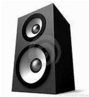
Imágen13: El Altavoz