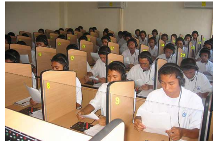
Imágen14: El Laboratorio de idiomas