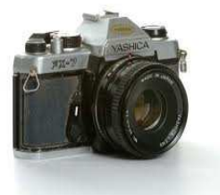
imagen4: El Aparato fotográfico