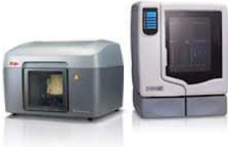
Imágen9: La Impresora