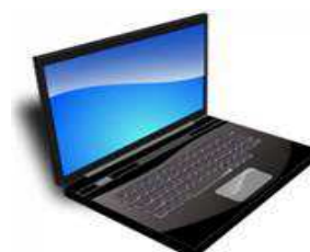
Imagen8: El Ordenador