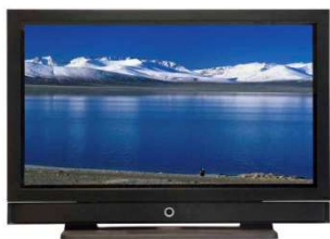
Imagen3: La Televisión