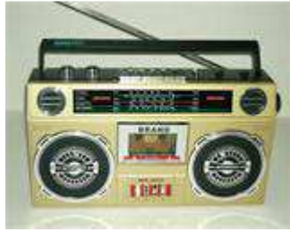
Imágen11: La Radio