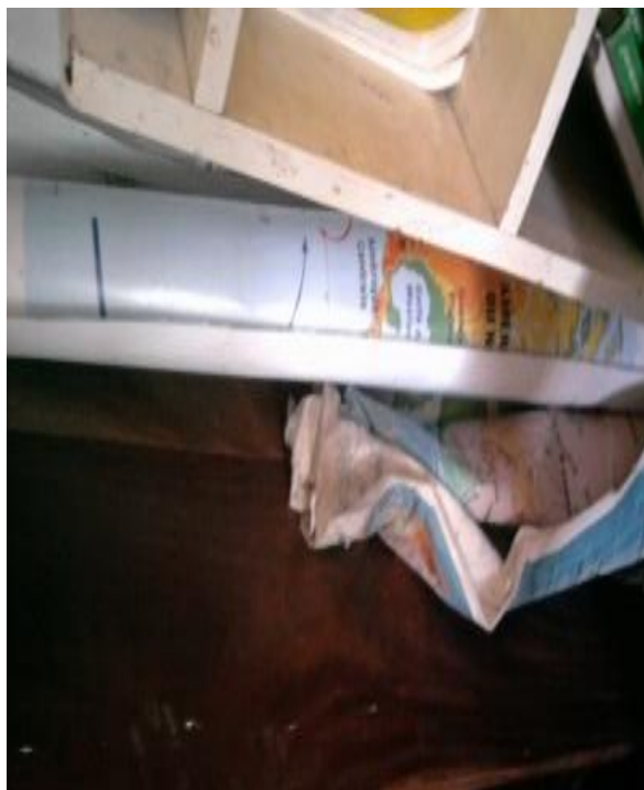
Photo 1 : Quelques cartes déposées au sol dans la bibliothèque du CEG.

Le CEG Akpassa dispose de 02 globes terrestres dont un (01) lumineux et des cartes. Il s'agit notamment de trois (03) planisphères, six (06) cartes de l'Afrique, (Etats et relief) et cinq (05) cartes du BENIN (administrative et physique).