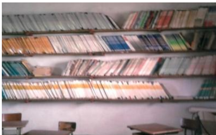
Photo 3 : Quelques documents d'accompagnement de la DIP dont dispose le collège