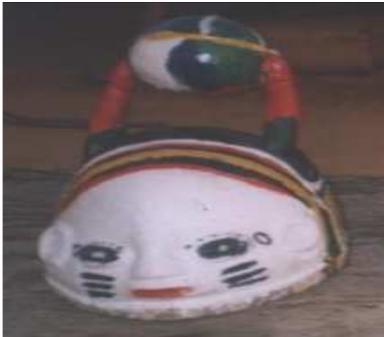
Photo n° VIII : le cimier Tetede dans la période de 1957 – 1968 à Toui

signe des nouvelles adeptes des divinités dans la période précédant le christianisme et l'islam.