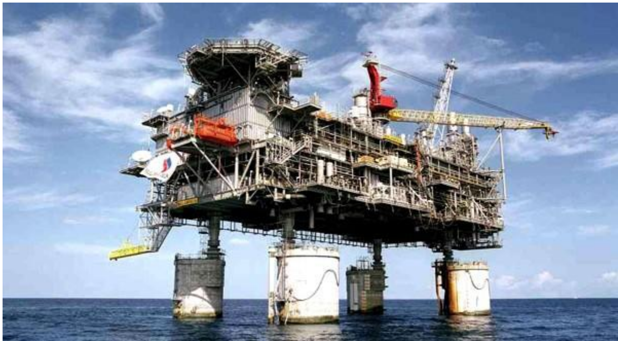
Plate-forme pétrolière au Nigeria : l'essentiel des réserves nigérianes se trouve dans des gisements offshore.

Le pétrole a été découvert au Nigeria en 1956 et son exploitation débuta deux ans plus tard, soit en 1958.