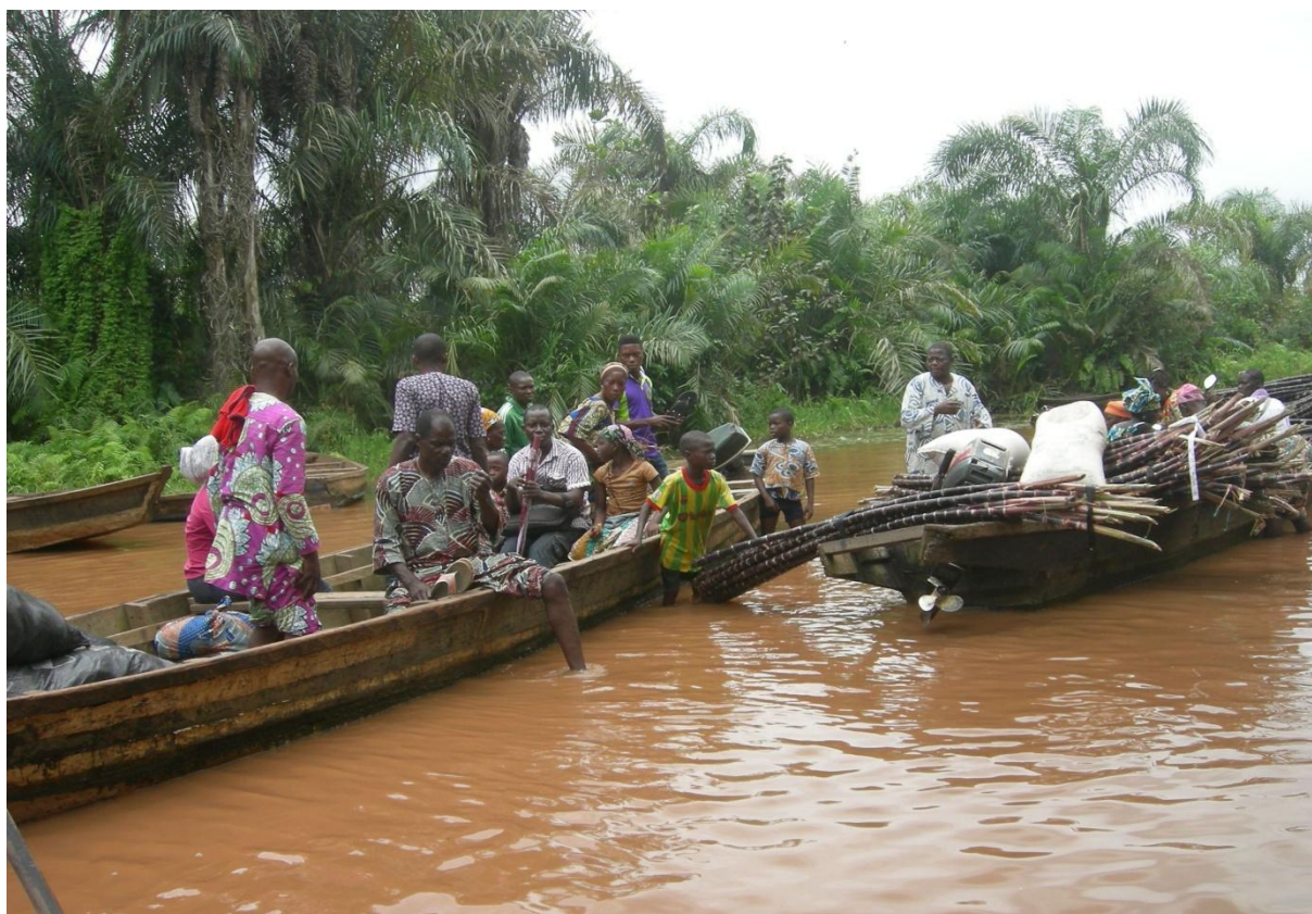
Photo n°1 : Rivière de Médédjonou, voie naturelle de circulation de personnes et de biens entre le Bénin et le Nigeria (TAHO S.A. le 26 avril 2014).

Le partenariat économique bénino- nigérian a abouti entre 1970 et 1979 à des investissements directs nigériens en faveur du développement économique et social du Bénin. Ces investissements concernaient principalement des projets routiers. On se rappelle que le Bénin partage à l'Est environ 871km de frontière avec le Nigeria et ce, du Nord au Sud. Cette frontière peut se diviser en deux parties dont la première, considérée comme artificielle est simplement matérialisée par des bornes et l'autre dite naturelle est marquée par des cours et plans d'eau. Dans la partie méridionale du Bénin, un complexe fluvio-lagunaire sert en même temps de frontière et de voie de communication entre les deux pays, favorisant ainsi la circulation des personnes et des biens.