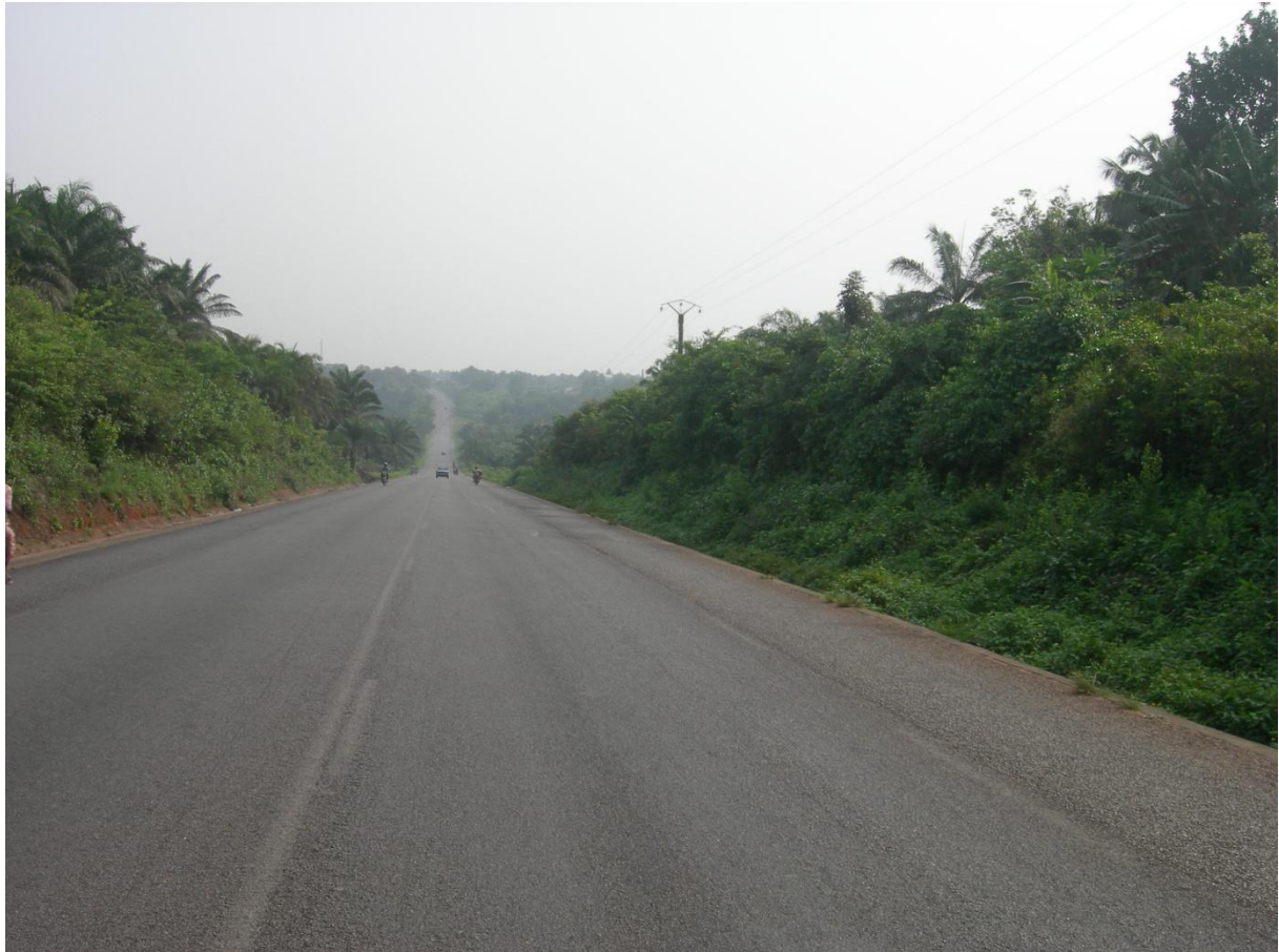
Photo n°2 : Route Idiroko (Nigeria )-Porto-Novo (Bénin) reconstruite en 2002-2003 (TAHO S.A. le 26 février 2014).

Par ailleurs, selon un de nos informateurs, le Nigeria aurait réalisé au profit des deux Etats partenaires, le bitumage de la route Onigbolo-Pobè (Bénin)- Ilaro (Nigeria) entre 1978 et 1979. Mais si l'information paraît vraie, l'année de réalisation de l'infrastructure est moins sûre et aucune autre source ne la confirme ni l'infirme. Les mêmes incertitudes entourent le bitumage de l'axe carrefour Izian- Igolo dans l'actuelle commune d'Ifangni distant de 12,094 km et qui relie la route Idiroko-Porto Novo et Porto-Novo-Pobè-Ilaro. Cette bretelle (Izian-Igolo) qui aurait été bitumée selon un de nos informateurs entre 1973 et 1974 est aujourd'hui devenue une voie en terre parce que rasée au début des années 80 suite à sa dégradation très avancée.