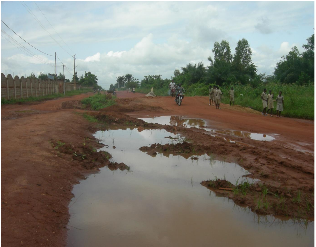
Photo n°4: Etat de la bretelle Izian-Igolo aujourd'hui à hauteur de la mairie d'Ifangni (TAHO S.A. le 19 juin 2014).