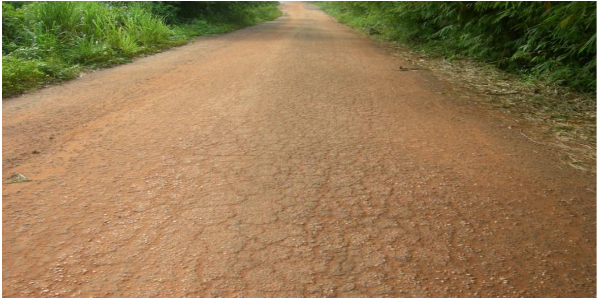
Photo n°3: Ce qui reste du bitume de la route Izian-Igolo des années 1970 et qui a échappé aux dents des bulldozers. Ici nous sommes dans la dépression de Ilagbè (TAHO S.A. le 19 juin 2014).