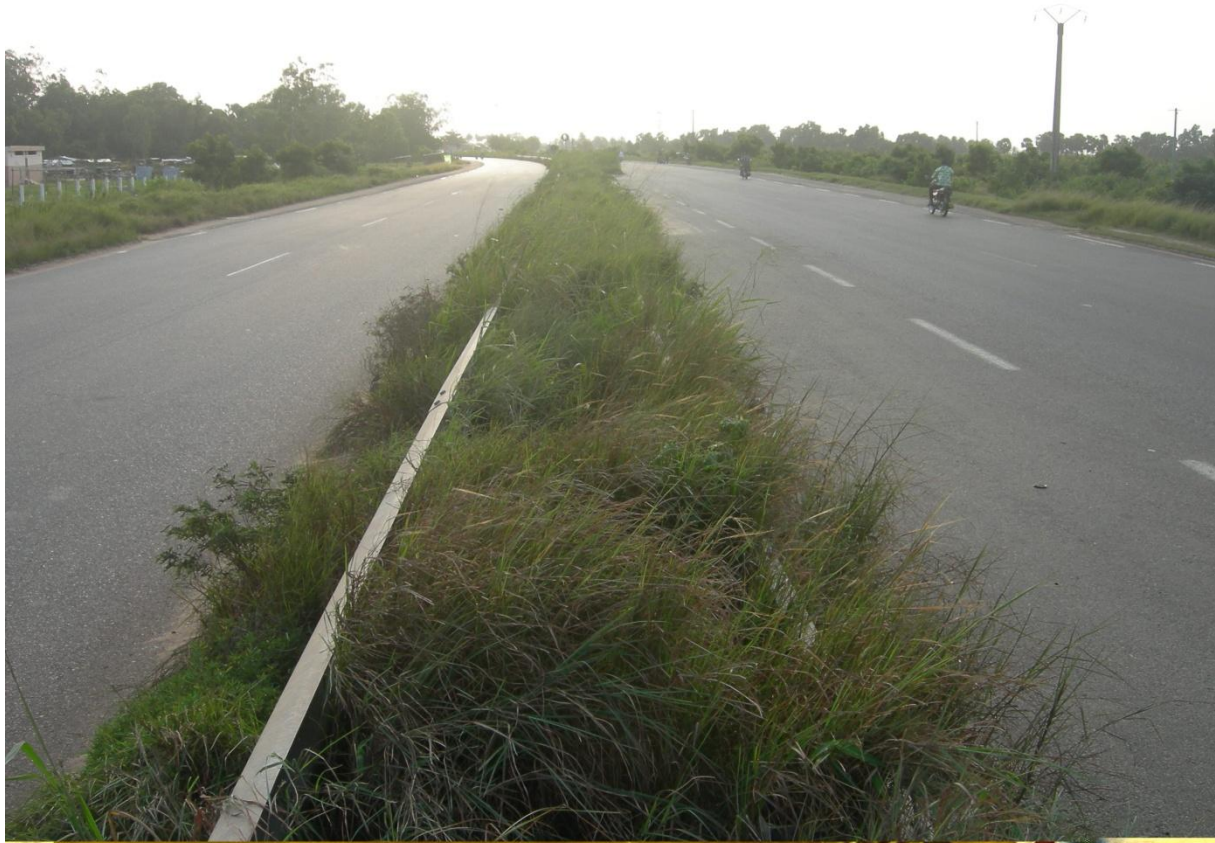
Photo n°5 : Autoroute Lagos (Nigeria) – Sèmè (Bénin) via Badagry. (TAHO S.A. le 19 juin 2014).

En 1978 -1979, le Nigeria a prolongé jusqu'au carrefour Sèmè au Bénin sur une distance d'environ 11 km, l'autoroute Lagos-Badagry. Selon l'ancien ministre d'Etat béninois Bruno AMOUSSOU, cette voie aurait pu être prolongée jusqu'au port de Cotonou, sur une distance de 25 km environ si un autre ministre béninois d'alors n'avait pas, par orgueil et par chauvinisme, rejeté adroitement l'offre nigériane 1 .