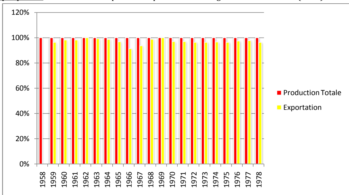
Graphique n°1 : Evolution des exportations pétrolières du Nigeria de 1958 à 1978 (en %)

Source : Graphique réalisé à partir des données du tableau n°1 ci-avant.