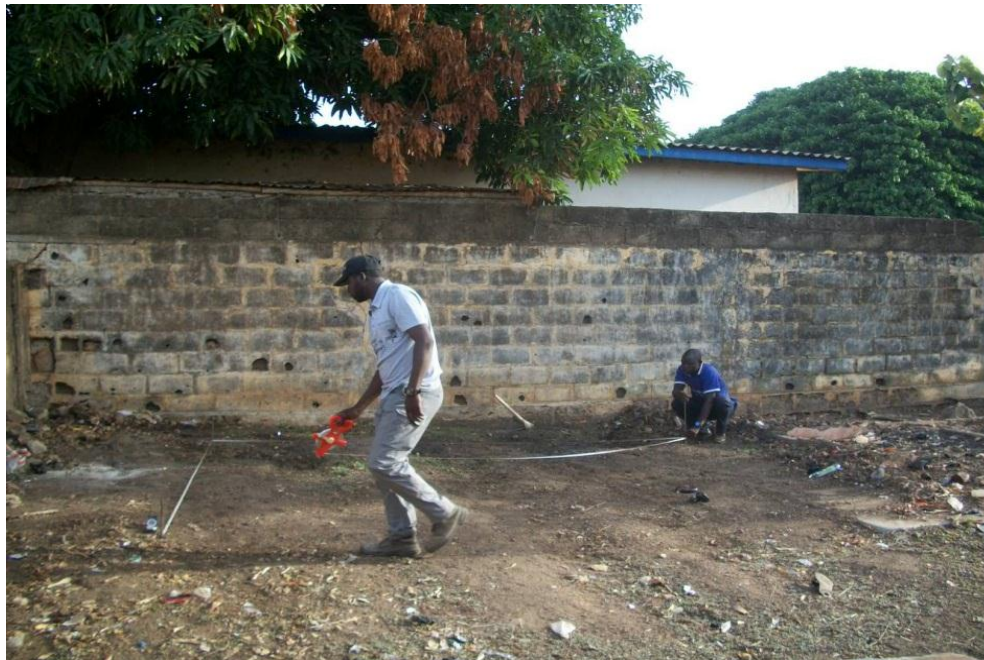
Photo 2 : Installation du sondage