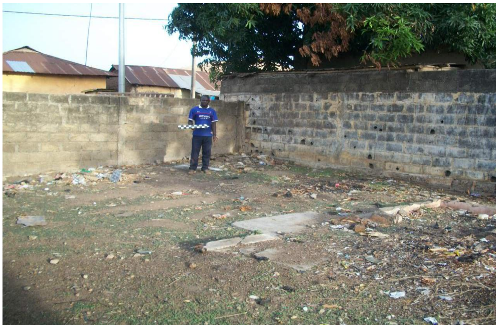
Photo 1 : Vue d'ensemble du site ( 9^{\circ} 42' 24.5'' N ; 1^{\circ} 39' 50.9'' E)