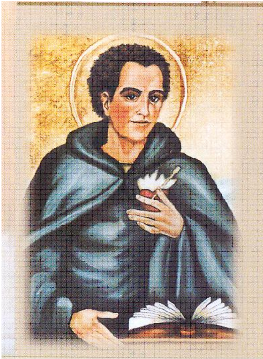
Fig.3 : Image représentative de Saint Augustin