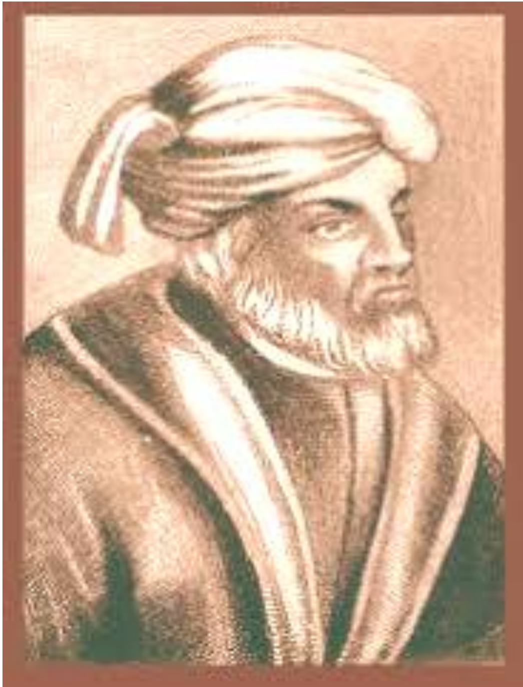
Fig. 2 Image représentative de Tertullien.