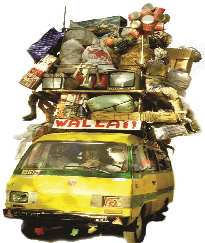
Illustration N°7 : « Taxis-ZINKPE (Wallai) »

Matériaux : Carcasse de véhicules Peugeot, matériaux de récupération, appareils électro-ménagers, tissus, peintures, pigments