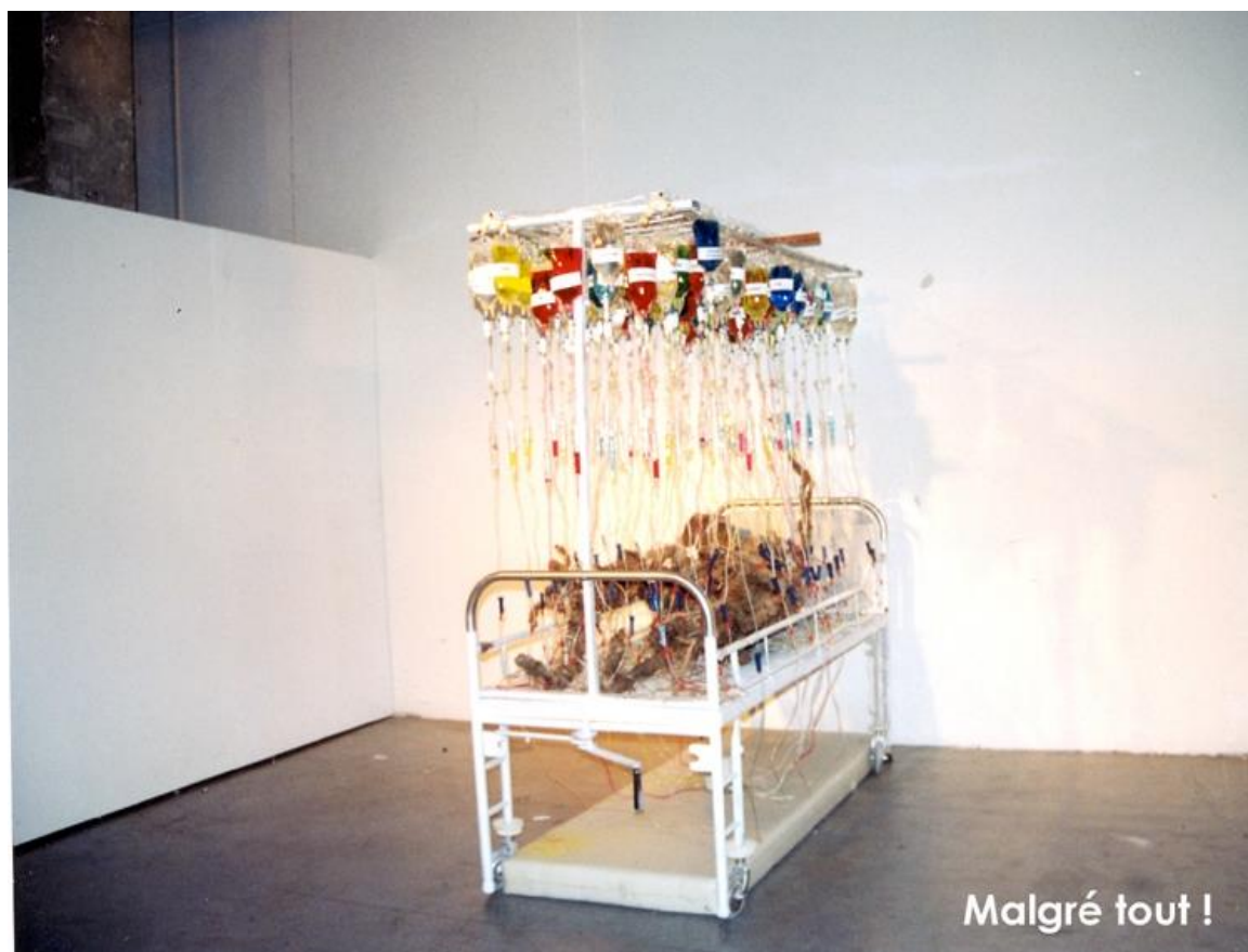
Illustration N°9 : « Malgré tout »

Matériaux : Lit d'hôpital, perfuseurs, tissus, bouteilles, colorants, eau, fer.