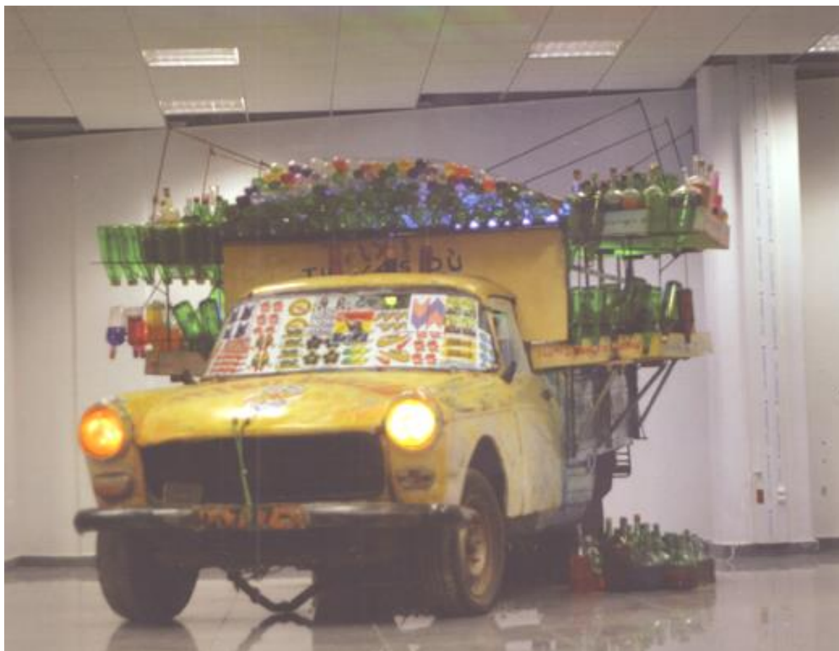
Illustration N°8 : « Installation kpayo »

Matériaux : Véhicule 404 bâché usagé, bois, autocollants, bouteilles, matériaux de récupération, eau, colorants