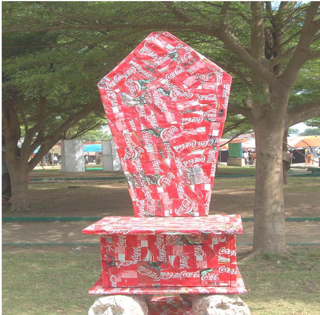
Illustration N°10 : “ The King of the world”

Matériaux : boîtes de coca cola, bois, argile, clous, colle