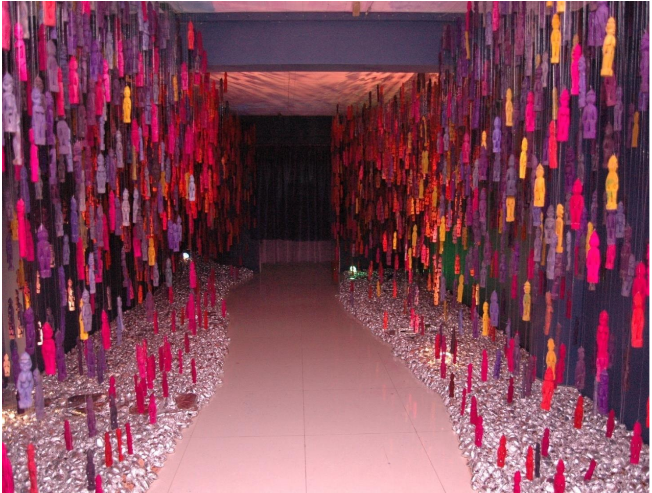
Illustration N°5 : « Omniprésence »