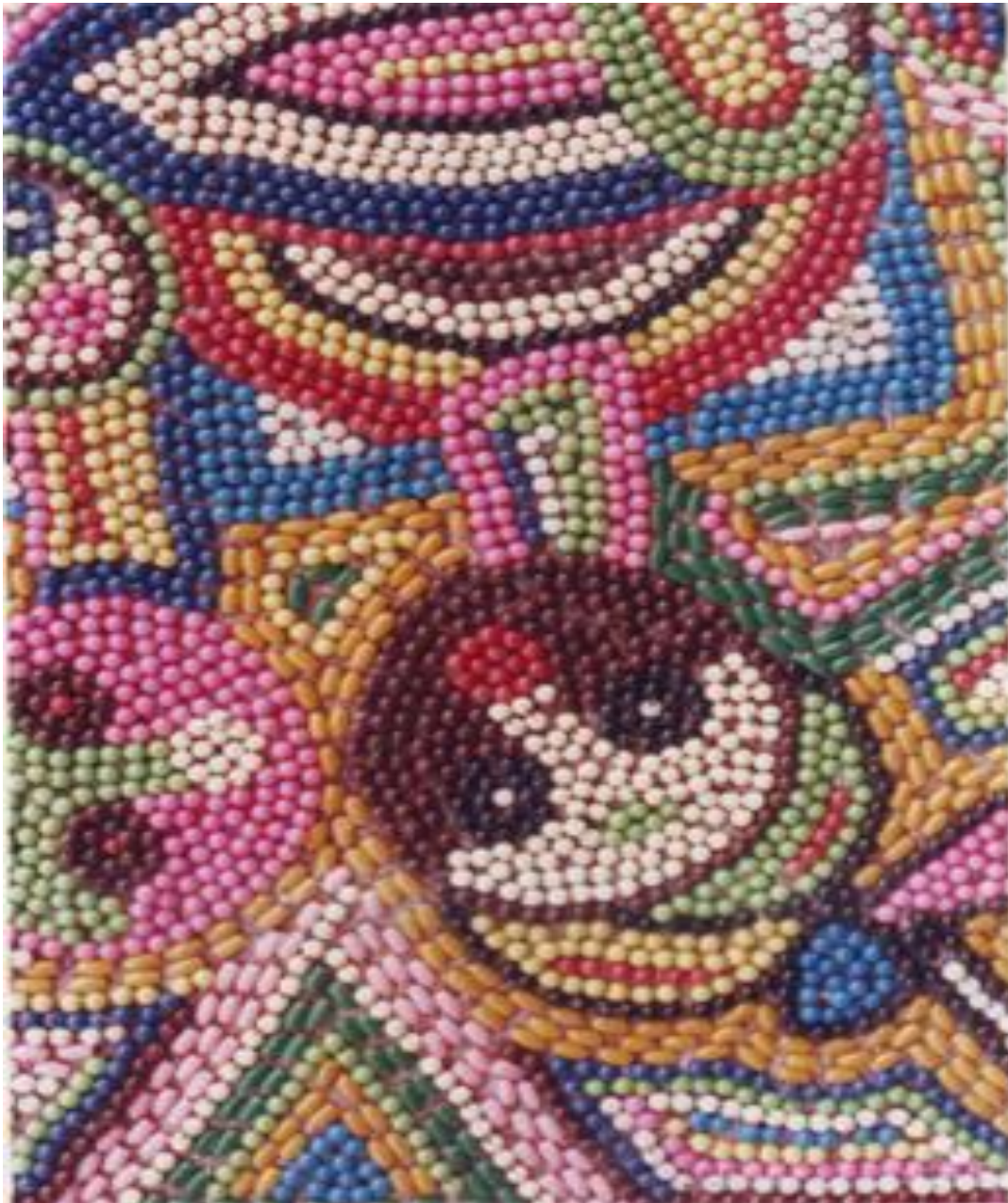
Illustration N°3 : « La famille »

Matériaux : Tissu, perles de couleurs, fil