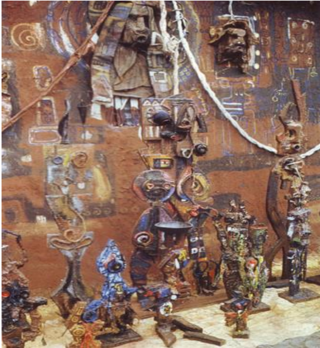
Illustration N°2 : « Question d'identité »

Matériaux : Bois, matériaux de récupération, toile de jute, pigments, corde