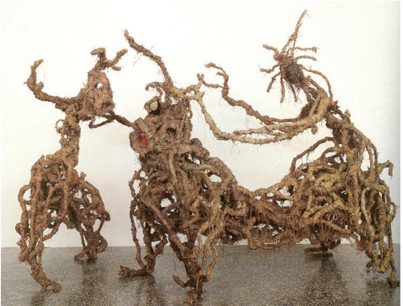
Illustration N°4 : « La bestialité »

Matériaux : Fil de fer, fibre de toile de jute.