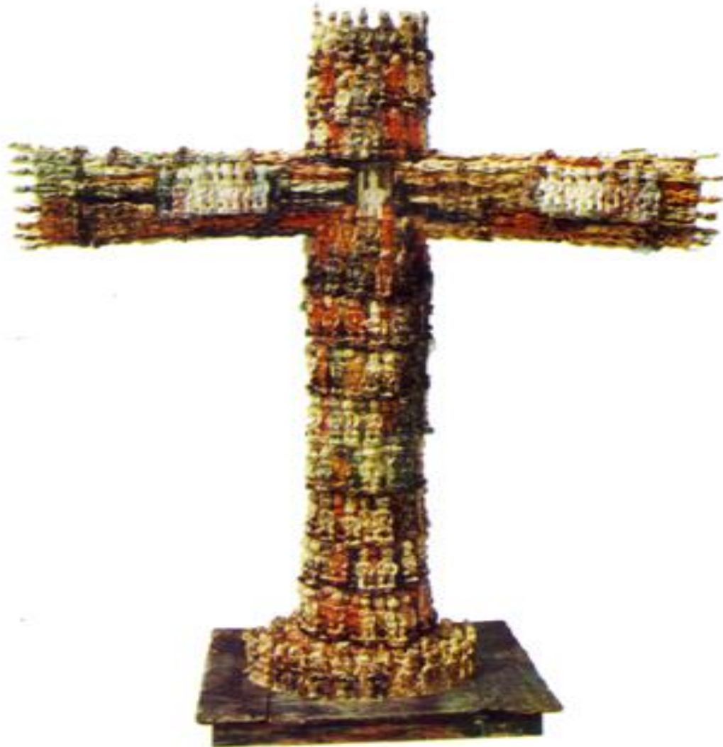
Illustration N°6 : « Chemin de croix »

Matériaux : Bois, peinture, clous, colle