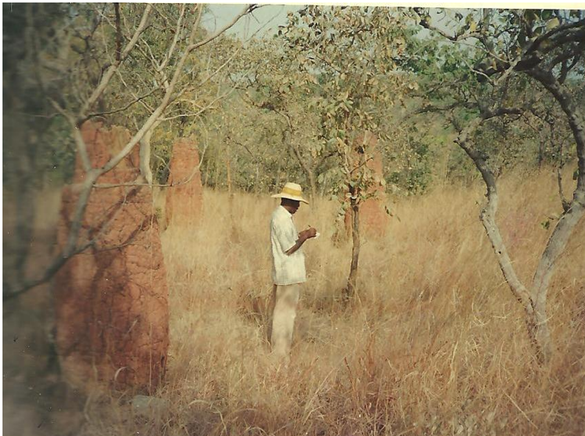
Figure n°7 : Batterie de fourneaux du site de Datawori(Extrait de : Projet “Métallurgies Africaines”, Les Technologies Métallurgiques dans l’Atacora/ Equipe pluridisciplinaire/ Coordinateur du projet : E. TIANDO ; UAC- 1997.

De ces hauts fourneaux, les résistants tiraient l’essentiel du fer ayant servi à la fabrication des flèches et d’autres armes.