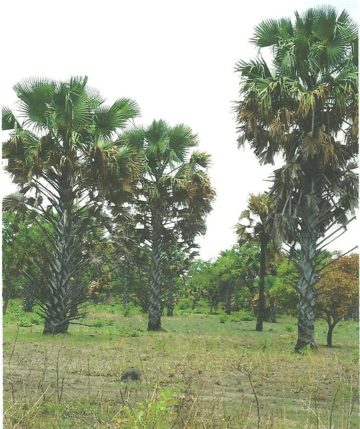
Figure 3 : Une rôneraie dans les environs de Ouassa Péhunco (Photo N° TIA Roger2011)