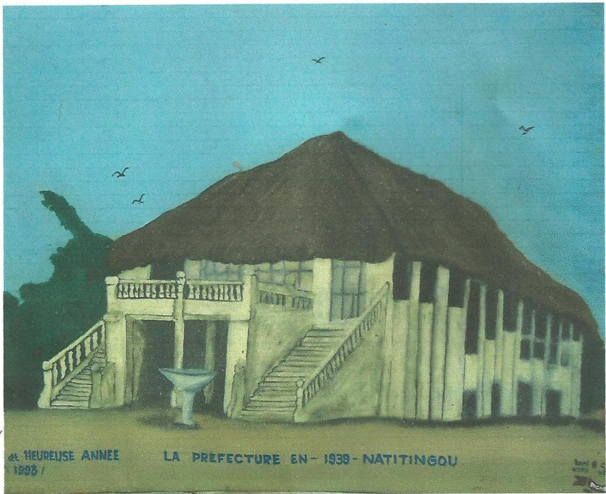
Figure 5 : Visage de l'immeuble ayant abrité le commandant du cercle de l'Atacora et les locaux administratifs jusqu'en 1939 (Dessin de Baba Yéropa).

Désabusées, les populations refusèrent de se soumettre à l'autorité de l'administration coloniale. Elles comprirent que désormais l'homme « Blanc » n'apportait plus son amitié, son aide, mais favorisait plutôt les exactions, encourageait les abus de toutes sortes, cautionnait les rivalités. Ce qui perturbait dangereusement le climat social.