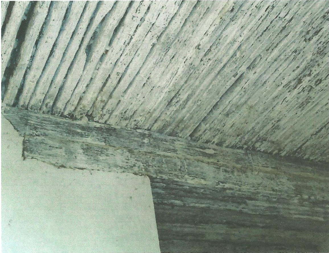
Figure 2 : Chevrons de rônier supportant la dalle de l'étage (N'TIA Roger, 2011).

Cette espèce végétale était transportée des régions de Kouandé (Glimaro, Wassa Péhunco, Kérou) et de Tanguiéta (Dassari, Porga). De nombreux jeunes de toutes les localités étaient mobilisés sur les différents lieux d'abattage de ces essences pour assurer leur transport. Cet arbre de huit à dix mètres de long, pesant environ cinq cent (500) kilogrammes, ne devait subir aucune transformation, afin d'en rendre l'acheminement plus aisé (Débourou, 1975 : 110). En d'autres termes, il ne fallait fendre ces troncs d'arbre qu'une fois parvenus à destination. Dans cette région à relief très accidenté, de nombreux porteurs succombaient, victimes de chutes fréquentes.