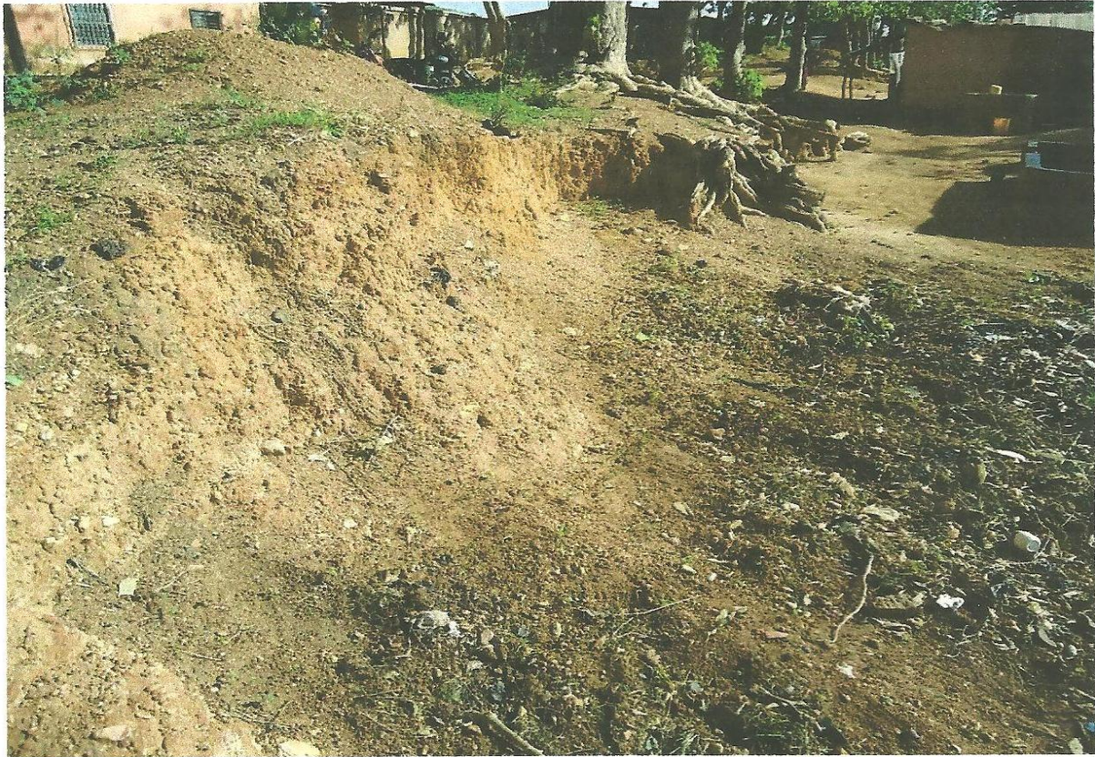
Figure 1 : Lieu où était prélevée la terre ayant servi à la fabrication des briques pour construire la résidence du commandant du cercle et des locaux administratifs (quartier Bagri, route des eaux et forêts). (Photo, N'TIA Roger).

C'est de ce lieu, qui s'étale sur environ 150 mètres, qu'hommes et femmes transportaient la terre avec des paniers vers le chantier. L'eau était transportée également du cours d'eau Frougninkrè (en langue waama), qui traverse aujourd'hui la ville de Natitingou.