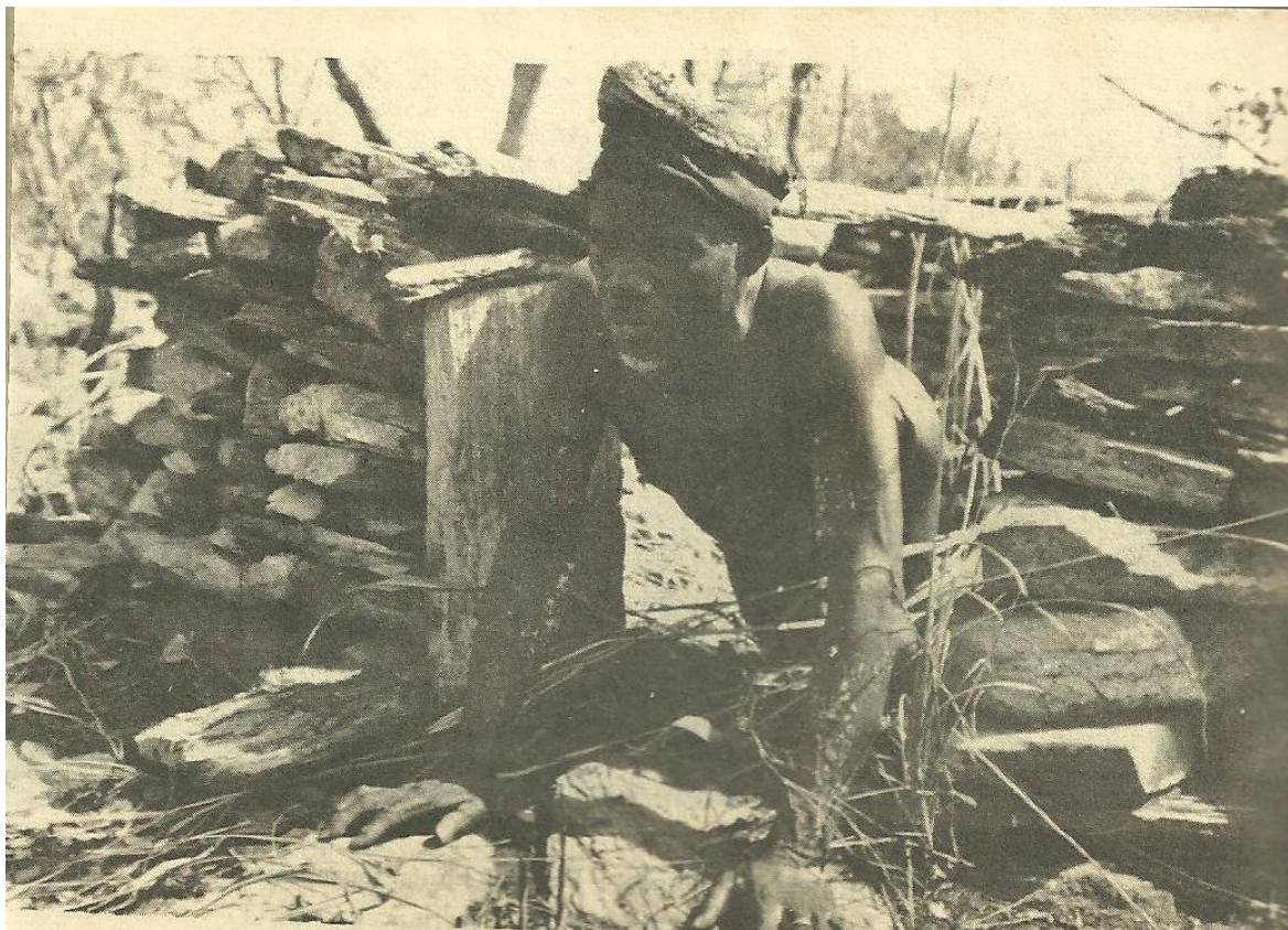
Figure n°6 : Exemple de case dans la position de woori à Tandafa : un guide simulant un guerrier de Kaba sortant de sa case.

presque à l'abri des vues de l'ennemi. Le village est entouré de plusieurs murs de pierres sèches d'une hauteur variant entre 0,80 m et 1,50 m et de 0,20 m à 0,60 m d'épaisseur, derrière lesquels se trouvaient les défenseurs (Kouandété, 1971 : 47).