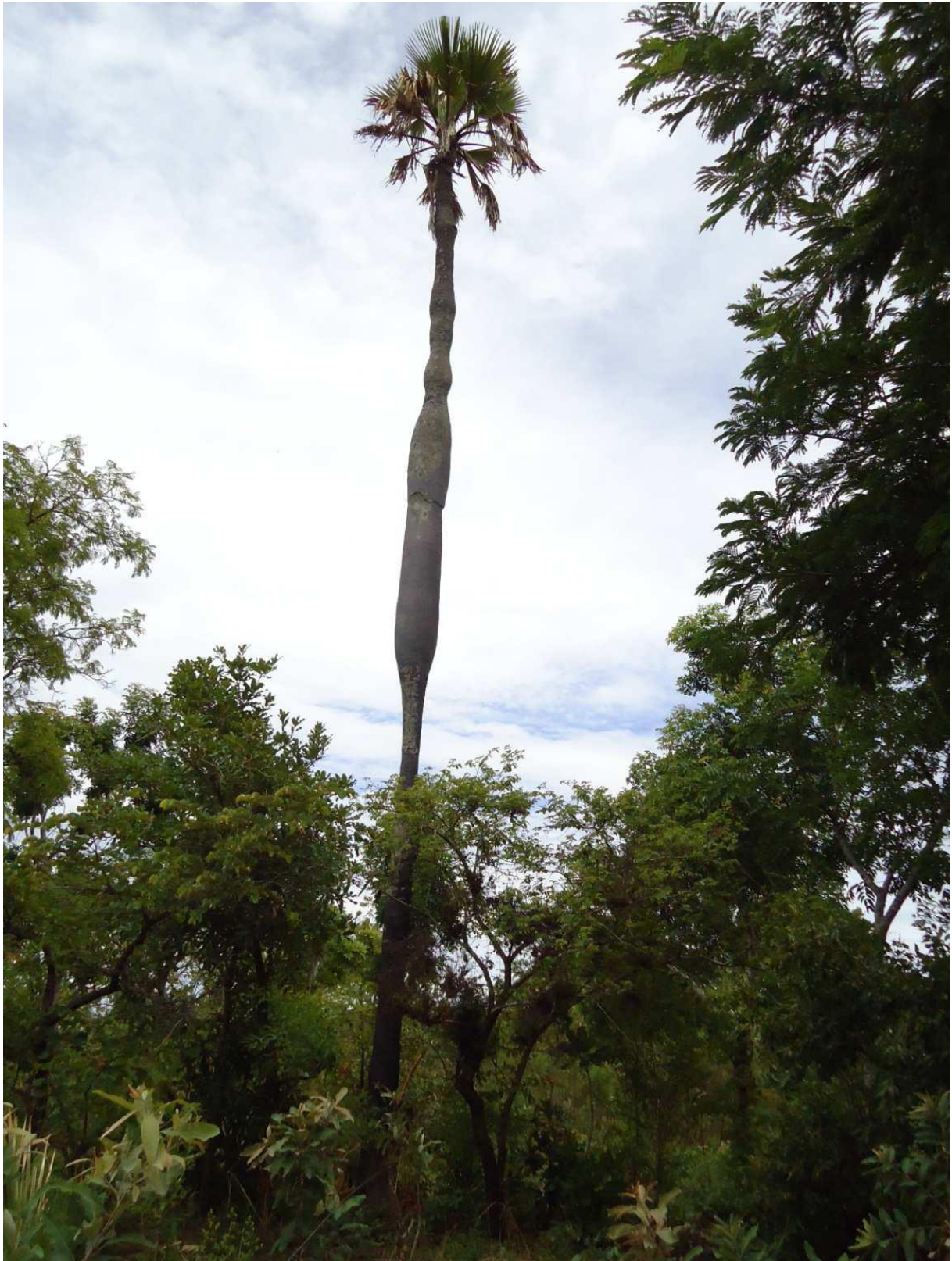
Figure 4 : Ce rônier-témoin de l'époque coloniale montre la forme gigantesque de ces essences.