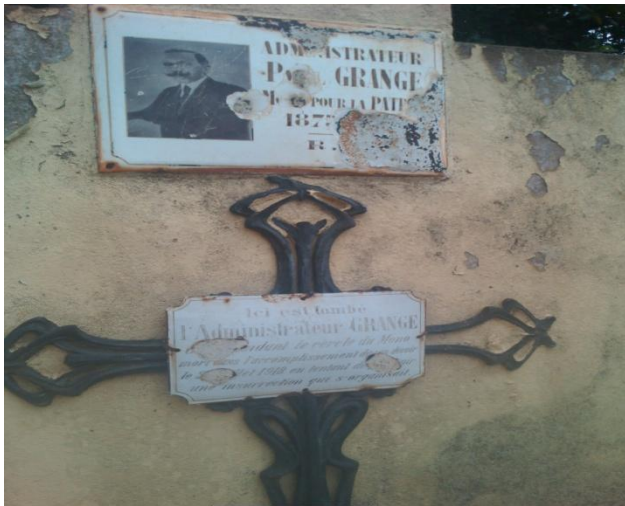
Photo 2 : Monument symbolisant le lieu de chute du commandant Grange à Doutou.

Atteint d'une balle à la tête, M. Grange fut tué sur le coup.