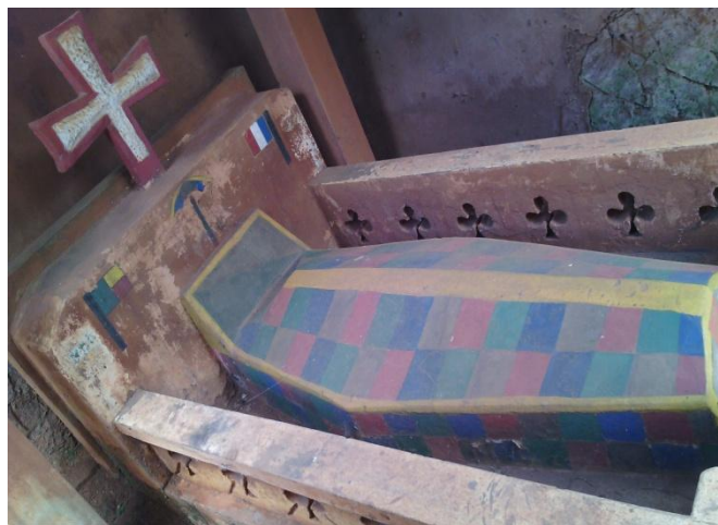
Photo 5 : Tombeau de la tête du chef de canton HOUINOU