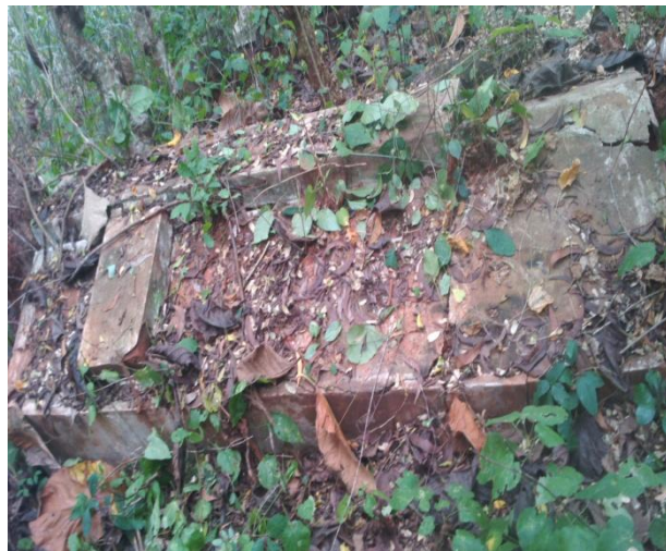
Photo 3 : Tombeau du commandant Grange à Bopa dans un état de délabrement total

Source : Photo prise par EDAH GUIZO R. T. le Jeudi 16 Septembre 2015