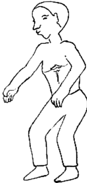
Schéma n°1 : -Danseur en doople