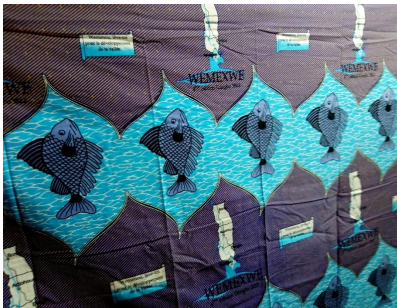
Pagne 4 : Le pagne de la 4 e édition, Dangbo 2013