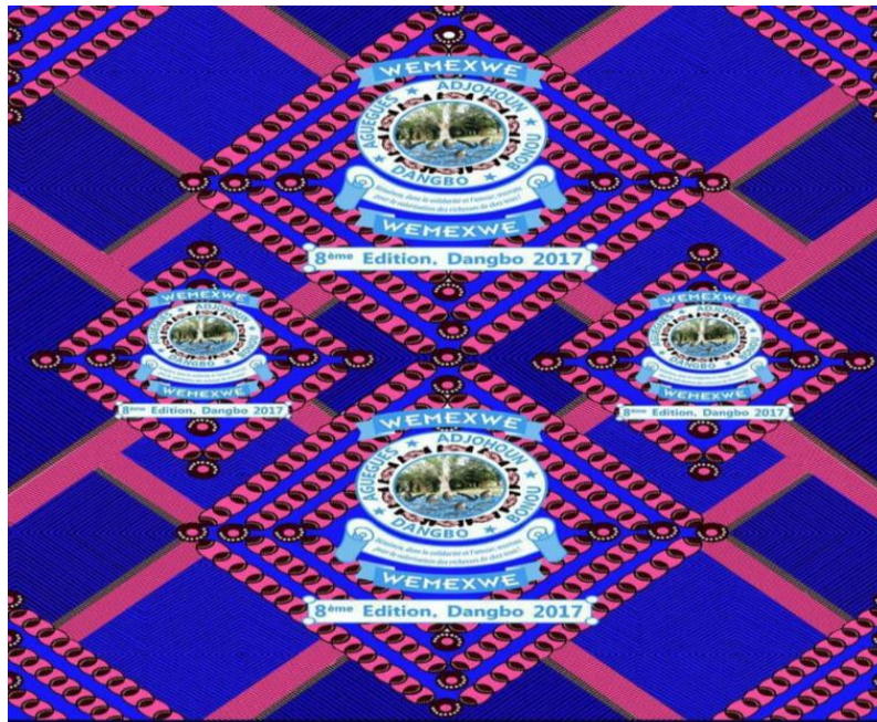
Pagne 8 : Le pagne de la 8 e édition, Dangbo 2017