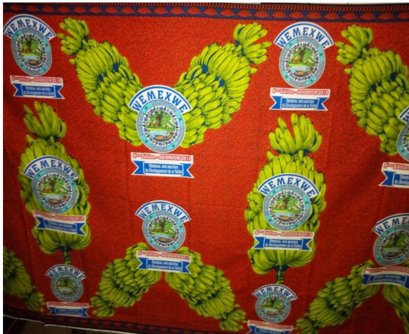
Pagne 9 : Le pagne de la 9è édition, Adjohoun 2018