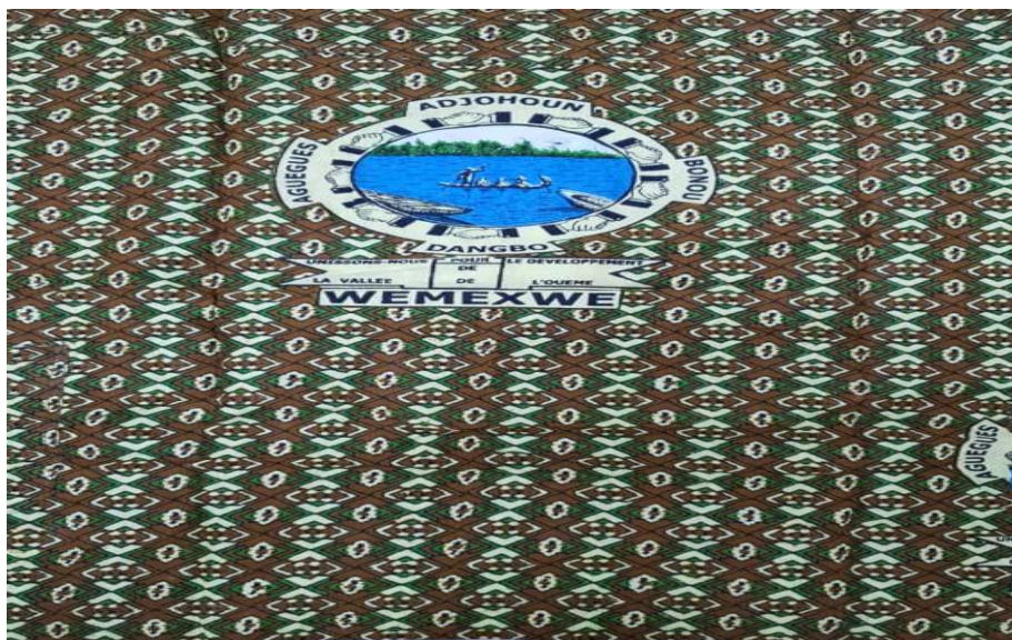
Pagne 1 : Le pagne de la 1 ère édition, Azonwlissè 2010