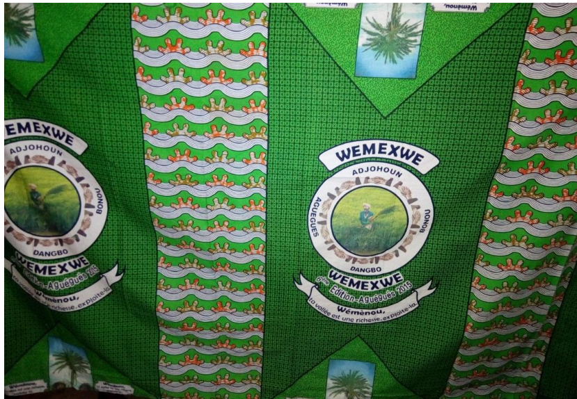
Pagne 6 : pagne de la 6 e édition, Aguégus 2015