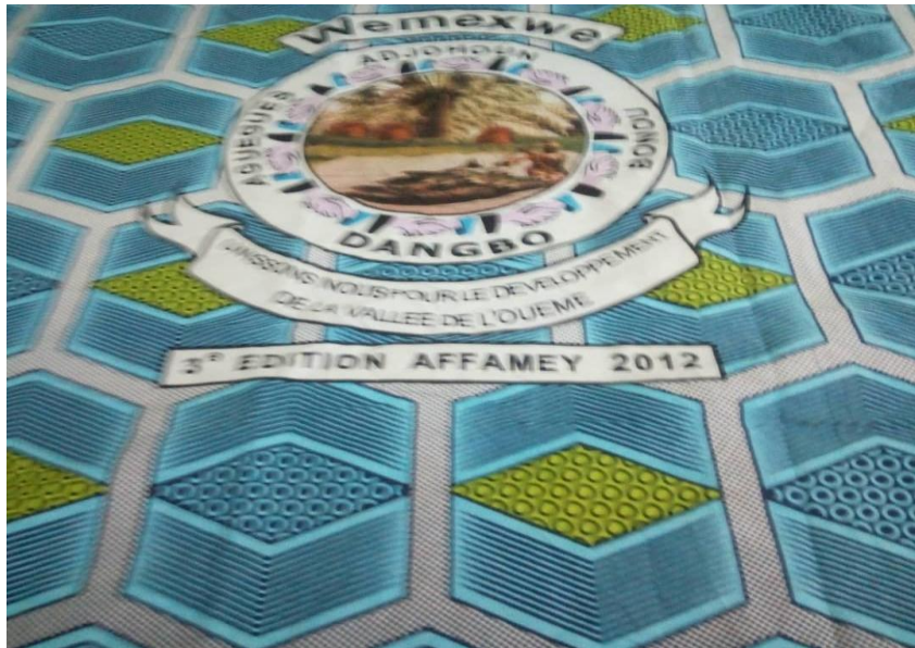
Pagne 3 : Le pagne de la 3 e édition, Affamey 2012