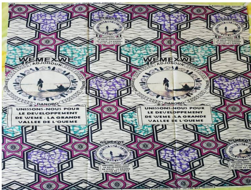
Pagne 2 : Le pagne de la 2 e édition, Aguégus 2011