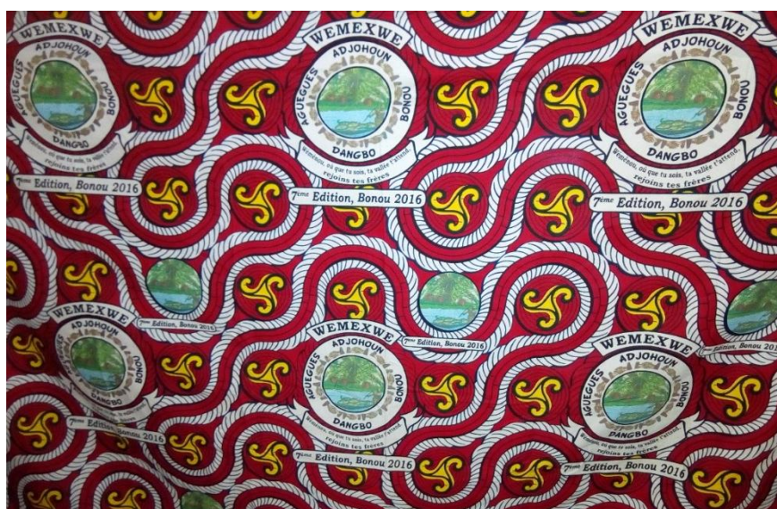
Pagne 7 : Le pagne de la 7 è édition, Bonou 2016