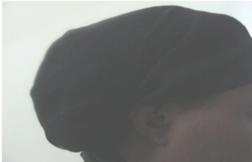
Image n°4 : tàbibálá kpódó avòyùyù kpó : Tête couverte d'un foulard noir 37

Il s'agit en substance ici de la couverture de la tête et de la couleur des habits portés.