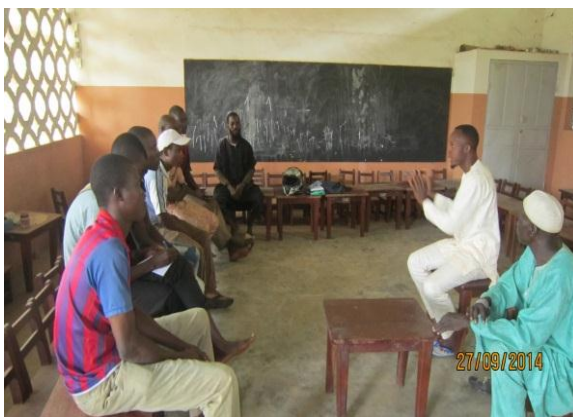
Photo n°3 : Discussion de groupe avec les auditeurs fidèles de radio Kandi FM.