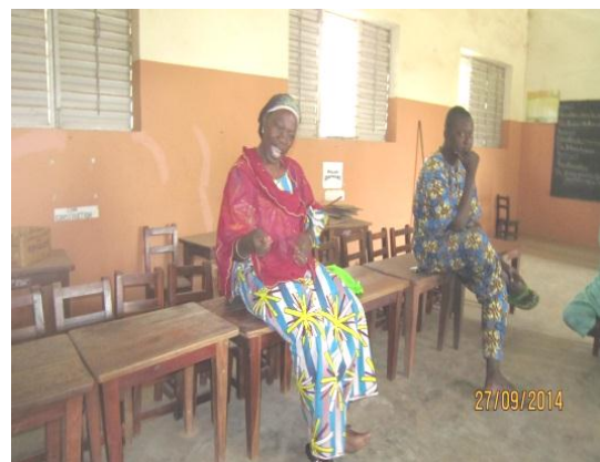
Photo n°4 : Cette image montre qu'on note l'existence d'une femme au sein de ces auditeurs fidèles.