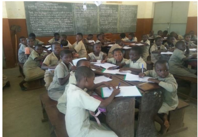
Photo 1: Groupe représenté uniquement de filles

Les photos 1 et 2 ont été prises dans une classe que composent 54 écoliers dont 27 filles et 27 garçons. Huit groupes de 6 à 8 écoliers sont constitués dans la classe. Un groupe de sexe unique (féminin) et deux groupes constitués de 6 garçons et une fille ont été observés. On observe une forte disparité de sexe dans les groupes qui constituent cette classe. L'observation dans les salles a permis de relever que les groupes homogènes (composés uniquement de filles) ne portent pas leurs attentions sur les séquences de classe mais passent plutôt le temps à bavarder et ont toujours quelque chose à se chuchoter à l'oreille ce qui perturbe les séquences de classe. Les groupes ainsi constitués ont un impact sur le comportement des écoliers au cours des séquences de classe.