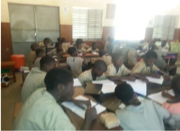
Photo 2: Groupe représenté majoritairement de garçons ; Cliché : Hostin 2016

Cela explique la faible hétérogénéité notée au sein des groupes dans les classes où nous avons effectué des observations. On observe des groupes où les filles sont majoritairement représentées voire une présence exclusive de filles pendant que les garçons dominent dans d'autres.