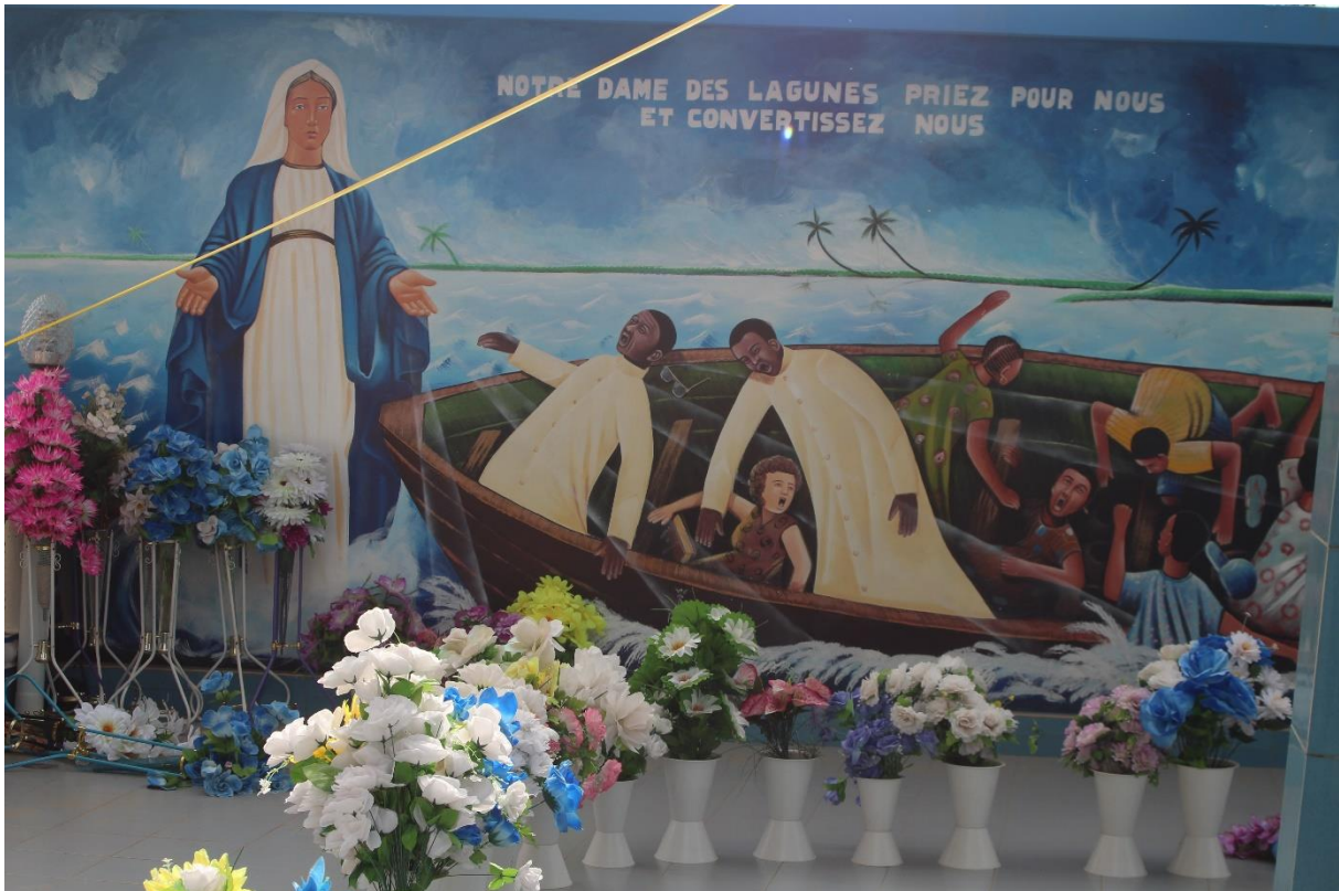
Photo 10: La vierge Marie de la paroisse Notre Dame des lagunes de Porto-Novo

Dans tous les domaines de la vie, des forces occultes sont utilisées pour provoquer le mal chez des victimes. Selon la forme et le domaine d’intervention, ces forces ont des noms et se manifestent diversement. Entre autres, on a : l’esprit de volatilisation et de dilapidation de l’argent : Par jalousie, ou par pure méchanceté, des individus malveillants mettent en jeu des forces maléfiques pour faire volatiliser l’argent de ceux à qui ils en veulent. Ces forces négatives sont utilisées pour provoquer chez les victimes, des situations de dépenses inutiles qui visent à l’anéantir complètement. Chez le marchand par exemple, le malfaiteur peut acheter avec des pièces de monnaie ou de billets de banque intentionnellement consacrés avec des forces nuisibles. Alors le marchand se voit dépossédé progressivement de ses recettes. Il les met en caisse et tout ou une grande partie disparaît mystiquement. Ces redoutables phénomènes vécus régulièrement par les populations, les ruinent et créent un climat de peur de sorte que celles-ci se trouvent dans l’obligation de surfer sur plusieurs tableaux religieux pour solutionner les maux dont elles souffrent.