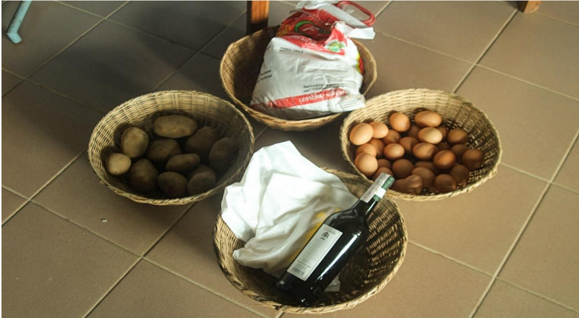
Photo 2 : L'offrande d'un groupe de prière de la paroisse St Paul d'Abomey-Calavi témoignage d'une gamme variée de productions agricoles

Les deux photos ci-dessous expliquent un peu les actions sociales et actions de grâce de quelques acteurs reconvertis au sein de l'église Catholique à Abomey-Calavi. Pour cerner le contenu des facteurs socioculturels qui conduisent la plupart des acteurs à changer de religion, il importe d'investir séparément les domaines social et culturel.