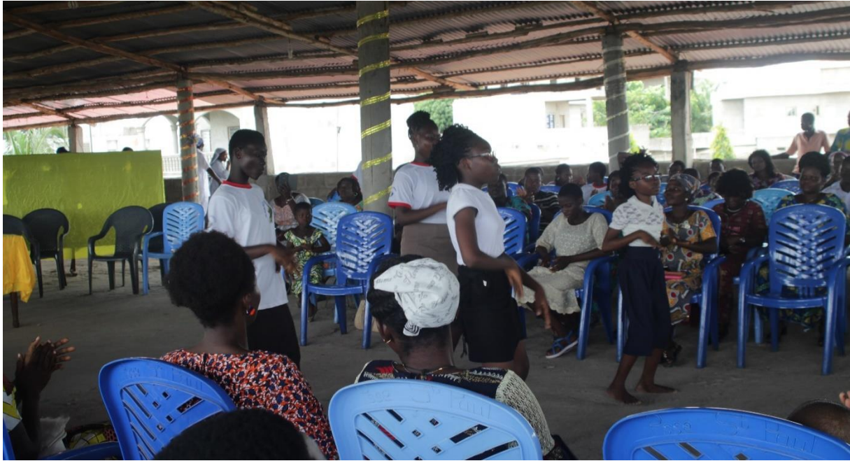
Photo 8: Séance de prières et d'animation du groupe de prières de fraternité Sacré Cœur du renouveau charismatique EMAUS du CAMPUS d'Abomey-Calavi.