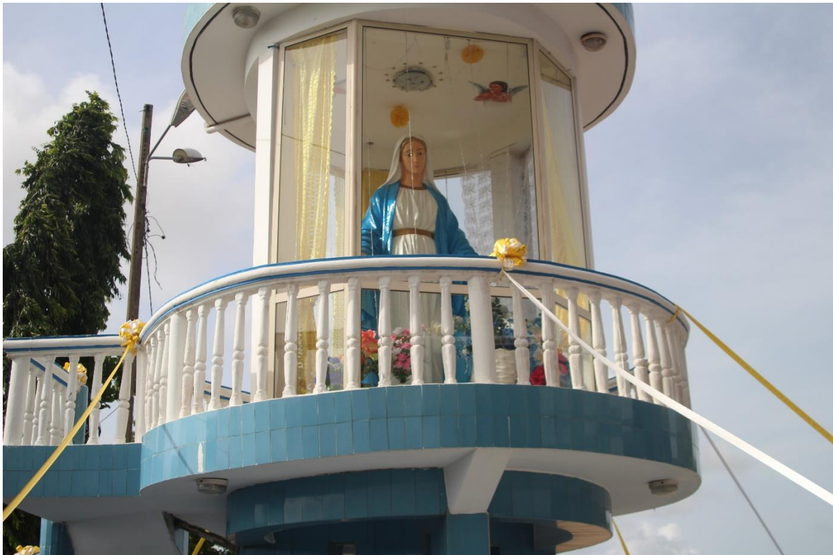
Photo 11 : La vierge Marie de la paroisse Notre Dame des lagunes qui défait les nœuds et qui apaise les cœurs meurtris (Porto-Novo)