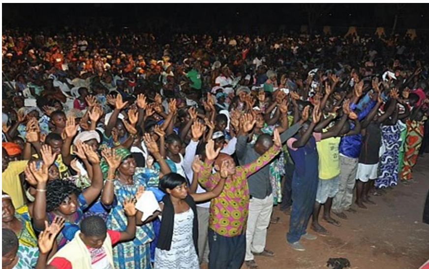
Photo 6 : Grande assemblée de prière de RCC

Les deux photos ci-dessous présentent les séances d'assemblée de prières et d'exhortations du groupe Renouveau Charismatique Catholique à Abomey-Calavi.