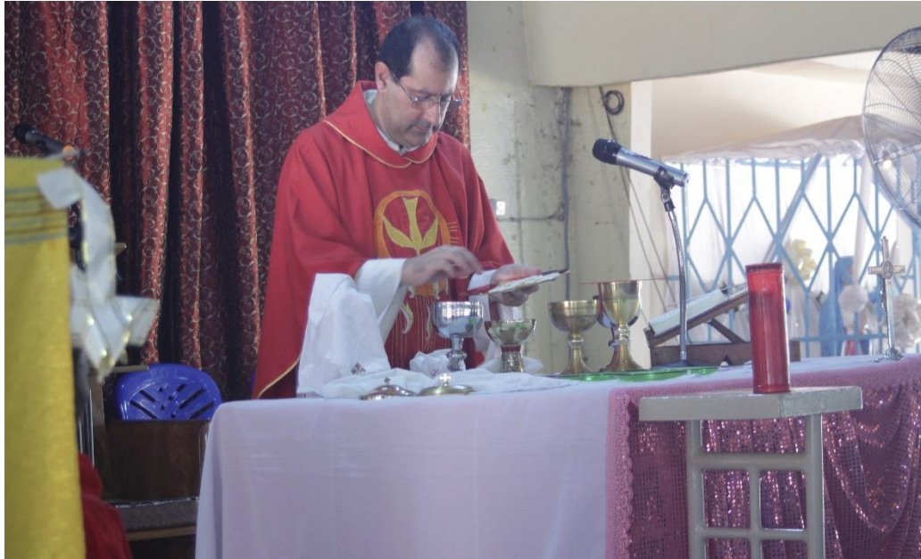
Photo 5 : Célébration eucharistique d'une messe d'action de grâce demandée par une famille reconvertie.

Cette photo traduit le témoignage d'un couple qui rend grâce à Dieu pour l'épanouissement de sa famille.