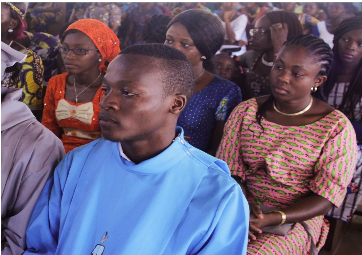
Photo 7 : Séance de prières d'une assemblée dirigée par un berger du renouveau charismatique.