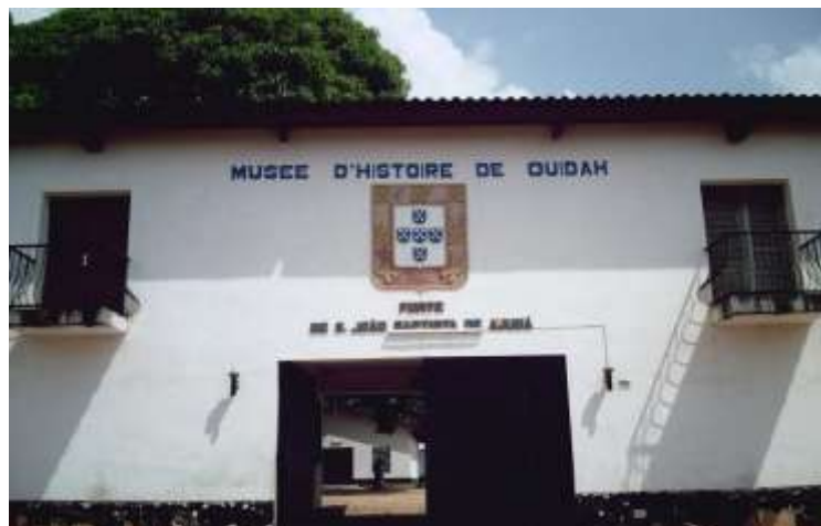
Photo n°3 : Façade du musée d'histoire de Wida

Cette photo indique le musée d'histoire de Wida . Ce musée est situé sur le site de l'ancien fort portugais.