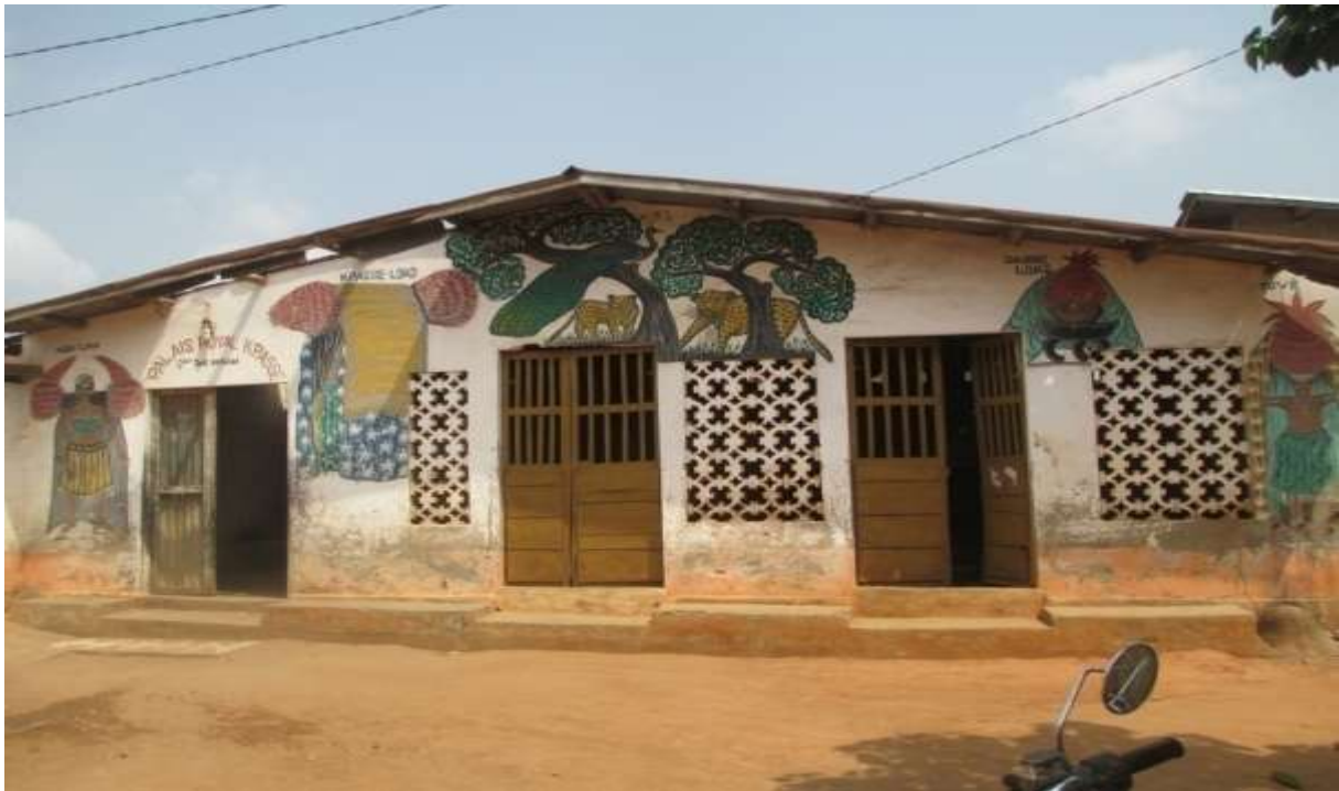
Photo n°8 : La façade du palais royal de Wída peinte des différents acinà

sont spécialistes du Hwunvè , acinà , qui est au centre de toutes les divinités vénérées. Par exemple, Xwéviósò , Lókò , Sakpata , Lísá , etc. » (propos recueilli, 20 janvier 2017 à Wída ). Un autre interviewé dit que « Le vodun Hwunvè est pour les xwela avec la pratique d'acinà » (propos recueilli le 17 janvier 2017 à wída ). Il est à noter que chaque clan xwela a son vodun. La photo n°8 illustre la façade du palais royal de wída peinte au différents acinà .