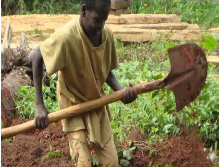
Photo N°1 : Enfant apprenti d'environ 10 ans, creusant des trous de fondation sur un chantier isolé des agglomérations, P. YASSEGOUNGBE, 2012

-Sur tous les chantiers, les matériels observés sont véritablement de petits matériels de travail. Il s'agit de houe, coupe-coupe, pèles, moules de briques, fils en nylon, cordons, niveaux, truelles, équerres, règle-maçon, taloche, marteaux divers, pinces, scie, paniers, brouettes, échelle en bois. A cela s'ajoutent les matériaux de construction : des fers, du ciment, des graviers, du sable fluvial, des pointes de toutes sorte, des planches de bois, des bois de constructions, l'eau dans des récipients divers : seaux, bidons, fûts.