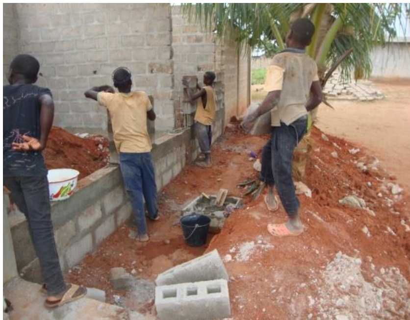
Photo N°2 : Enfants apprentis, sans surveillance du maître – maçon, l'un d'eux s'efforce de déplacer une grosse brique vers ses pairs qui élèvent le mur, P. YASSEGOUNGBE, 2012

Quand on les laisse sur les chantiers sans moustiquaire, il y a les risques liés au paludisme et à la délinquance juvénile. Pour eux, un chantier est supposé ne pas être habité. Mais lorsque l'on laisse l'enfant sur le chantier, c'est qu'on le laisse libre, livré à lui-même (c'est ce qui est illustré par la photo N° 2 ci-après). Et les risques de dépravations existent sur les chantiers. Par ailleurs ils signalent que sur les chantiers, des adultes amènent des femmes, leurs copines ou les prostituées sur ses chantiers et ils tiennent des rapports avec ces femmes en présence des enfants apprentis mineurs.