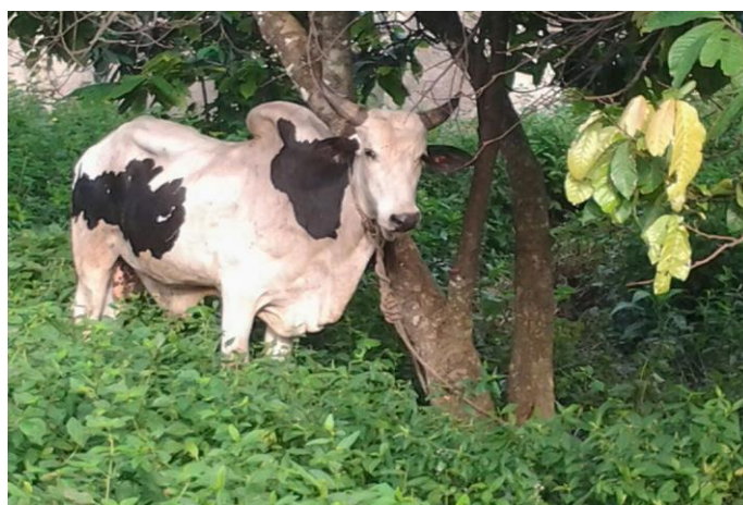
Photo 1 : Taureau offert au roi de Tchatchou par la communauté Peule de la localité lors d'une cérémonie de funérailles.

« Depuis nos mères jusqu'à un passé récent ce sont les femmes Baatombu qui nous faisaient le beurre de karité. Nous, on les amenait seulement le karité et elles se chargent de faire tout le travail. On n'a jamais payé pour le service qu'elles nous rendent. En plus lors des cérémonies, elles nous donnent avec le sel, le beurre de karité etc» (entretien réalisé à Banigri, le 22/10/2015).