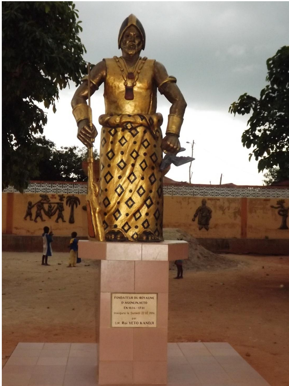
Photo8 :Statue du roi ‘yèto’ de AGONLIN-HOUEGBO