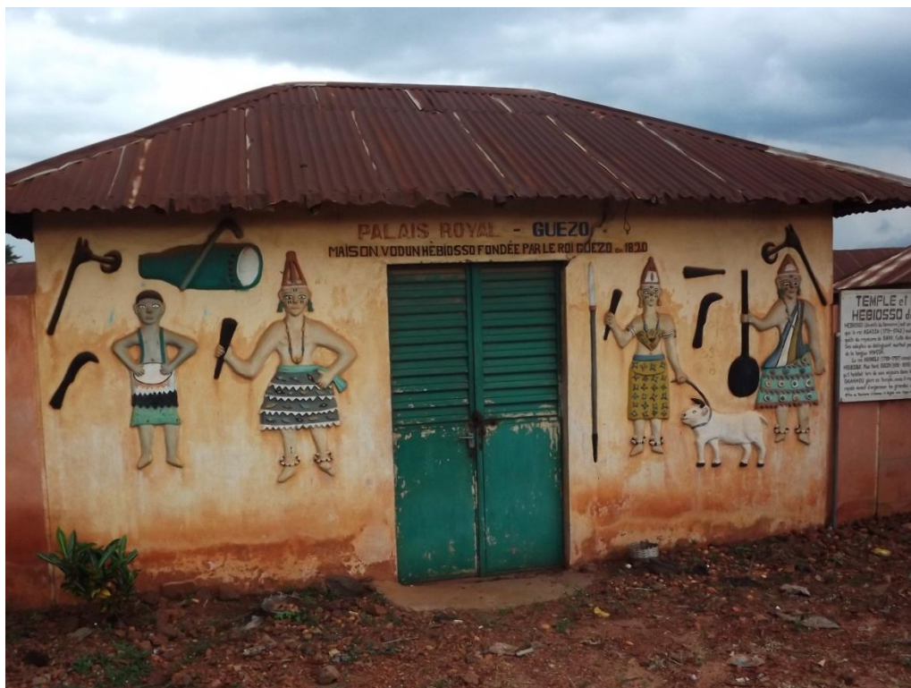
Photo1 : Temple de la divinité "xeviosso " de AGONLIN-HOUEGBO. Prise de vue : MONHIDE, septembre 2014.

femmes à Agonlin-Houegbo. Voici les images prises sur la divinité "xevioso" à Agonlin-Houégbo.