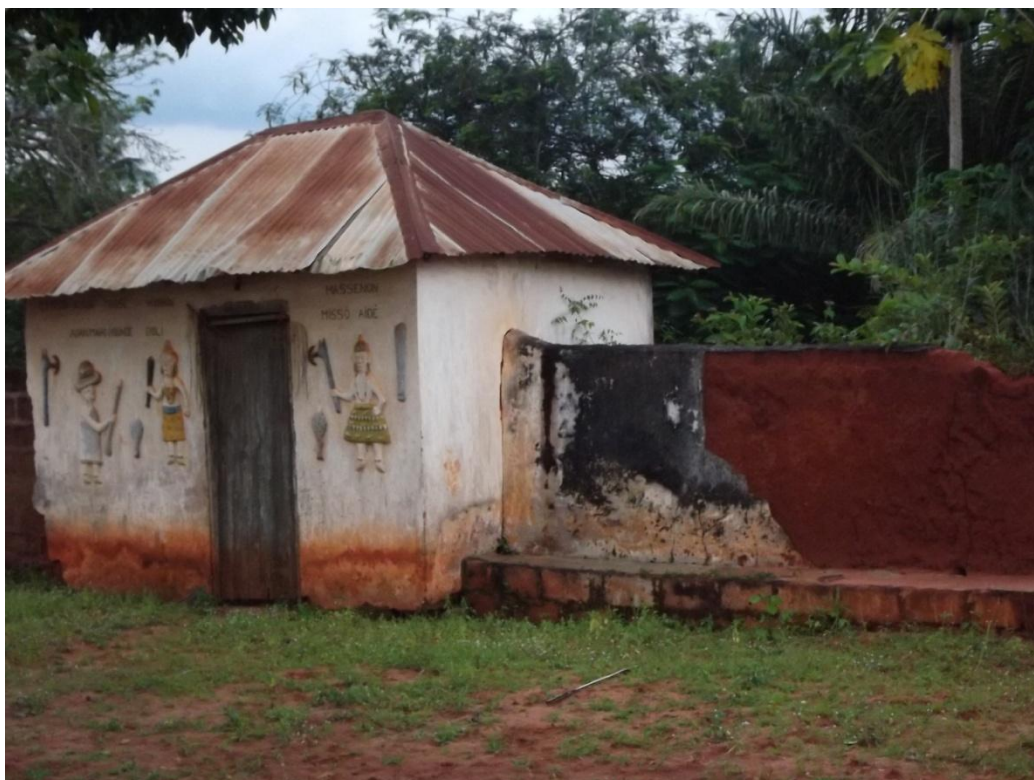
Photo4 : Temple de la divinité "Massé" de AGONLIN-HOUEGBO.