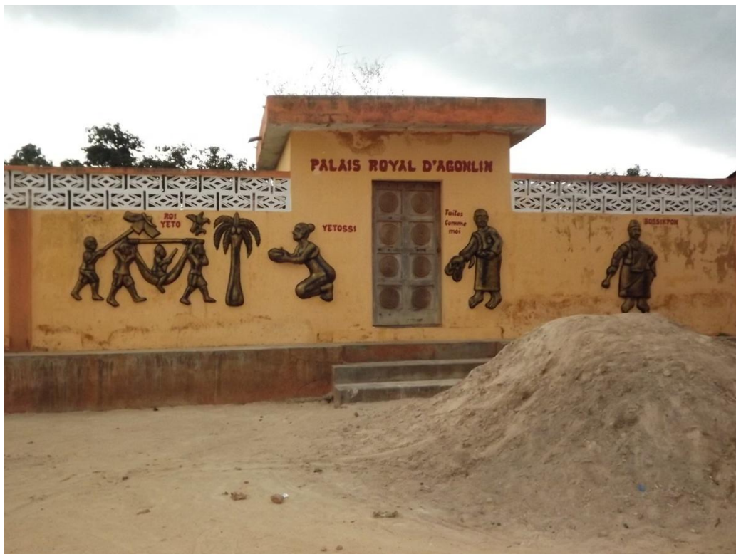
Photo7 :Palais royal "yèto" de AGONLIN-HOUEGBO

Voici les différentes images prises sur la divinité " Yèto " à Agonlin-Houégbo.