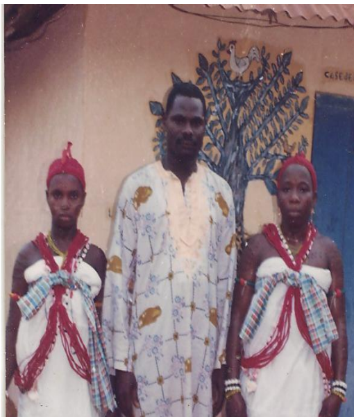
Photo2 : Deux "xeviossossi" avec le "xeviossonon"