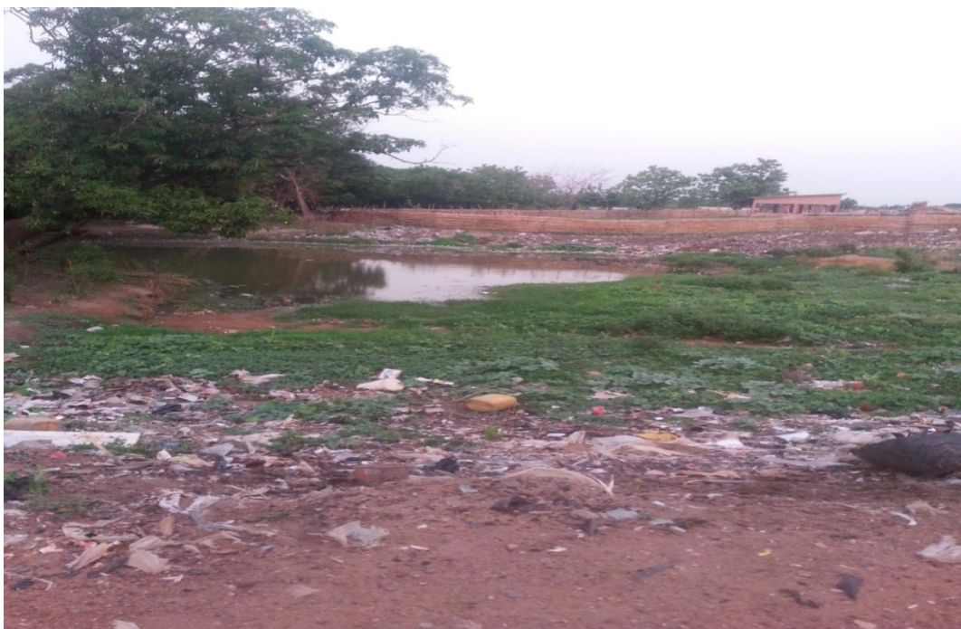
Photo 10 : La rivière Bèkè située du côté de Wénou devenue une décharge