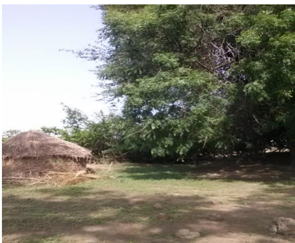
Photo 6 : La case de la divinité Buniru Photo 7 : Lieu de culte de Buniru.

kpi ! ». Ce qui signifie «à l'aide ! à l'aide ! aidez-moi ! Ils ont détruit ma maison et je ne sais pas où coucher mes enfants ». Pendant trois nuits d'affilée, cette voix n'a pas arrêté de se plaindre. Inquiet, le chef du village envoya deux hommes à Namunan, en pays Gourmantché, consulter l'oracle. Ce dernier révéla que dans l'arbre qui a été terrassé, vivaient une femme et ses enfants. C'est elle qui se plaint tous les soirs. Il fallait donc trouver une autre maison à cette femme et ses enfants. C'est ainsi qu'une case a été construite près de l'arbre. Lorsque la construction est terminée, le chef du village s'est rendu près de l'arbre abattu et a dit : « yéwé sa nu diru kpa banruwan. A wunin bibu fuo kpaï wura miguia », ce qui veut dire : « voilà, nous t'avons construit une nouvelle maison. Prends tes enfants et allez-y rester. » Depuis ce jour, les plaintes ont cessé. Sur décision du chef, l'arbre près duquel la case a été construite est vénéré et la case est considérée comme le temple de la divinité 159 du village.