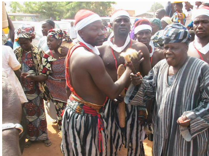
Fig n°10 : Danseurs de têkê , (Photo Ismaïla MABOUDOU, 4 février 2012)

Cette danse est une compétition entre plusieurs groupes ou villages. Les thèmes des chansons embrassent tous les domaines de la vie tels que la générosité et la ladrerie, le courage et la couardise, la fidélité et l'infidélité, la beauté et la laideur, l'amour et la haine.