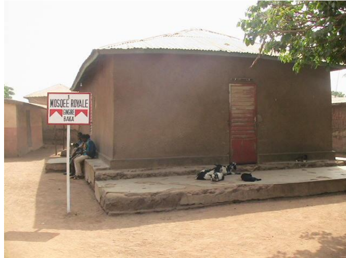
Fig n° 1 : Place Lemannu, (Photo Ismaïla MABOUDOU, 4 février 2012)

Le deuxième lieu visité après Lemannu est le gros tas d'ordure appelé Tem Yanku Bakar à deux kilomètres et demi du palais. Là, le roi fait encore des prières selon un rituel particulier. L'histoire de ce lieu est longue et controversée.