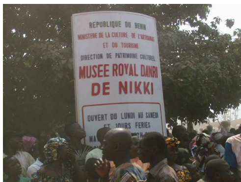
Fig n°5 : Musée royal de Niki, (4 février 2012)

Après, c'est l'emplacement des tambours sacrés dans la cour du palais. Le roi se présente devant les tambours sacrés, sans aucun cérémonial particulier. La population applaudit en criant nasara nasara qui signifie "victoire ! victoire !" Ici, une question mérite d'être posée. Pourquoi ce cri en langue étrangère ? Pour le comprendre, il faut remonter aux origines de la Gaanni . En effet, les Baatombu autochtones disent qu'ils fêtaient la Gaanni avant l'ère wasangari. Pourquoi alors cette fête est-elle conçue par les Wasangari comme une victoire si elle est vraiment baatonnu ? C'est en cela que nous soutenons les points de vue de certains de nos informateurs qui veulent que la Gaanni soit considérée comme une fête wasangari surtout que nous savons que les Wasangari ont fui les Arabes. La victoire ici traduit la réussite des Wasangari à se libérer de la conversion obligatoire musulmane.