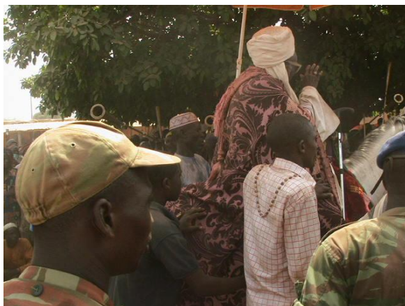
Fig n° 6 : Emplacement des tambours sacrés, (Photo Ismaïla MABOUDOU, 4 février 2012)

Après, c'est l'emplacement des tambours sacrés dans la cour du palais. Le roi se présente devant les tambours sacrés, sans aucun cérémonial particulier. La population applaudit en criant nasara nasara qui signifie "victoire ! victoire !" Ici, une question mérite d'être posée. Pourquoi ce cri en langue étrangère ? Pour le comprendre, il faut remonter aux origines de la Gaanni . En effet, les Baatombu autochtones disent qu'ils fêtaient la Gaanni avant l'ère wasangari. Pourquoi alors cette fête est-elle conçue par les Wasangari comme une victoire si elle est vraiment baatonnu ? C'est en cela que nous soutenons les points de vue de certains de nos informateurs qui veulent que la Gaanni soit considérée comme une fête wasangari surtout que nous savons que les Wasangari ont fui les Arabes. La victoire ici traduit la réussite des Wasangari à se libérer de la conversion obligatoire musulmane.