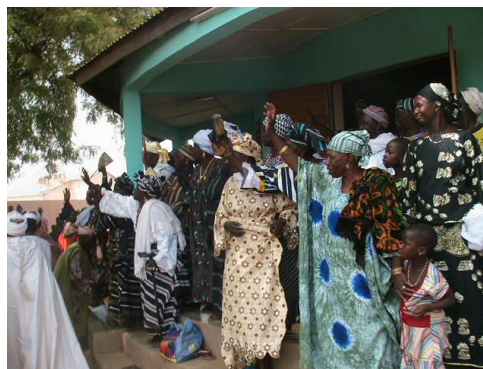
Fig n°8 : Devant les tambours sacrés, (Photo Ismaïla MABOUDOU, 4 février 2012)

Le périple long de plus de douze kilomètres à l'intérieur de la ville de Niki, s'achève devant la cour royale où le Sinaboko passe une seconde fois devant les tambours sacrés aux sons pétillants des longues trompettes.