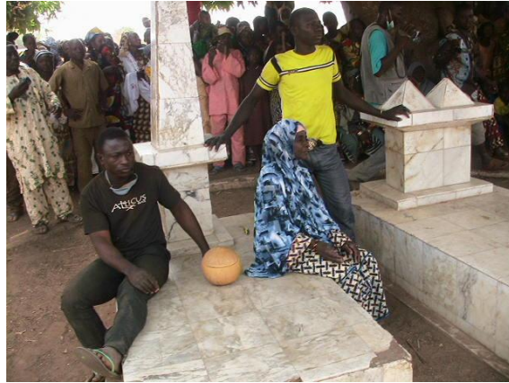
Fig n° 3 : Place Dankiru , (Photo Ismaïla MABOUDOU, 4 février 2012)

Quant au quatrième site appelé Bãa Tiaru , il est à trois kilomètres et demi du palais. C'est le tombeau de Fãru Yerima, un prince de grande renommée. C'était le lieu de rencontre des puissants princes du royaume.