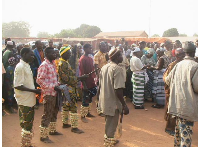
Fig n°11 : Danseurs de Sinsinnu , Photo Ismaïla MABOUDOU, 4 février 2012)

jambes. Les pas de danse laissent un bruit accompagné du son d'une flûte, d'un tam-tam et d'un tambour. Les danseurs célèbres de Sinsinnu sont à Soubado dans la commune de Kpɛɛ, à Sokounon dans la commune de Parakou et à Wanrarou dans la commune de Gbembɛrɛkɛ 95 .