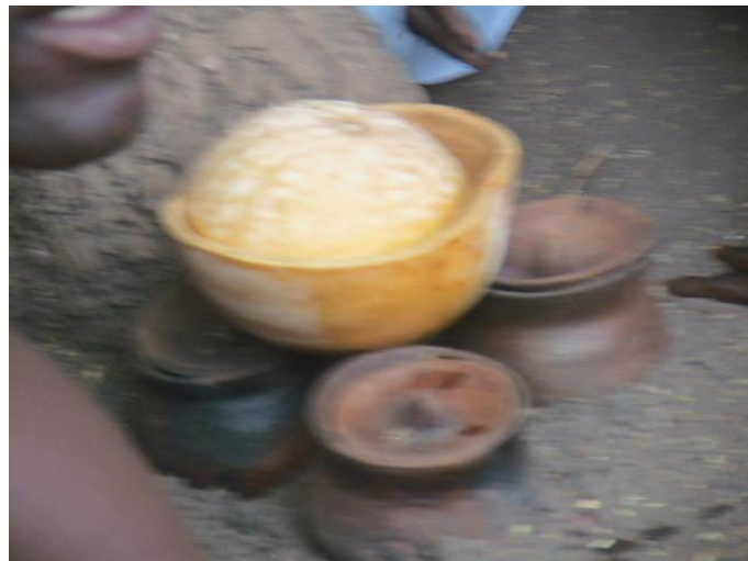
Fig n°2 : Place Tem Yanku Bakaru, (Photo Ismaïla MABOUDOU, 4 février 2012)

Après la fondation de Niki, le royaume était tombé en ruines. C'est le cinquième roi Kpe Gunu Kaba Wuko qui a su ressusciter le royaume de Niki. Dans cette résurrection, il a désherbé les ruines pour restaurer le centre ; ce qui lui a valu le nom de kabawuko 84 .