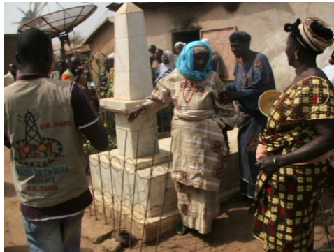
Fig n° 7 : Bākpilu , (Photo Ismaïla MABOUDOU, 4 février 2012)

Ensuite, c'est la visite de Bākpilu à 11 kilomètres du palais. C'est la tombe du roi Kpe Gunu Kaba Wuko 87 . A ce niveau, le roi est reçu par une vieille femme, la gardienne du tombeau. Elle lui offre la traditionnelle eau de paix et de prospérité et reçoit en récompense argent et cola. C'est ici la fin du parcours. Le roi revient au palais et se présente une seconde fois devant les tambours sacrés.