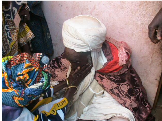
Fig n° 9 : Ablution faite au roi, (Photo Ismaïla MABOUDOU, 4 février 2012)

s'asseoir dans sa case ronde appelée Siñkô . C'est de là qu'il assiste aux manifestations. Il est entouré de ses ministres et d'autres dignitaires 88 .