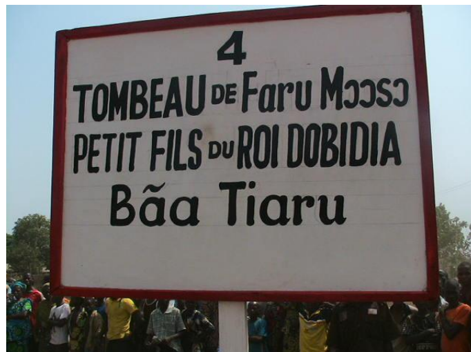
Fig n°4 : Place Bãa Tiaru , (Photo Ismaïla MABOUDOU, 4 février 2012)

Quant au quatrième site appelé Bãa Tiaru , il est à trois kilomètres et demi du palais. C'est le tombeau de Fãru Yerima, un prince de grande renommée. C'était le lieu de rencontre des puissants princes du royaume.