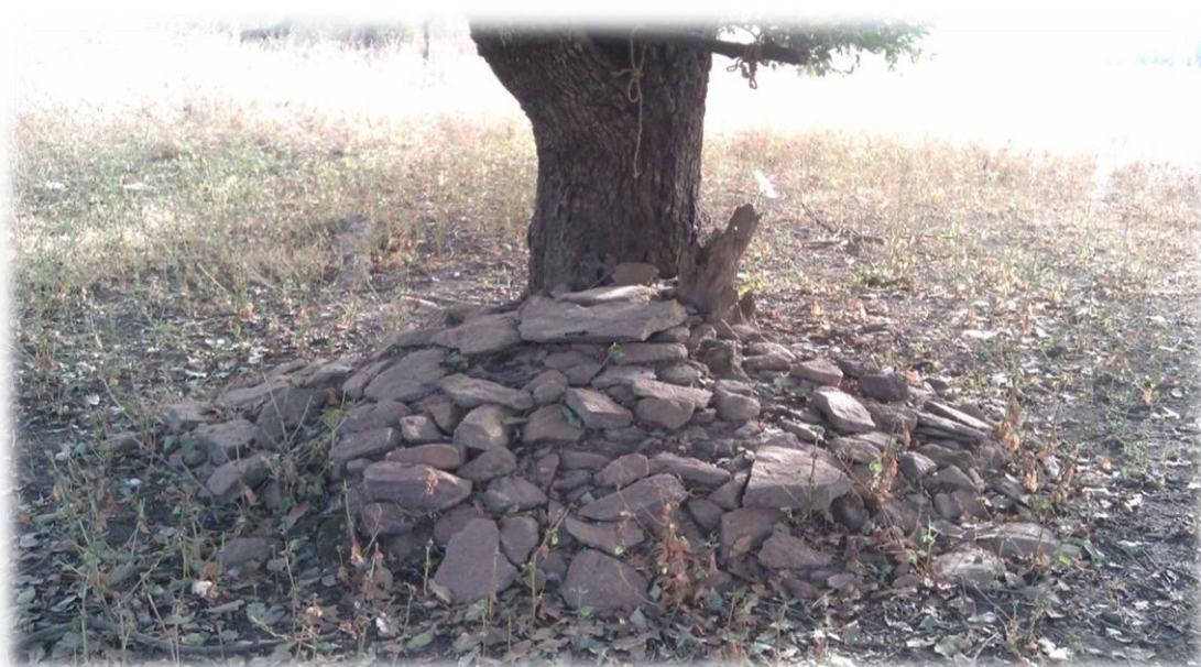
Réalisation : A. Y. Kolawolé AROGOU, decembre 2015.