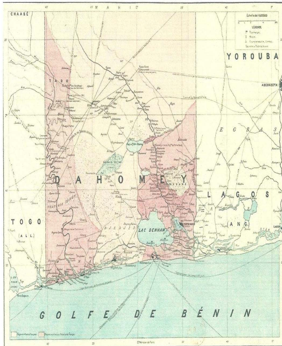
Carte n° 2 : Carte du Dahomey dressée sous la direction d'A.-L. d'Albéca, Juillet 1892.

Source : Vido (A.) et Vido (M.), 2015, Histoire des femmes du Sud-Bénin du XVII e au XIX e siècle , Saint-Denis, Edilivre, p. 16.