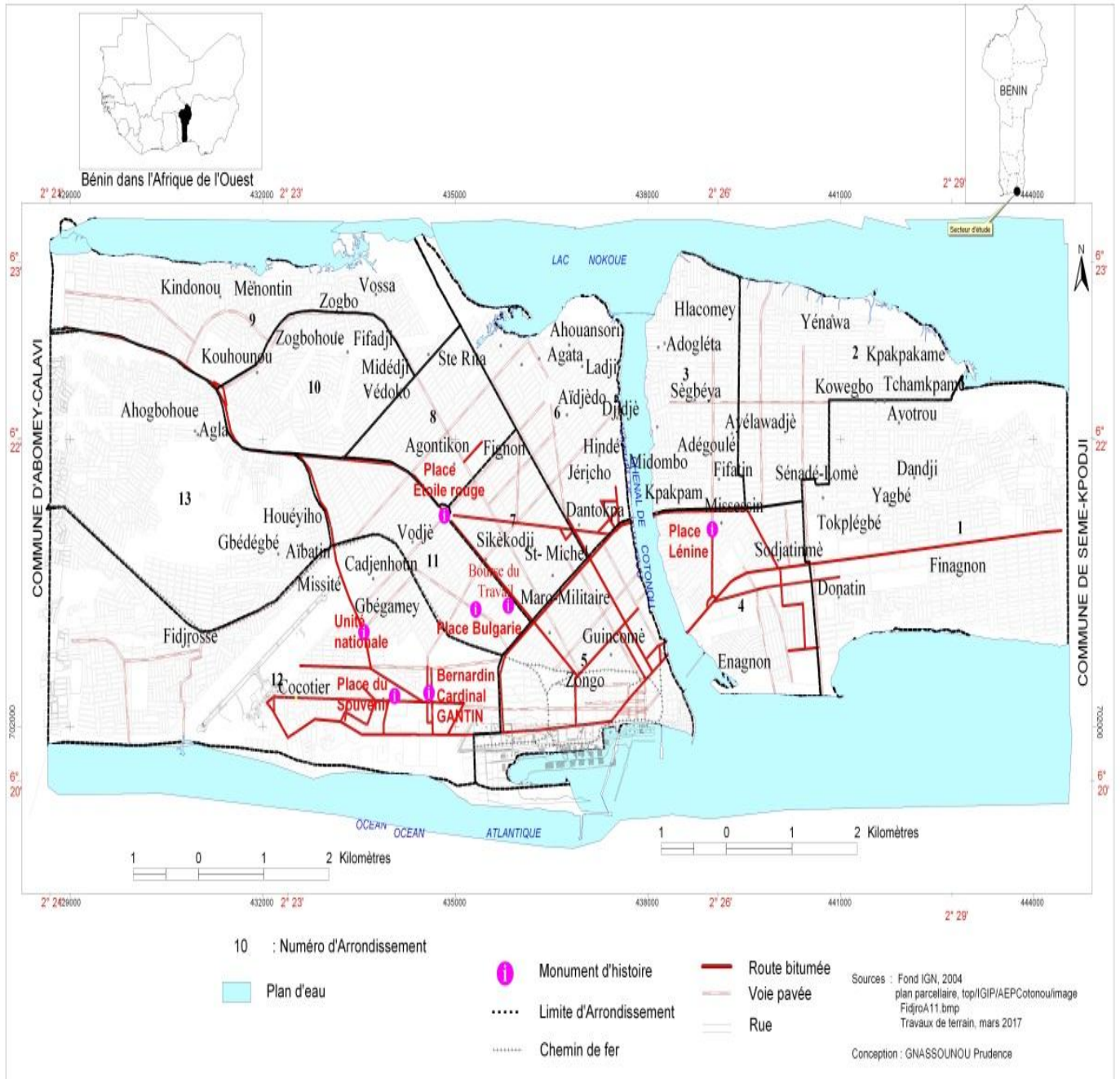
Carte n° 1 : Situation géographique de quelques monuments de la ville de Cotonou