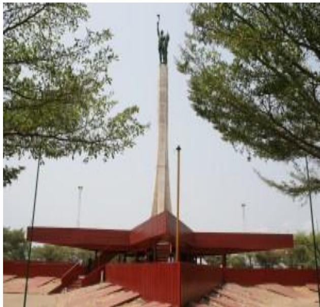
Etoile à cinq branches

Ce monument fut construit par les Russes en 1975 au temps fort de la révolution marxiste-léniniste. L'Etoile Rouge est le plus grand symbole marquant de cette période