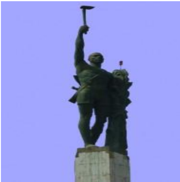
Vue rapprochée du monument