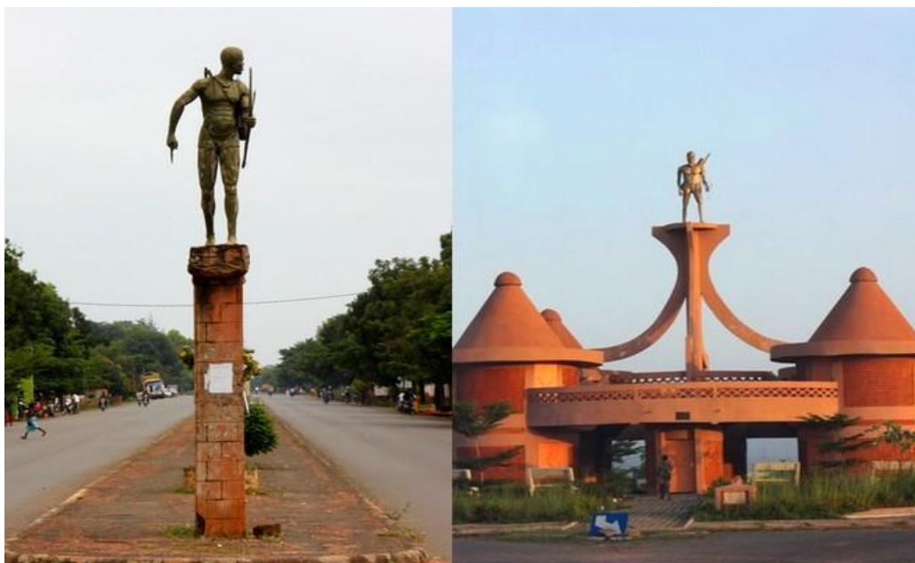
Dorogui Doro Sounon, , 1973, bronze, Natitingou, collection publique.