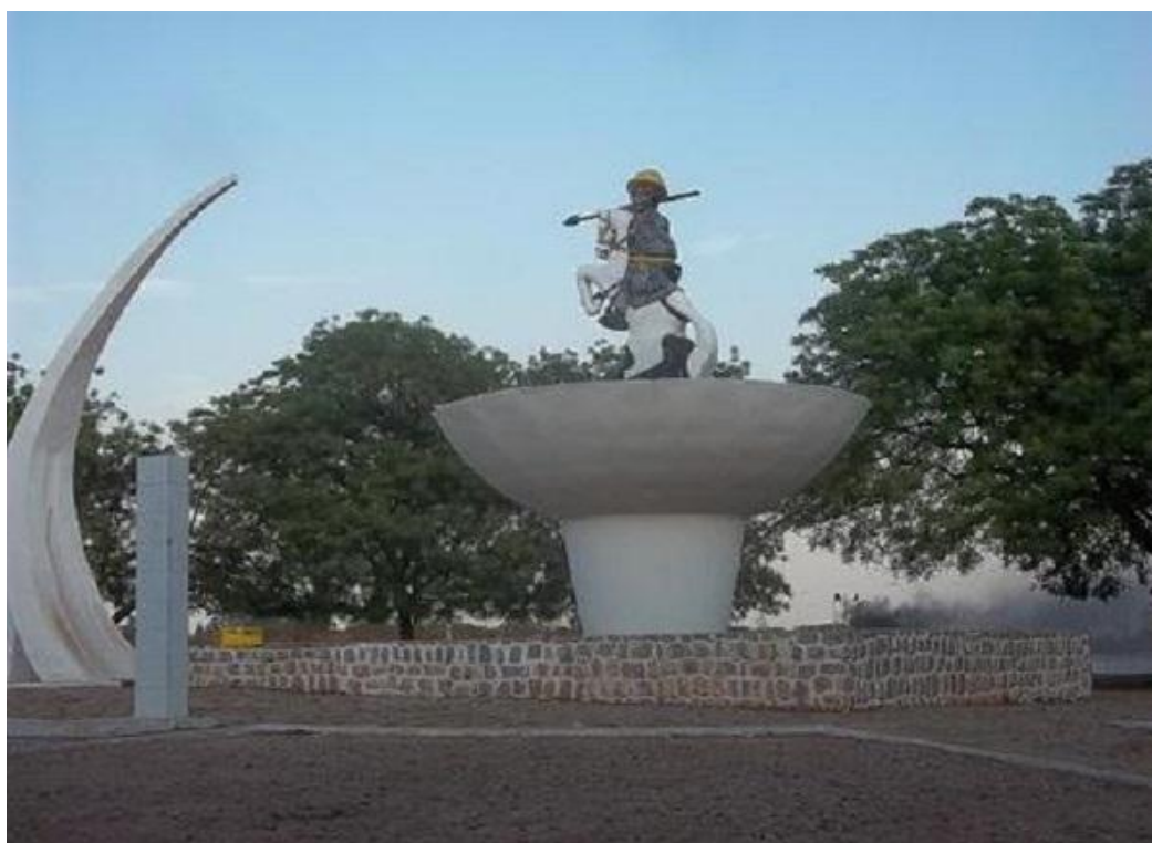
Dorogui Doro Sounon, 1971, restauré en 2008, fer, béton, ville, Parakou, Collection Publique