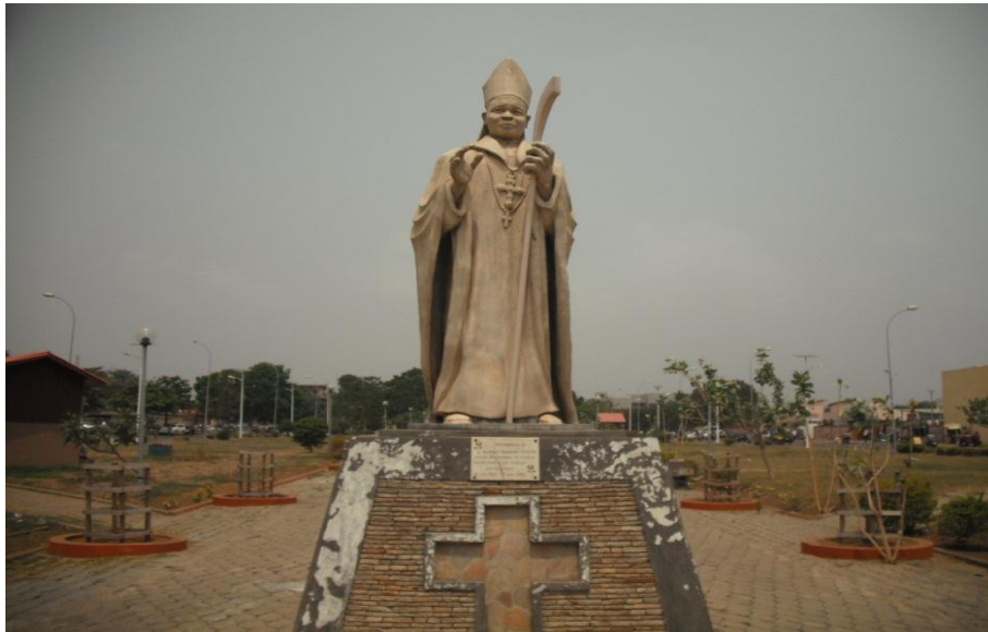
Benjamin MAFORT, 2011, béton + fer, Cotonou Collection Publique