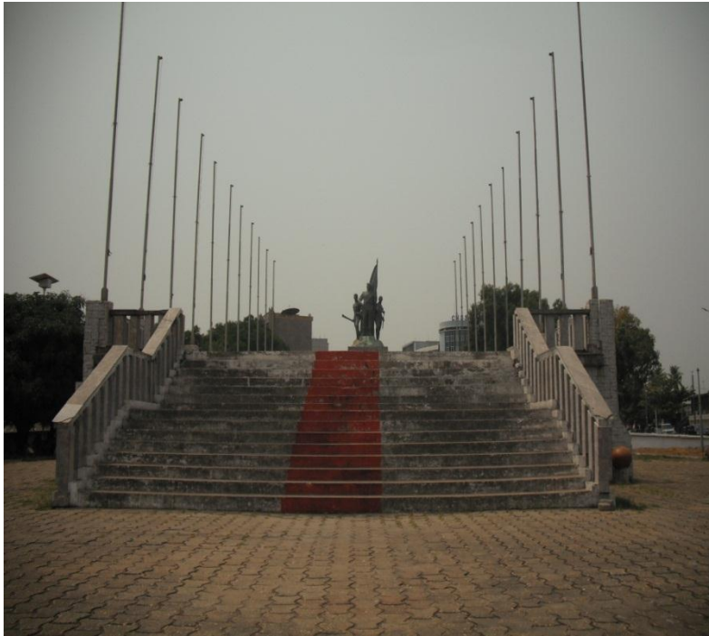
Œuvre du Gouvernement Nord-Coréen, , 1979, monument en bronze, Cotonou, Collection Publique