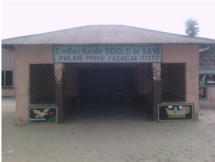
Devanture de la cour princière SOGLO de Savi

La famille KITI appartient à la branche de la famille Soglo de Savi (Ouidah).