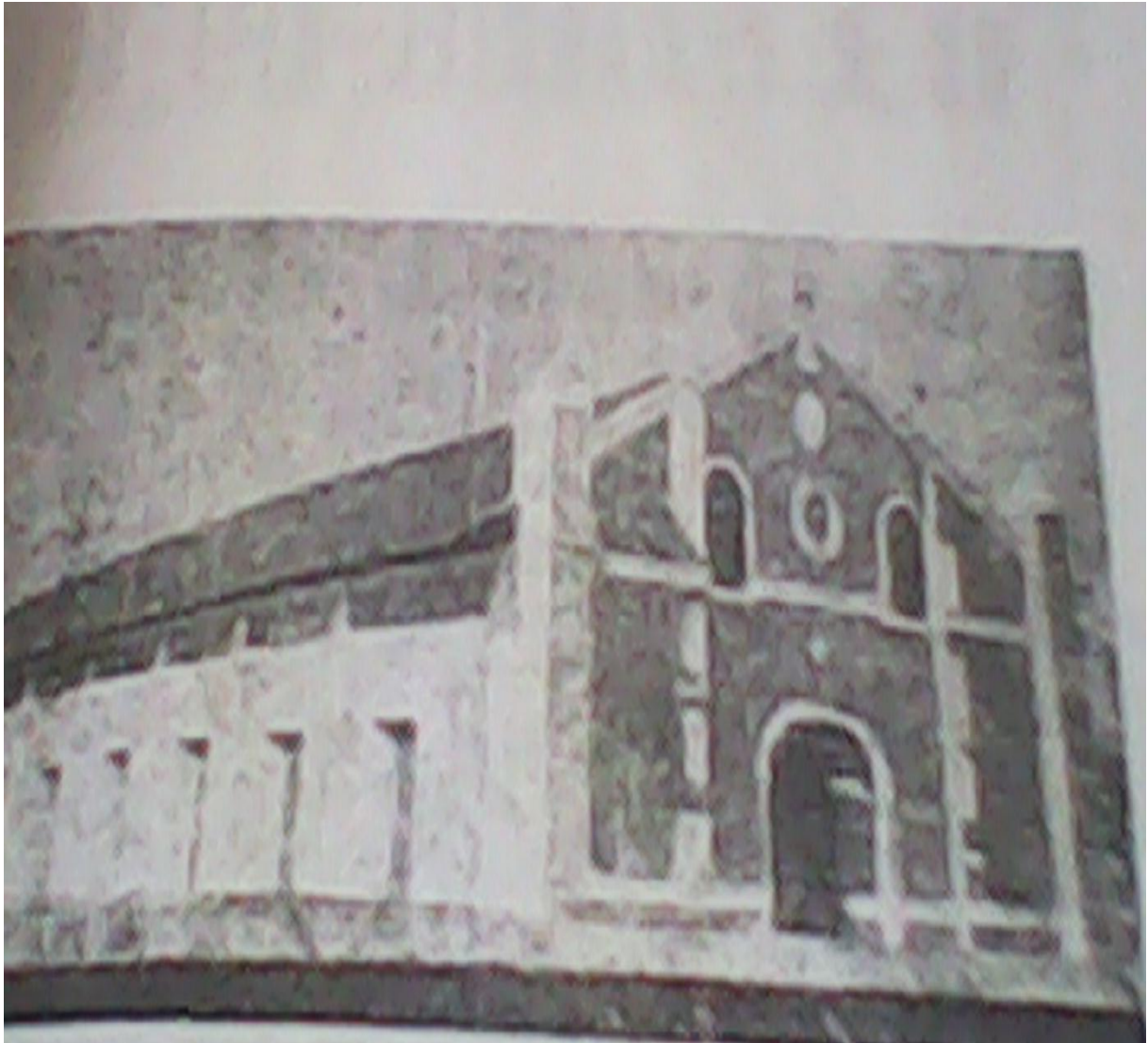
L'église construite par le Père Kiti (Photo tirée de la plaquette Il y avait 40 ans le Père Gabriel Kiti ).