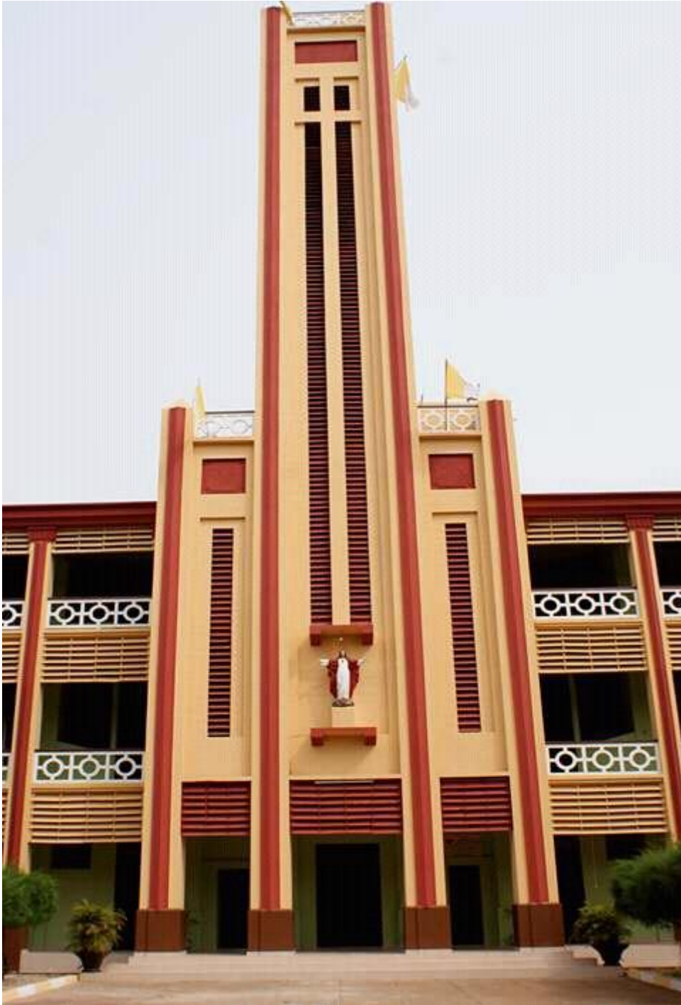
Le grand séminaire Saint Gall de Ouidah