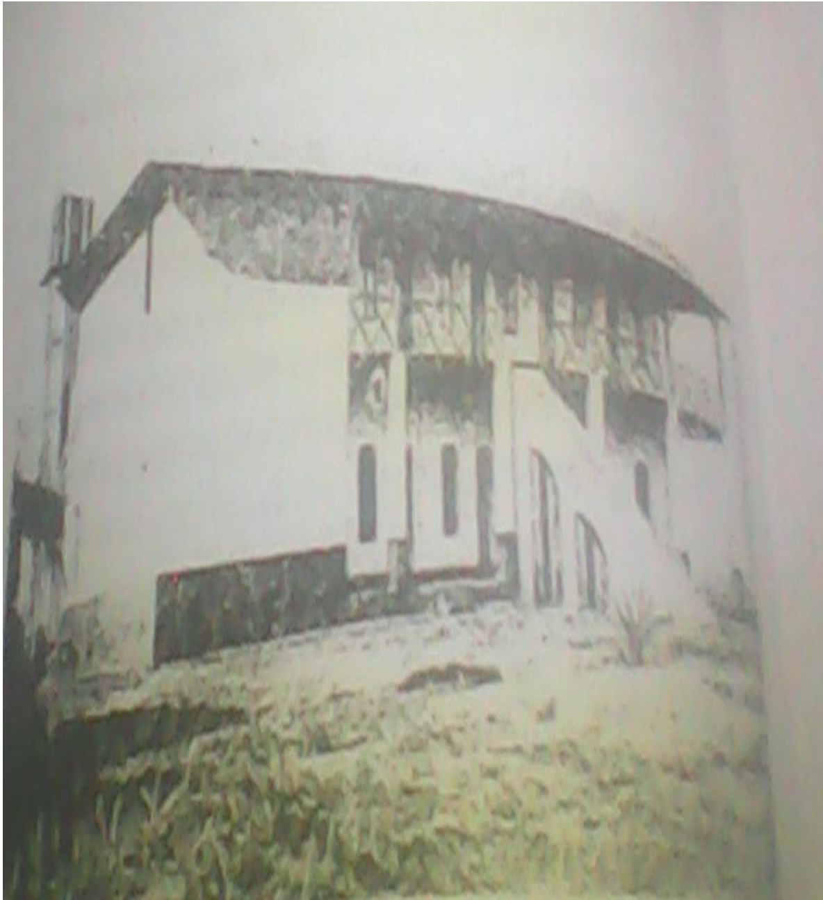
La ferme Sainte Jeanne d'Arc