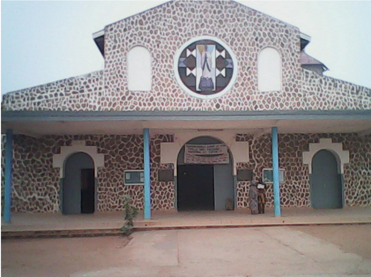
La nouvelle église de Covè vue de face. (Photo réalisée par Mlle Ariane Tchobo).