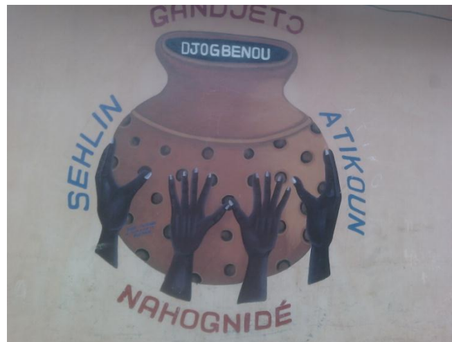
La jarre trouée (adjralazin) de la famille SOGLO

C'est de ce clan que vient la famille Kiti.