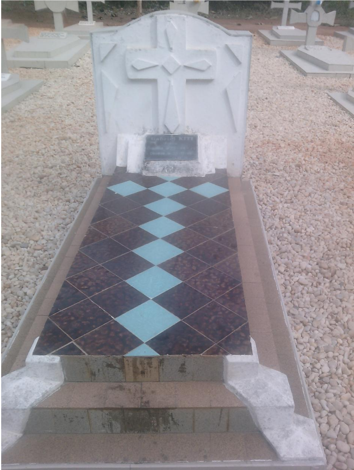
La tombe du Père Kiti au séminaire Saint-Gall de Ouidah. (Photo réalisée par Mlle Tchobo Ariane).