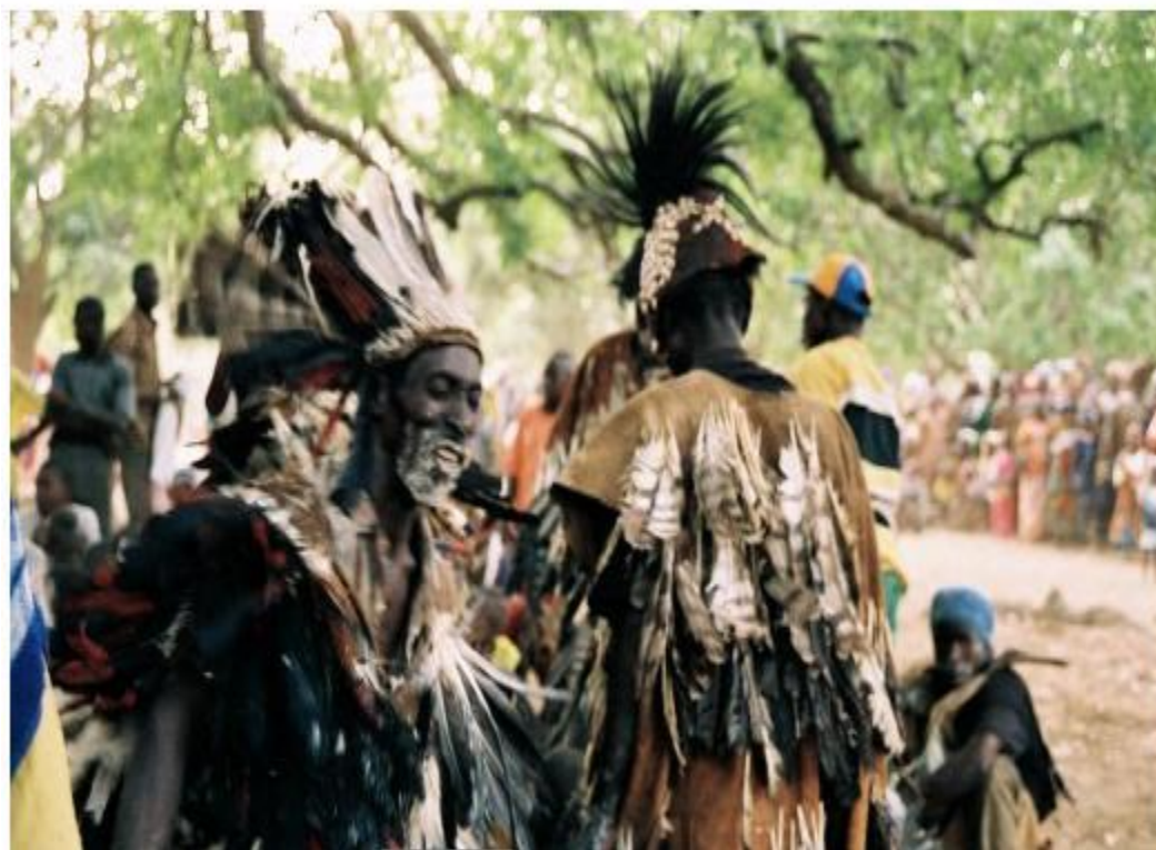
Image F : Les chasseurs dans leur tenue d'apparat lors d'une manifestation

Ces différents accoutrements sont, généralement, réputés nantis de vertus susceptibles de rendre son porteur invisible et invincible ; ils leur confèrent aussi une aisance dans leur mobilité.