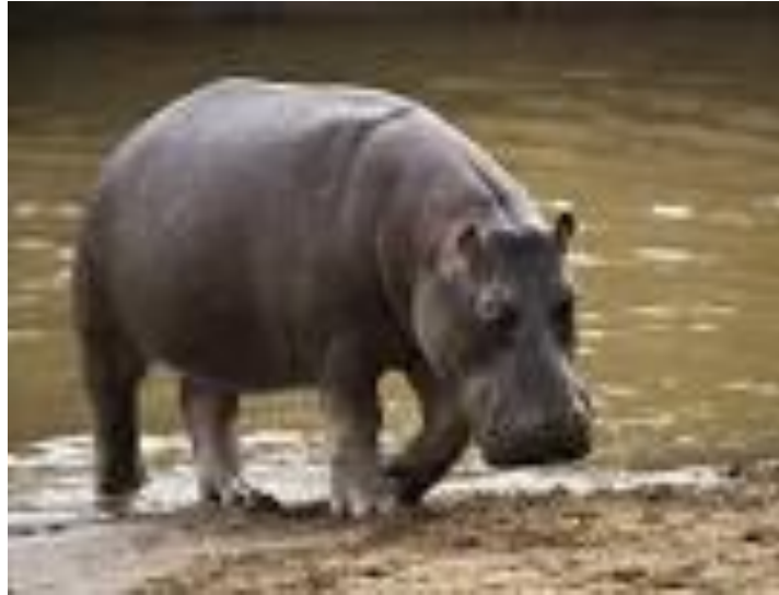
Image A : Hippopotame

Car, pour les Baatombu, c'est un animal très puissant qui possède des pouvoirs magiques.