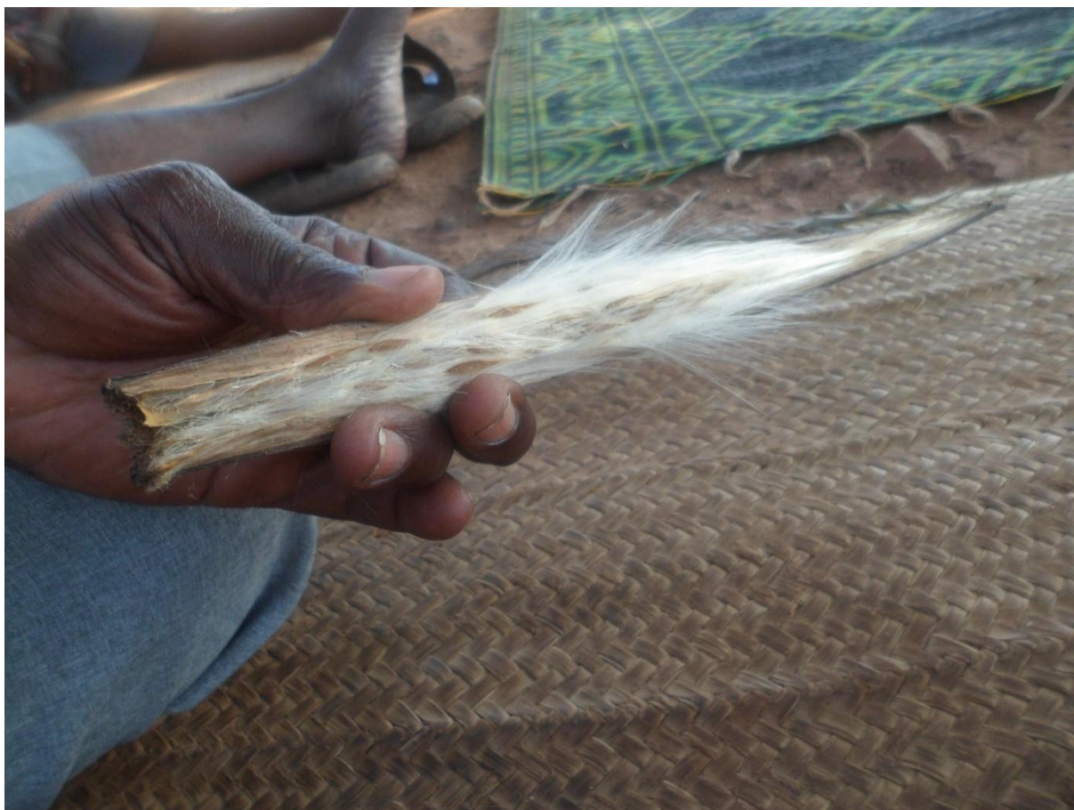
Image D : Le fruit du strophantus contenant les graines

Le médecin ne croit pas à ces déclarations et estime qu'il serait bien intéressant d'arriver à capter la confiance de quelqu'un afin de connaître exactement la composition de cette mixture mortelle. Eh bien ! Il le saura à titre posthume. Plus d'un siècle après, D. Débourou, lui, arracha la formule auprès des spécialistes de cette fabrication. Peut-être parce qu'il est natif de leur milieu, le Borgou. Il présente alors le processus de la préparation en ces termes :