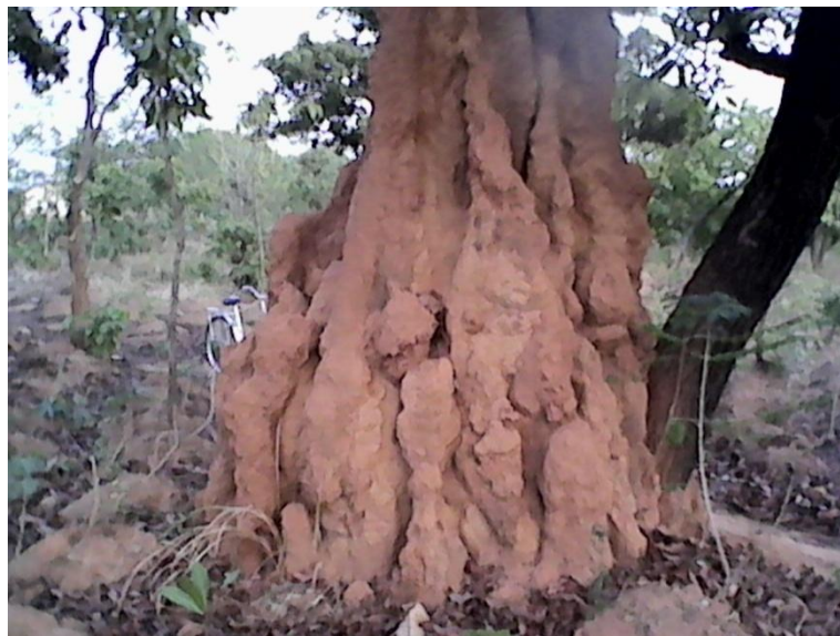
Photo n°1 : Termitière qui sert à désenvoûter un blessé à la flèche empoisonnée.