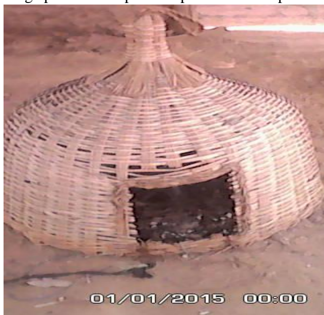
Photo n° 2 : Cage pour le transport des poules et leurs poussins, de la maison au champ.