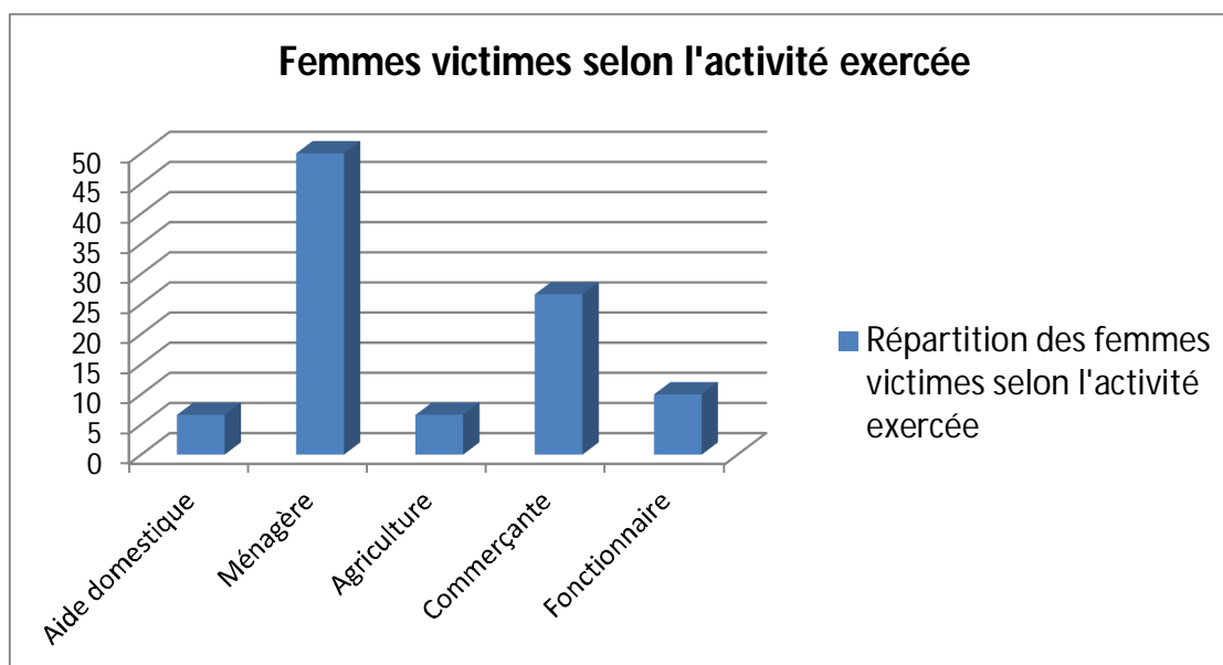
Figure 2 : Répartition des femmes victimes selon l'activité exercée