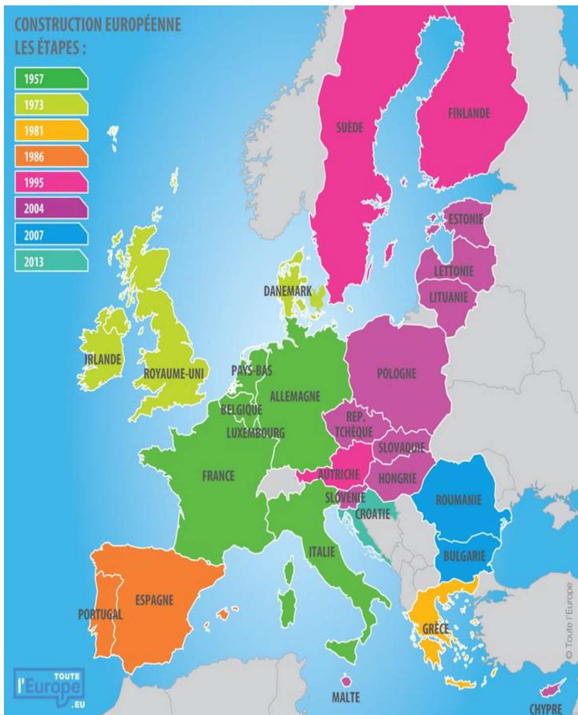
Figure 5: Carte des Etats membres de l'UE