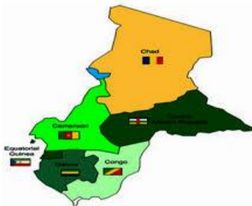
Figure 2 : Carte des Etats membres de la CEMAC