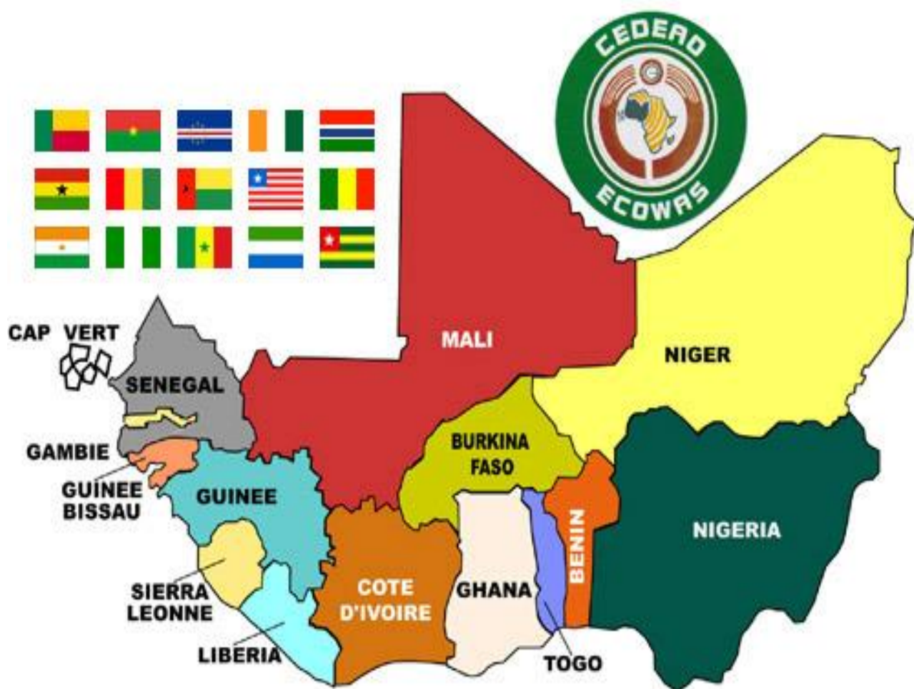
Figure 1: Carte des Etats membres de la CEDEAO